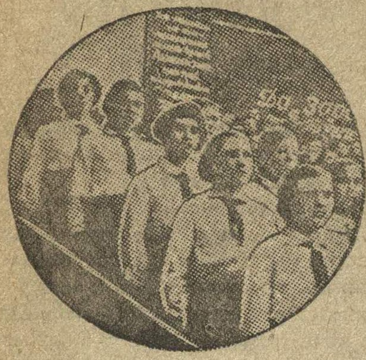
Юные пионеры приветствуют хозяев края — делегатов третьего краевого.

кадрами — основное в искусстве руководства.