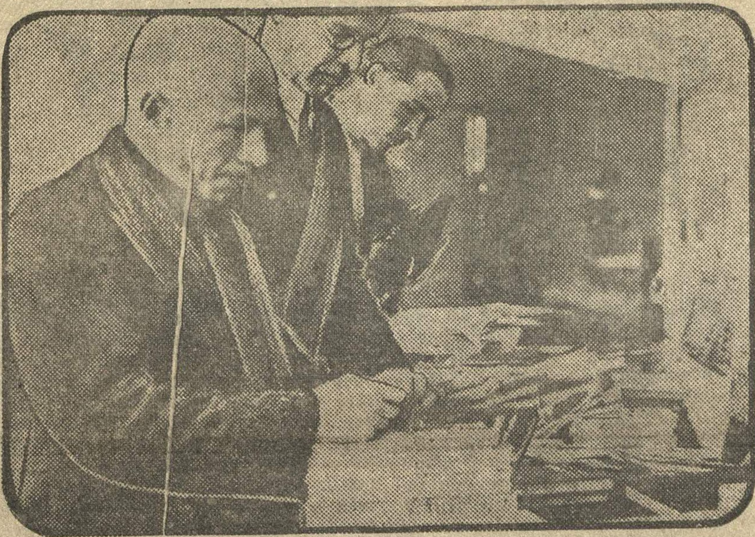
Делегаты Маробласти покупают в газетном киоске литературу.