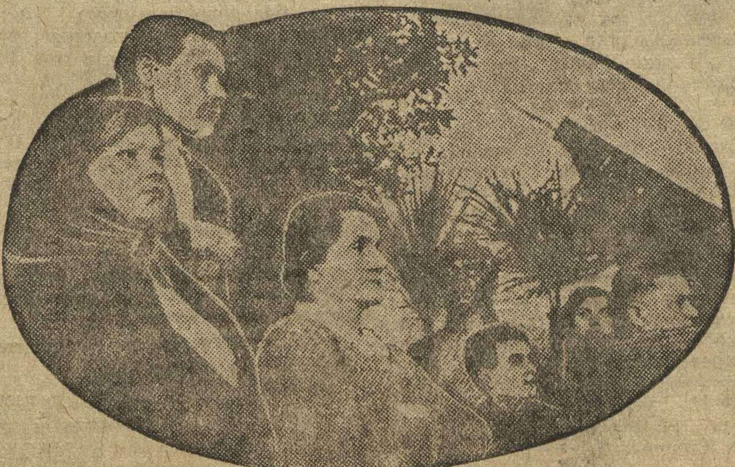
Слушают доклад тов. Кагановича.

Партия и правительство на основе успехов коллективизации и решения зерновой проблемы решили от карточной системы на хлеб перейти к развернутой советской торговле, которая должна будет все больше и больше развертываться и по другим видам товаров. Мы должны в нашем крае добиться того, чтобы не только г. Горький, но каждый районный центр стал центром культурной образцовой советской торговли, чтобы каждый колхозник,