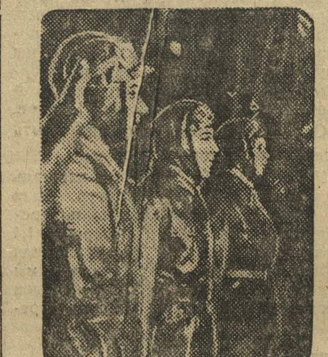
Красноармейцы и командный состав N-ской части приветствуют III краевой съезд советов.

♦♦ В своем докладе тов. Карпов отмечает, что годы от II к III краевому съезду советов отмечены значительными достижениями в области народного здравоохранения. Но тем не менее — подчеркивает тов. Карпов, — мы отстаем от все возрастающих потребностей рабочих и колхозников. Если количественно мы выросли, то качественно наша работа еще чрезвычайно отстает.