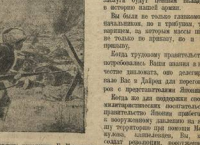
Ваша задача — организовать работу.