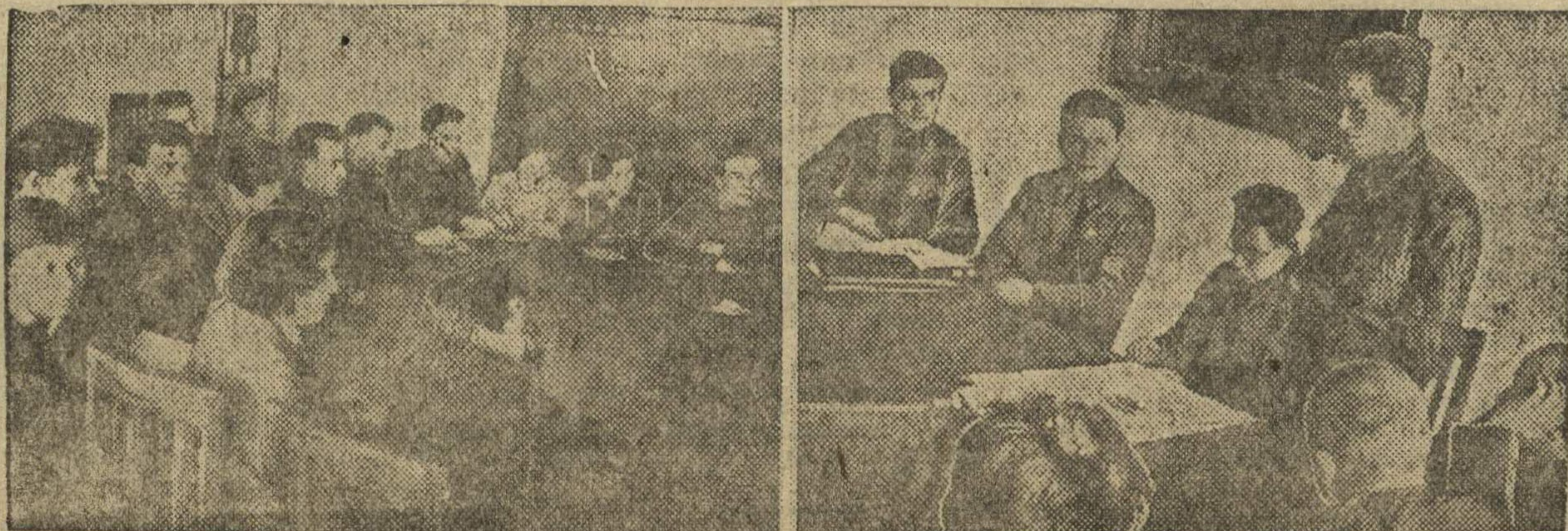
Беседа комсомольского руководящего актива с тов. Прамнэком.

В чем же дело? Почему рядом Чувашия идет в первых рядах, показывает высокие темпы, а Марийская область стала сдавать? Главная вина в областном руководстве и в первую голову областного комитета партии. В областном руководстве появилась хромота, товарищи наделали ошибок, по-большеви-