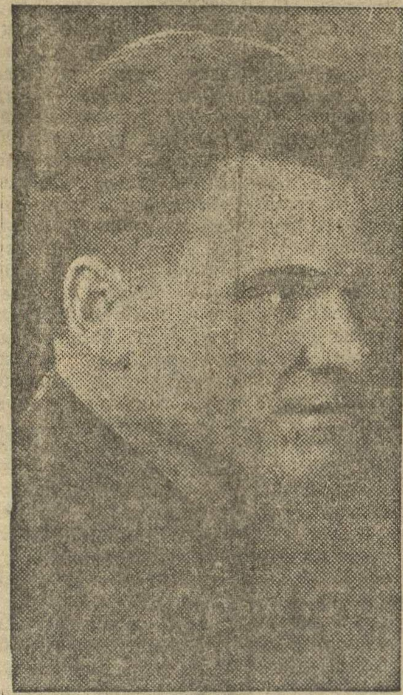
представляет Горьковский край.

Какие задачи стоят перед нашим Горьковским краем?