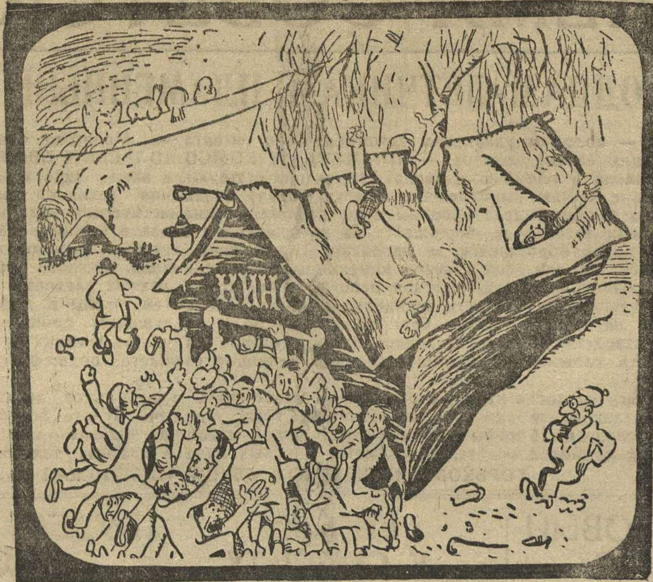
Рис. Н. Головина

Турбинно-генераторный завод в Харькове, оборудованный по последнему слову мировой техники, осваивает производство турбин в 50 тысяч киловатт. Лучшая ударница Каминская.