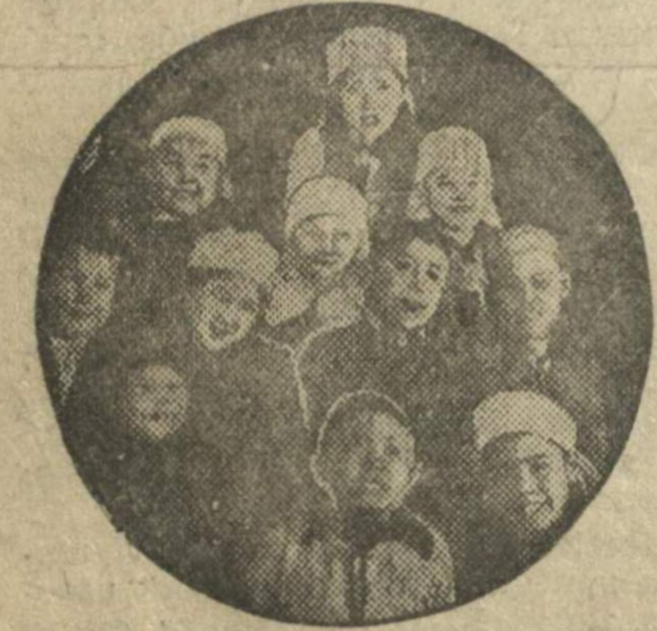
Группа школьников-казаков (нацмен Молитовки), прибывших на краевой детский утренник.

12 января в доме художественного воспитания детей проходил краевой детский интернациональный утренник. Дети разных национальностей — чувашки, удмурты, марийцы, американцы, татары, казаки, русские демонстрировали торжественно-сталинскую национальную политику.