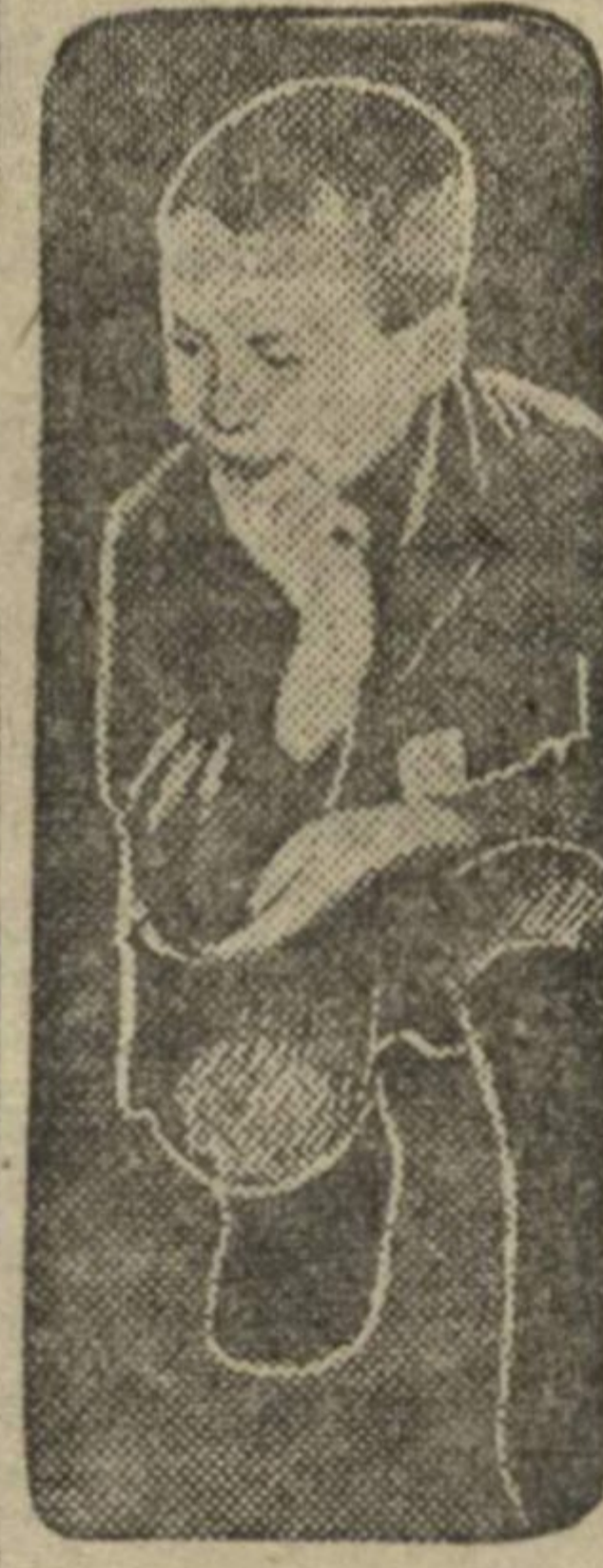
Юный рассказчик Петья Петров

В олимпиаде приняли участие свыше 30 ребят.