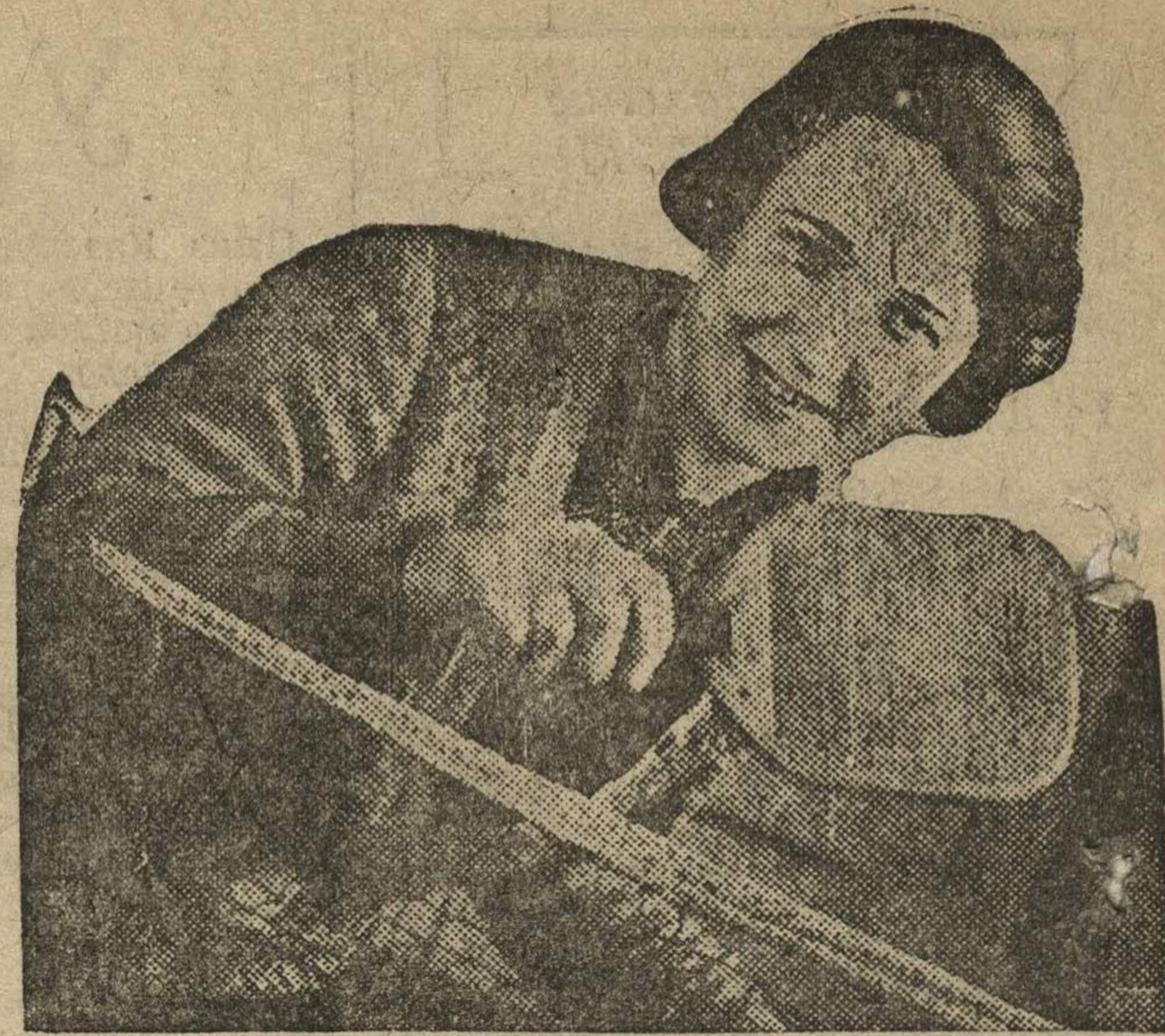
Как можно проводить домашний досуг. В магазинах появились в продаже домашние игры по доступным ценам. НА СНИМКЕ: игра в пинг-понг. Фото Гуревич.

25 января в 9 часов утра лыжная команда гор. Дзержинска принесет эстафету в Гороховец и передаст ее Ивановской области. Этим будет открыто лыжниками нашего края 2500 километров.