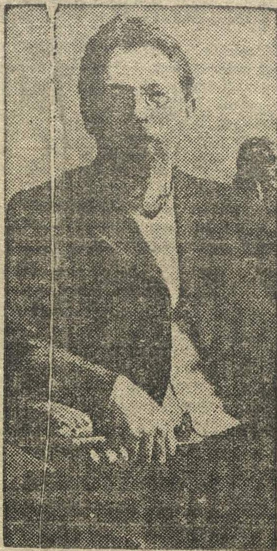
Антон Павлович ЧЕХОВ.

Таким образом, твердо устанавливается, что Чапасев Василий Иванович родился в дер. Будайке, Чебоксарского района, Чувашской АССР. (Крайроста).