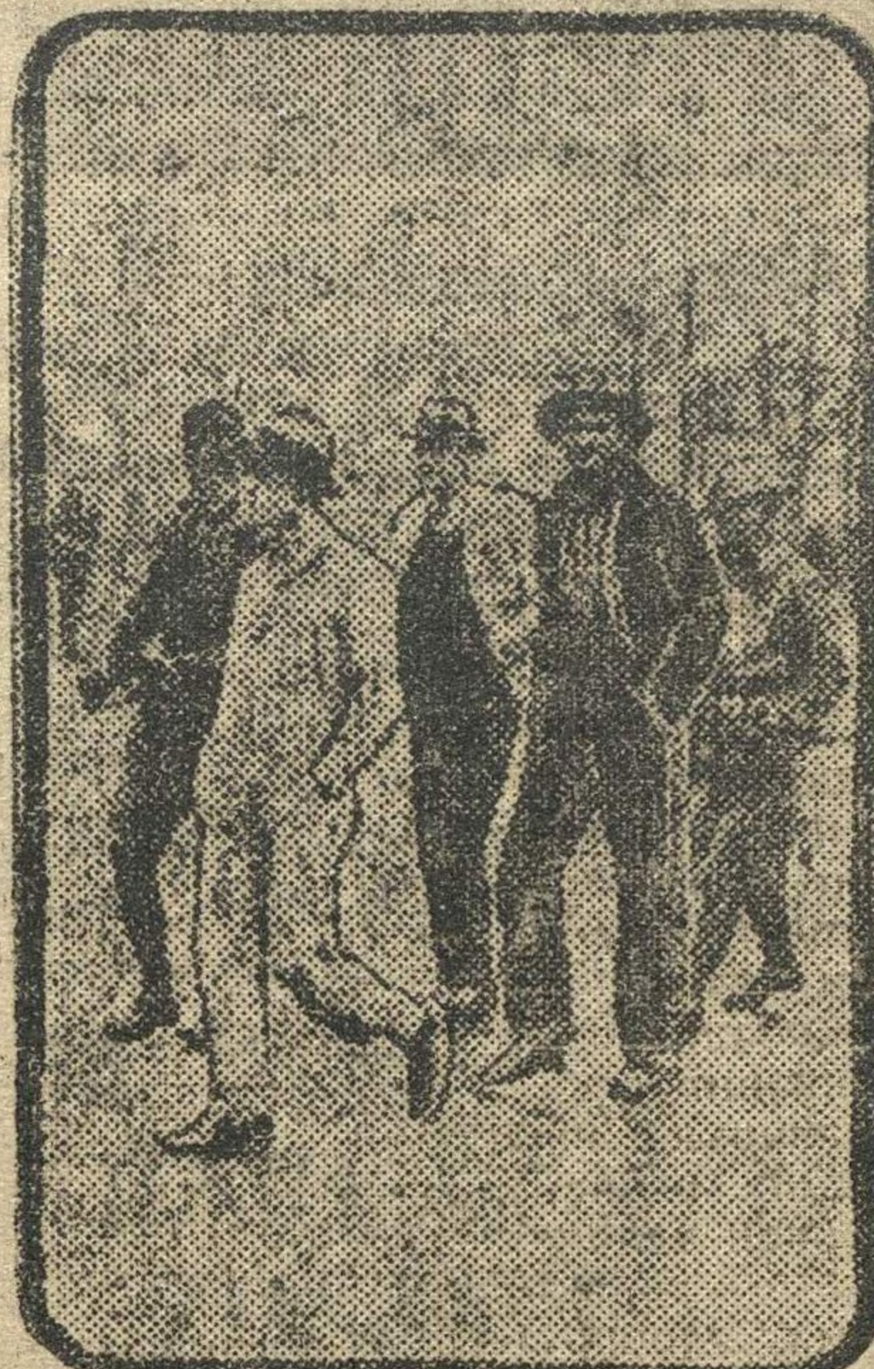
Национальные гвардейцы ведут в тюрьму участников забастовки «Ричмондской чулочной фабрики» (штат Джорджия, США).

Параллельно с ростом лиги в стране быстро развивается пионерское движение. В настоящее время в США насчитывается не менее 12.000 пионеров против 4000 в 1932 году. Орган пионерской организации «Пионер» издается тиражом в 16000 экземпляров.