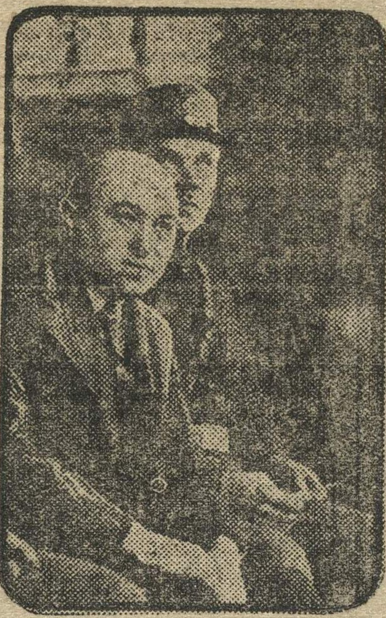
Тов. Ракоши в зале суда.

Приговор ожидается не раньше 5-6 февраля. В близких судах полагают, что Ракоши, вероятно, будет приговорен к смертной казни.