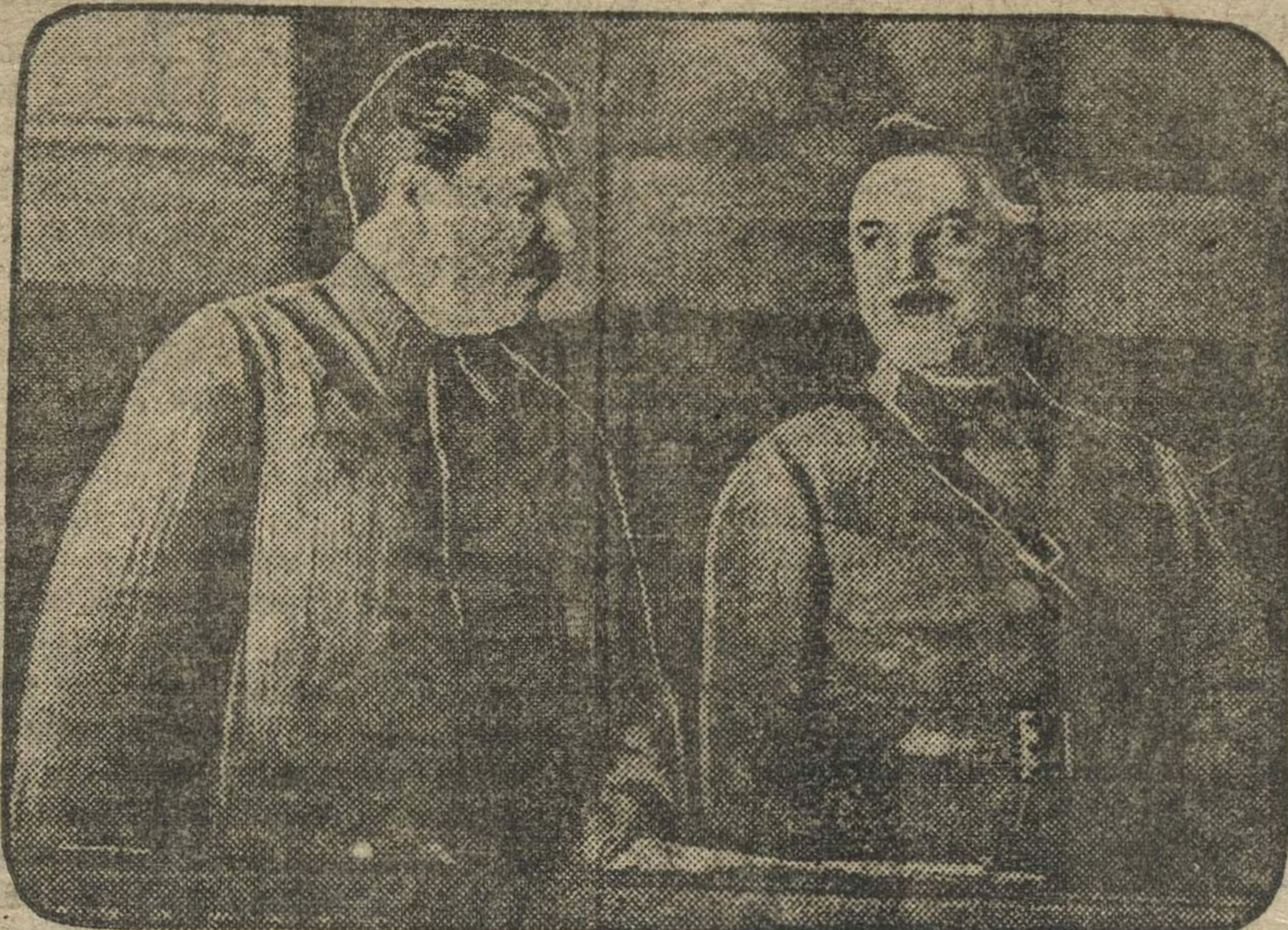
Тов. СТАЛИН и ВОРОШИЛОВ в президиуме съезда. Дневник съезда