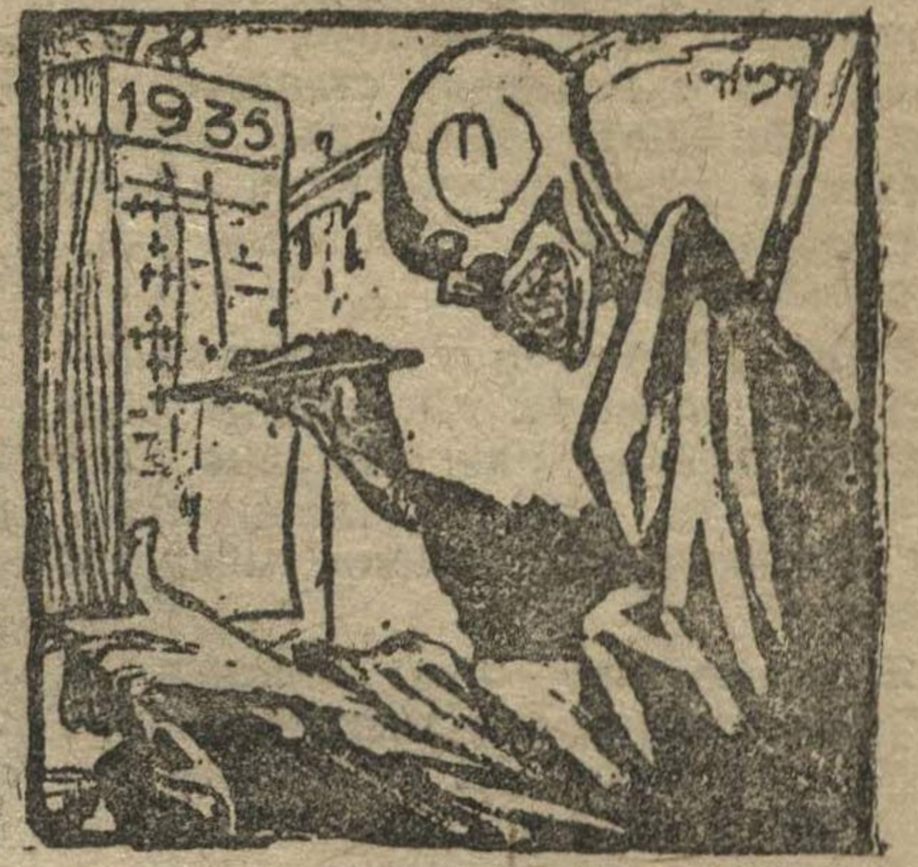
— МНЕ И В 1935 ГОДУ НЕ ТРО- ЗИТ БЕЗРАБОТИЦА. («Клад-Дерадач»).