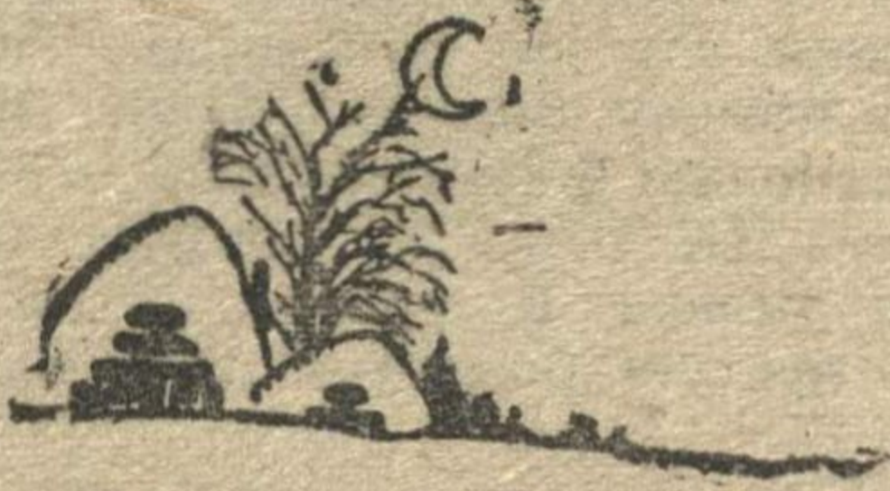
Рис. Н. ГОЛОВИНА.

Петунин находится на побегушках при райкоме комсомола. Он занимается всем, чем угодно, только не организацией физкультуры в районе.