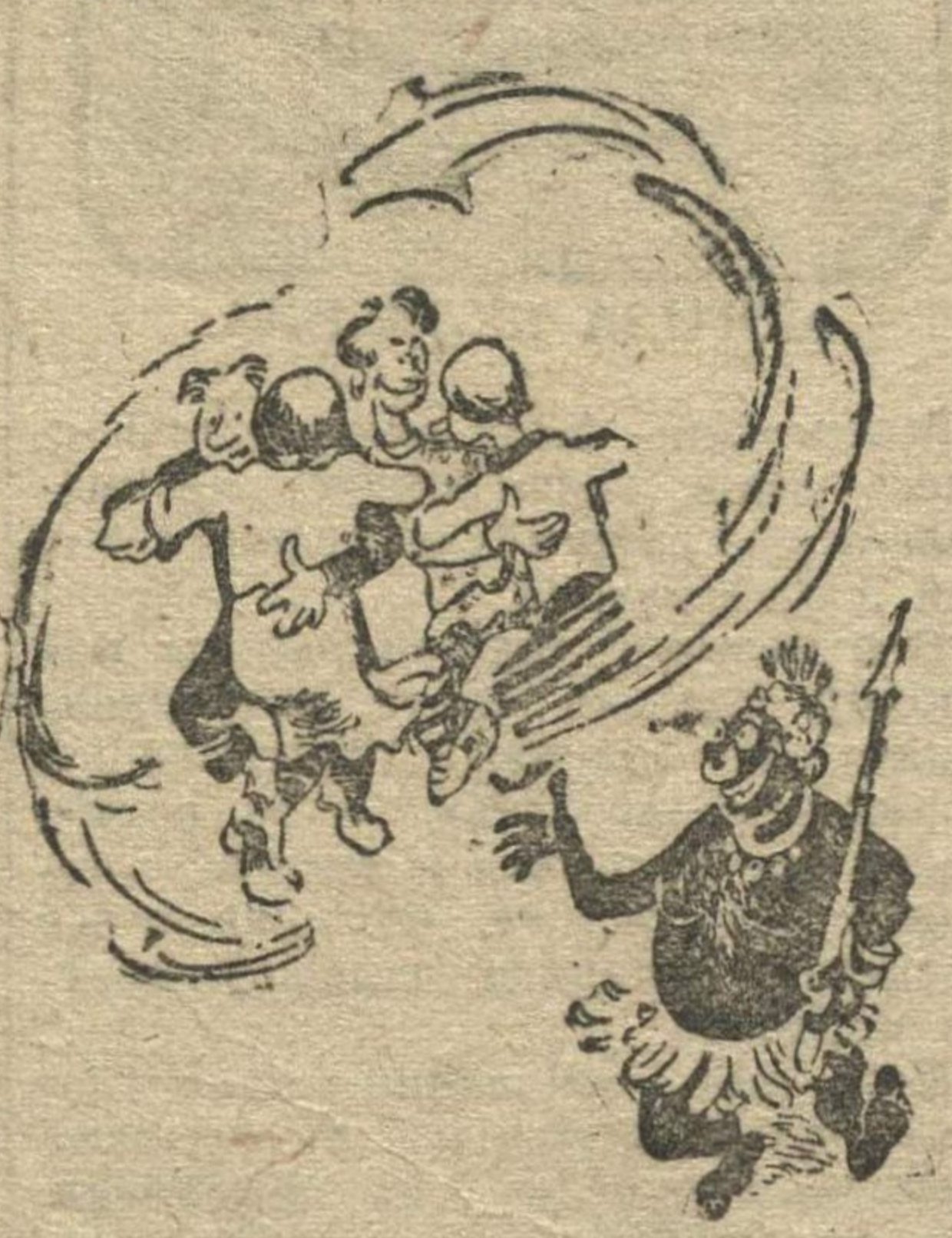
Рис. Н. Головина.

Как-то раз в Шахунье был проездом папуас, И, посетив шахунские беседы, Сказал с усмешкой крепкие слова: — У нас на островах Сто лет назад так танцевали деды Во-время пиршества вокруг огня, Но мы, сейчас танцуем веселей.