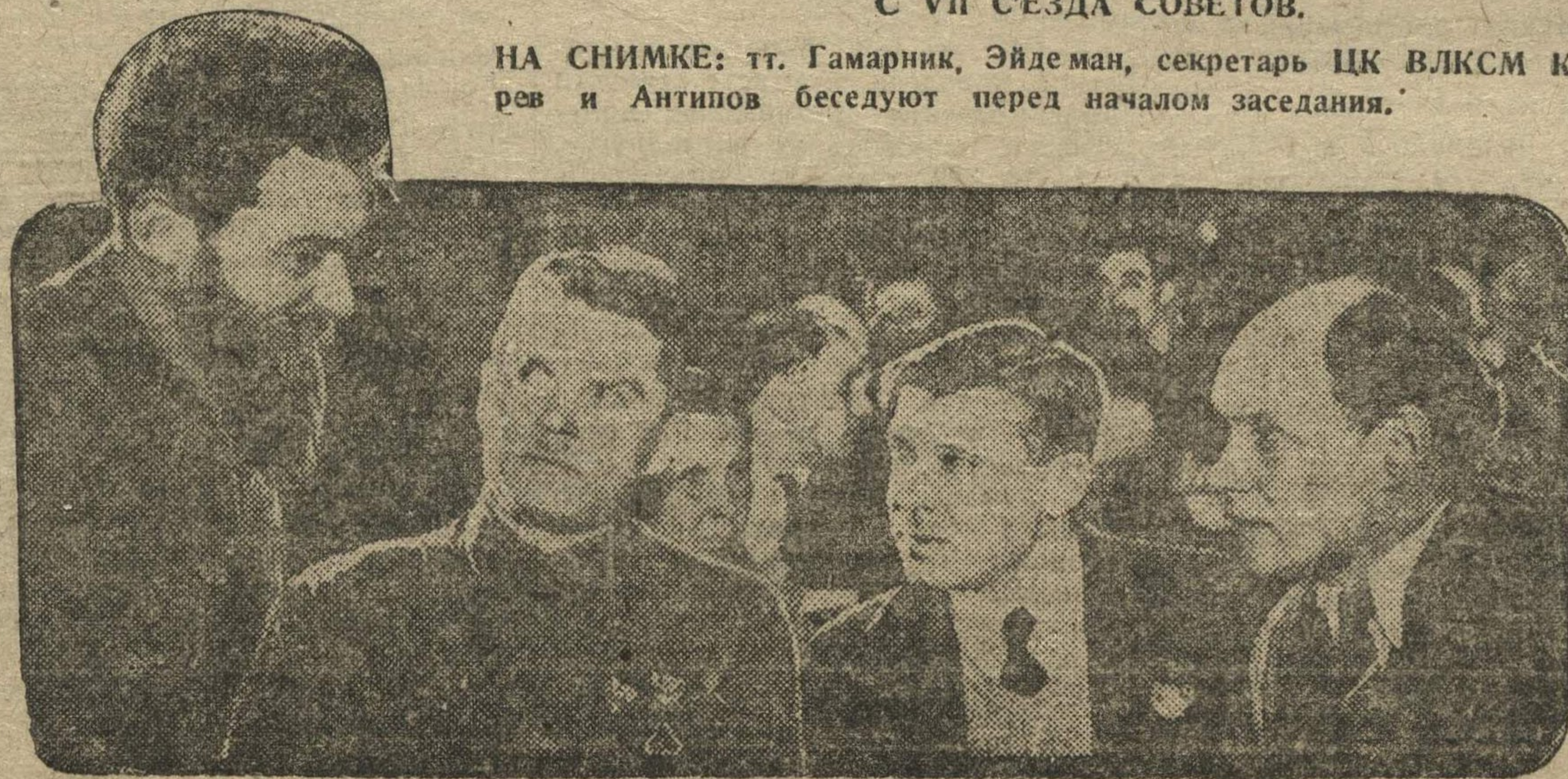
НА СНИМКЕ: тт. Гамарник, Эйдеман, секретарь ЦК ВЛКСМ Косарев и Антипов беседуют перед началом заседания.

В САСШ распространяется нату- ральный обмен: — «Я УПЛАЧУ ВАМ ВМЕСТО ДЕНЕГ ЖИРА- ФОМ» («Нью-Йоркер»).