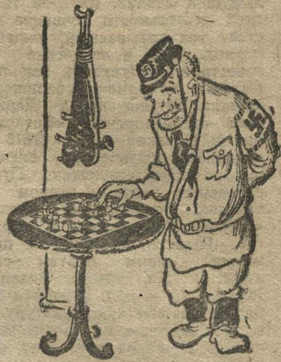
Рис. Н. ГОЛОВИНА.

«Назначили шахматным чемпионом, а как противника обгладить, побить — не сказали, дубинкой что ли?»