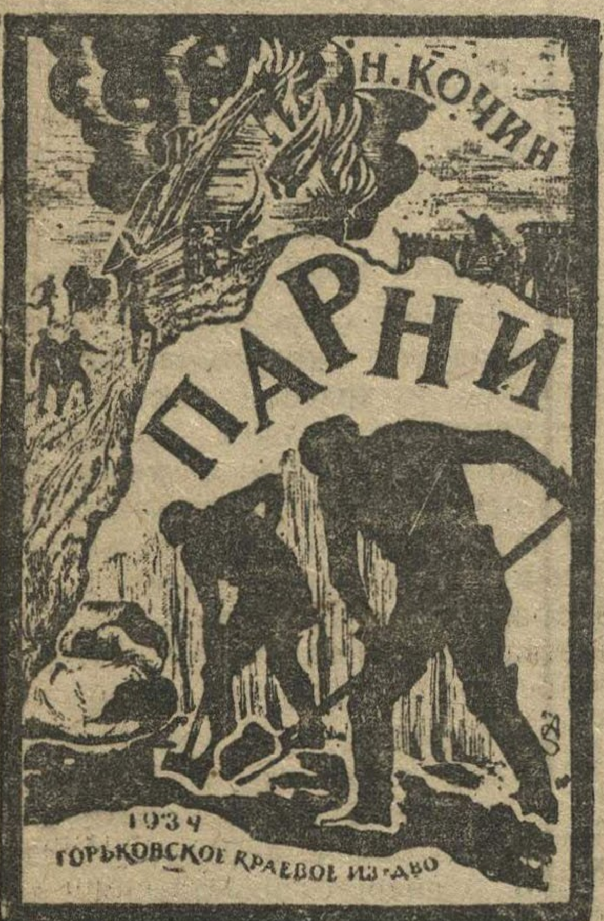
Супербложка книги Кочина «Парни».

Я перевстречал на заводе сотни молодых людей, меняющих свое лицо свою жизнь. Видел тех, которые будучи объята жадной жаждой, цапали все, что плохо лежало, таким скоро сбивали клыки и они убежали с завода. Видел любителей выезжать на шею соседа, подобнох сурово карал коллектив. Рассказывали о провозах, проходимцах и мерзавцах, пытавшихся совать нам палки в колеса. Это был людской плач, тень дела. Само наше дело было иным, совсем иным, наши люди тоже были вовсе другими.