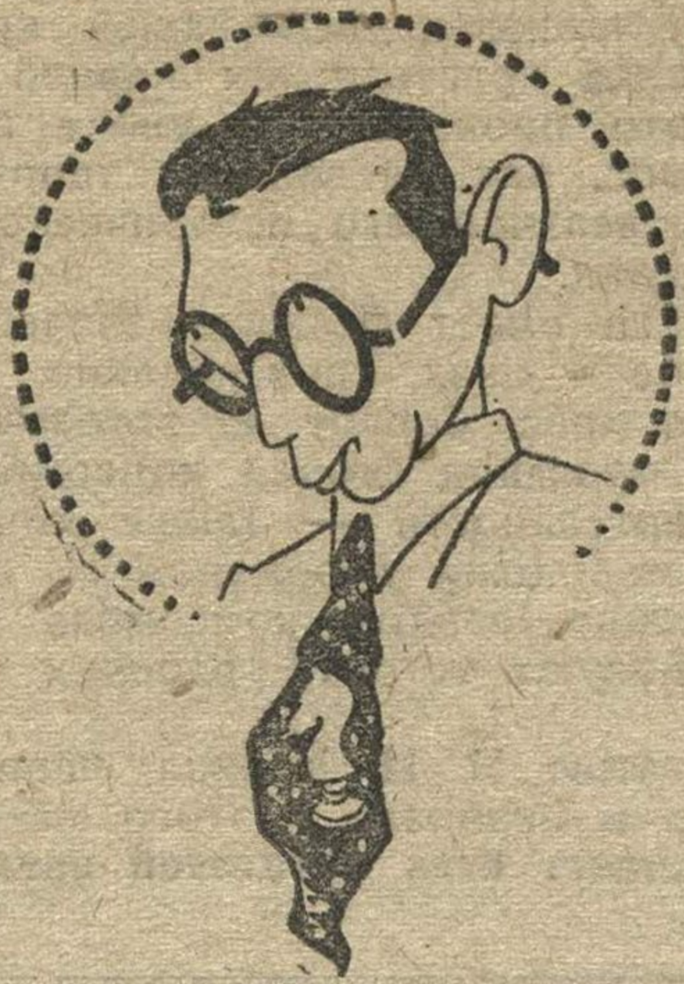
Чемпион по шахматам Ботвинник.