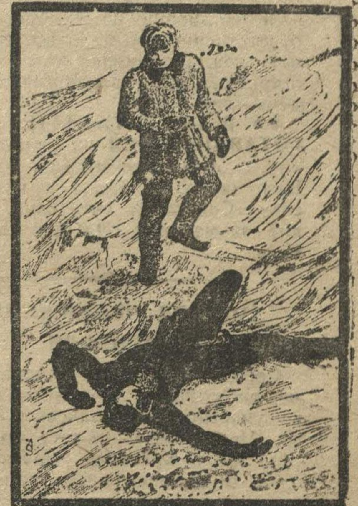
Иллюстрация из книги «Парни» художника Сурикова.

Мозгуна я тоже не выдумал. Биографию этого человека рассказал мне один партработник в вагоне московского поезда. Беспризорник Мозгун утащил однажды портфель у этого партработника. А он оказался директором московского треста. Директор треста поймал воришку и пристроил его учиться. Из беспри-