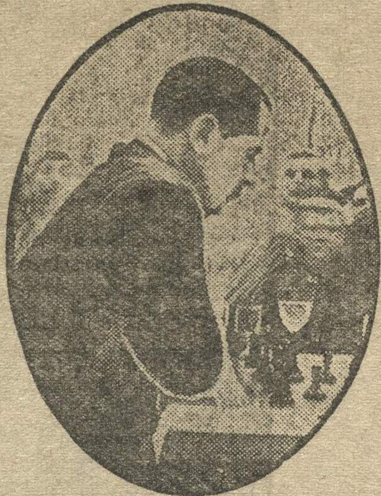
Экс-чемпион мира Капабланка.

♦♦ Бригада московских художников, в числе которых заслуженный деятель искусства И. И. Бродский, Скаля, Сварог, готовит альбом портретов участников турнира.