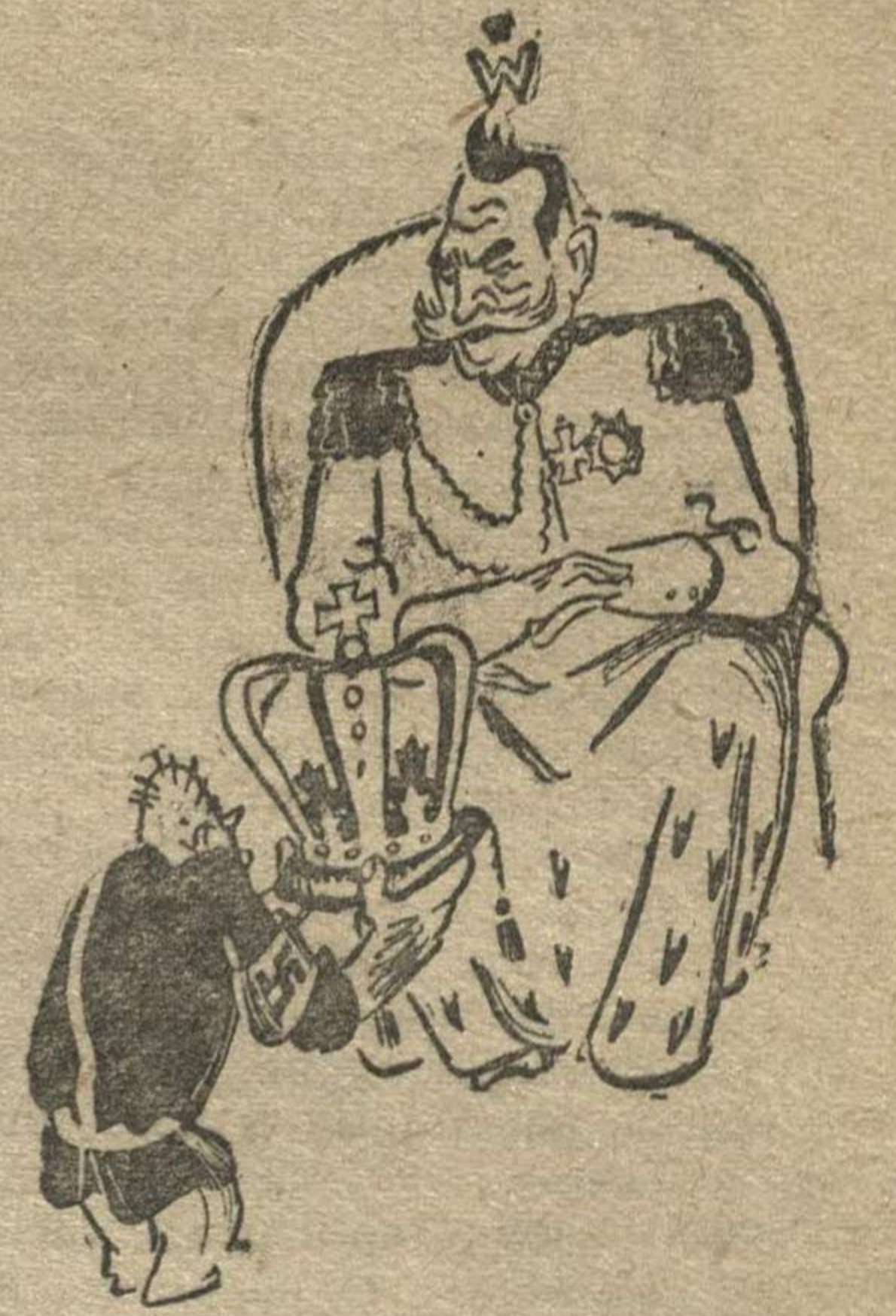
Рис. Н. Г.

Разрешение на трехмесячное пребывание в Германии предоставлено Гитлером бывшему кайзеру. Разрешение будет возобновляться ежегодно.