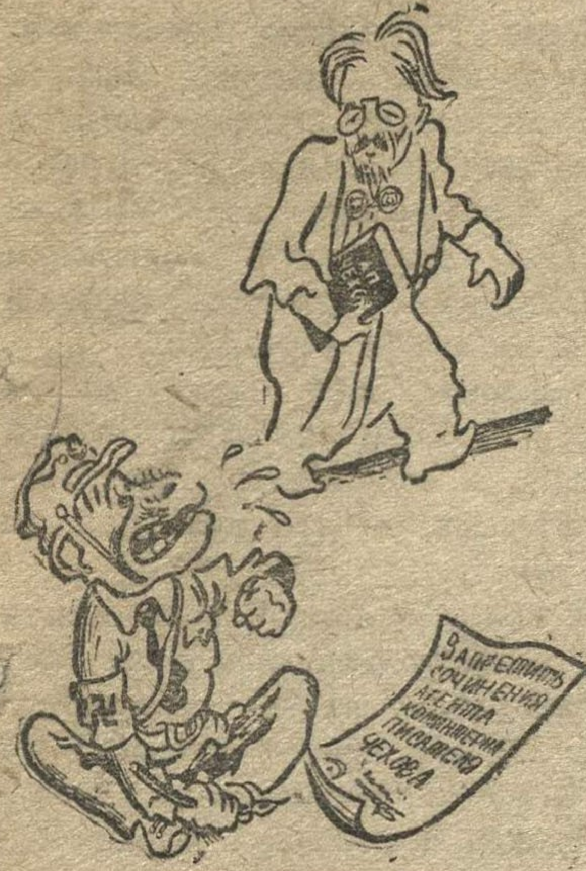
Рис. Н. Г.

Случай, когда Чехову пришлось столкнуться с унтером Пришибеевым.