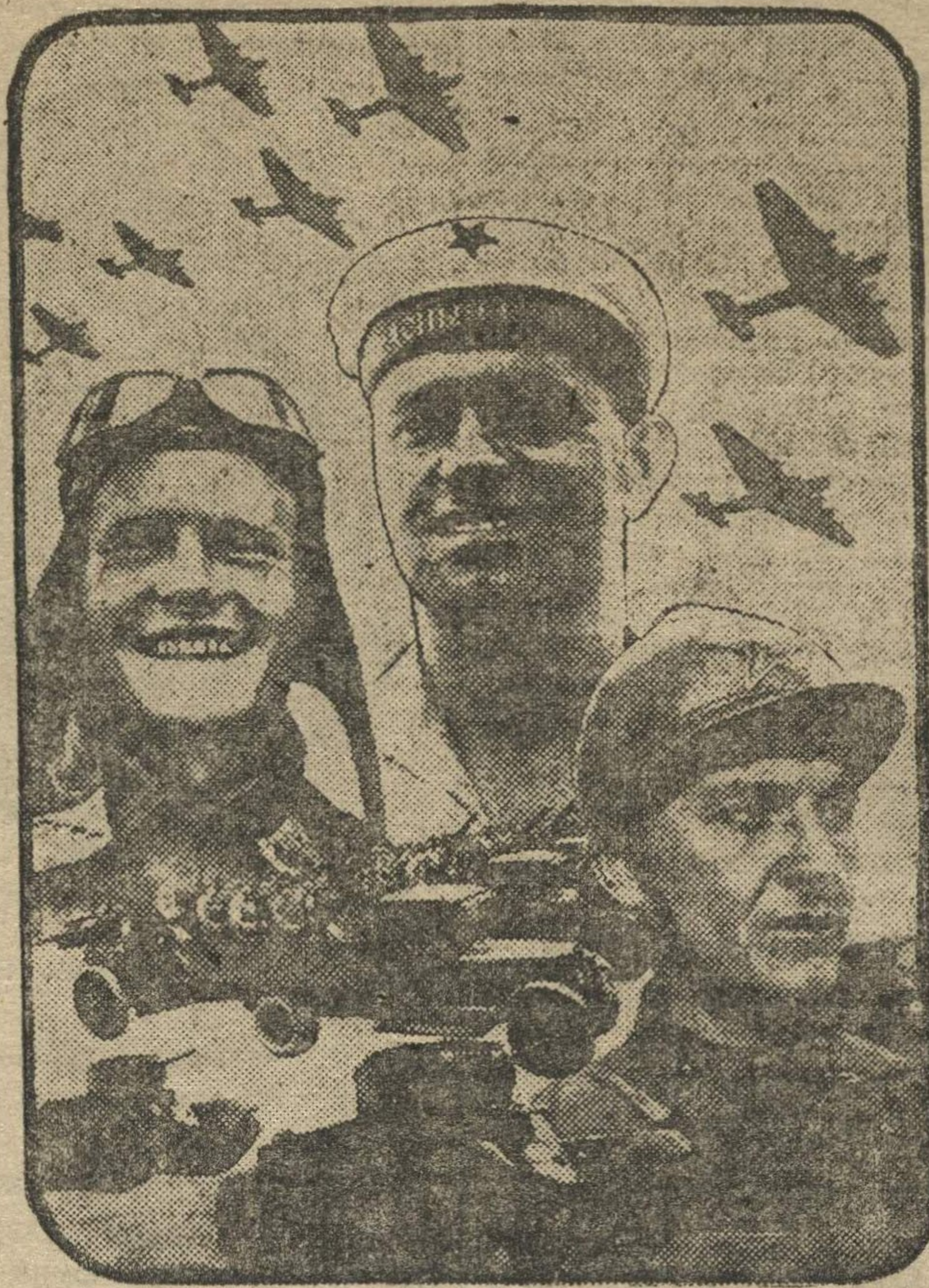
На-страже социалистической родины.

Мы не остановимся на этих первых скромных успехах. Мы отчетливо видим растущую угрозу новой