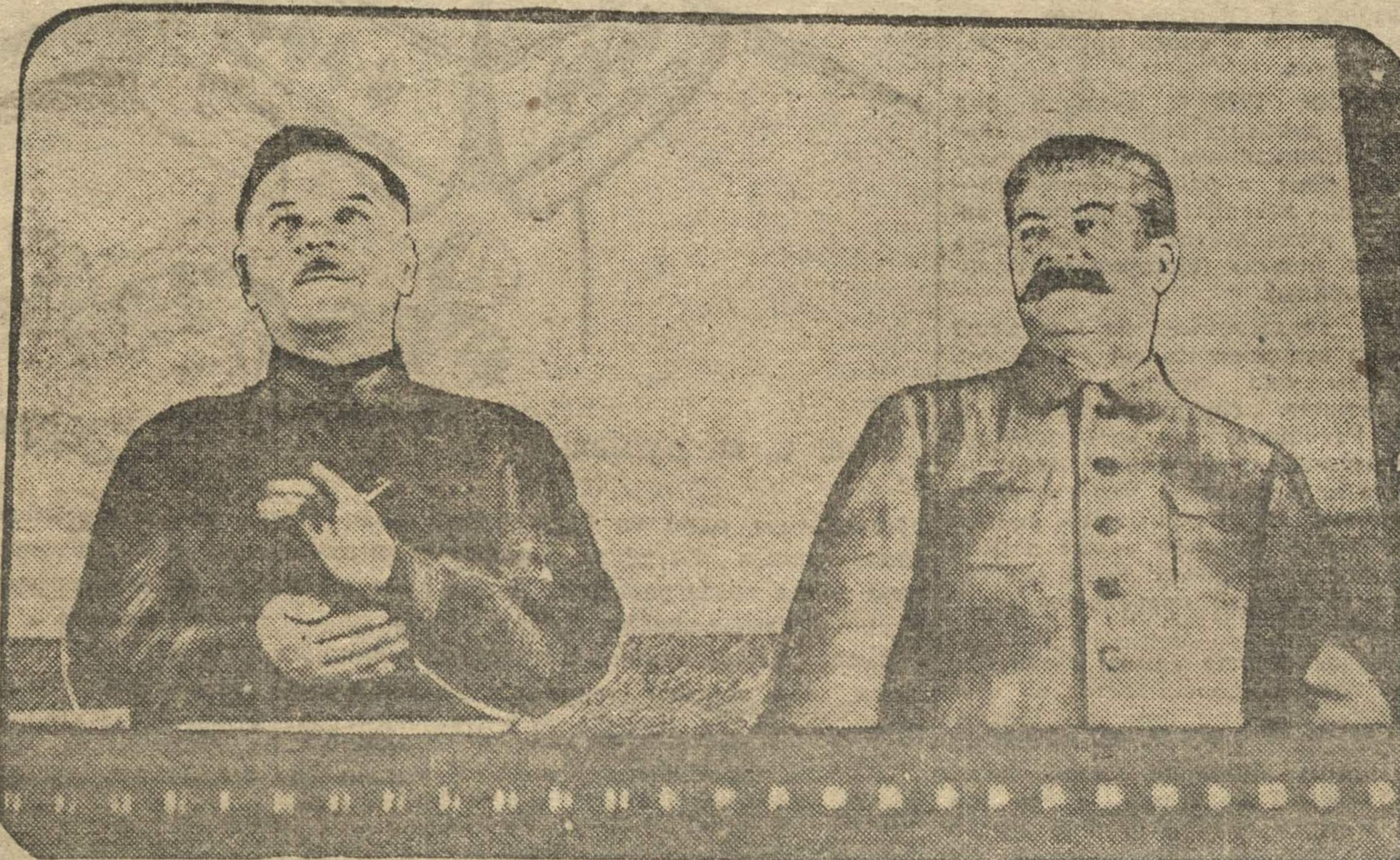
Тов. СТАЛИН и ВОРОШИЛОВ в президиуме II всесоюзного с'езда колхозников-ударников.