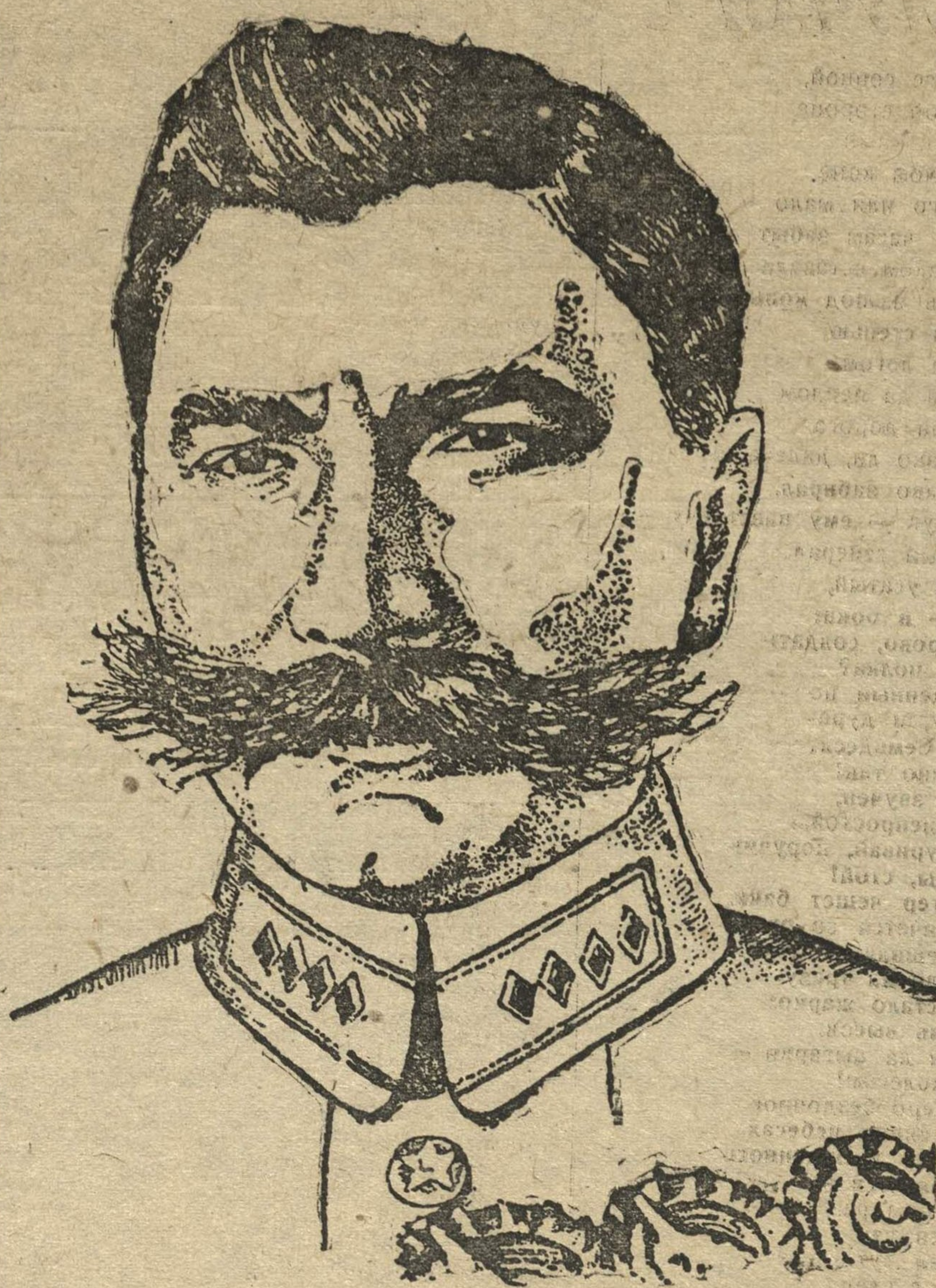
Тов. С. М. Буденный

«В боях с белыми едва не погиб тов. Ворошилов. На станицу Отрада, где расположился Реввоенсовет армии, налетела на рассвете конница белых. Тов. Буденный чистил в это время свой револьвер, а тов. Ворошилов пришивал пуговицы к своей тужурке. Вдруг —