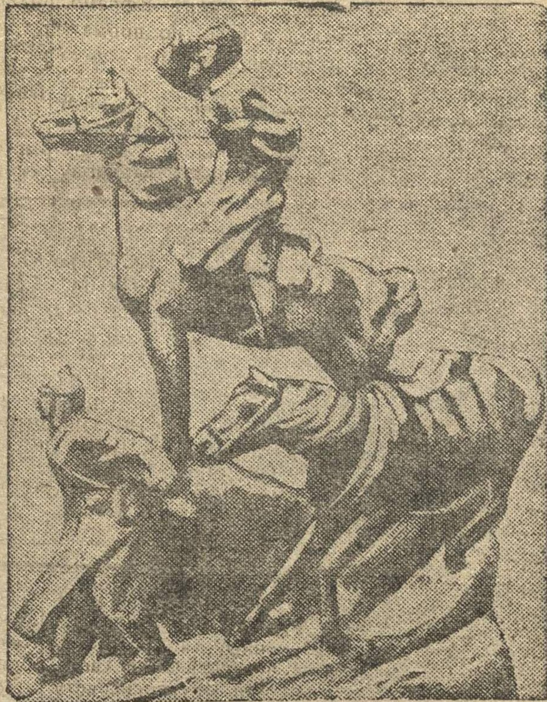
«КОННАЯ РАЗВЕДКА» — скульптура Виленского.

ническом ужасе, оставляя сотни сотоварищей обезглавленными, понеслась на Аксай. Пехота, изрядно получившая, что ей причиталось, тысячами, с поднятыми вверх руками, с молящими лицами, бежала навстречу нашим полкам, побросав оружие. Только автоброневики, танки и пулеметные команды держатся стойко. Там сплошь офицеры.