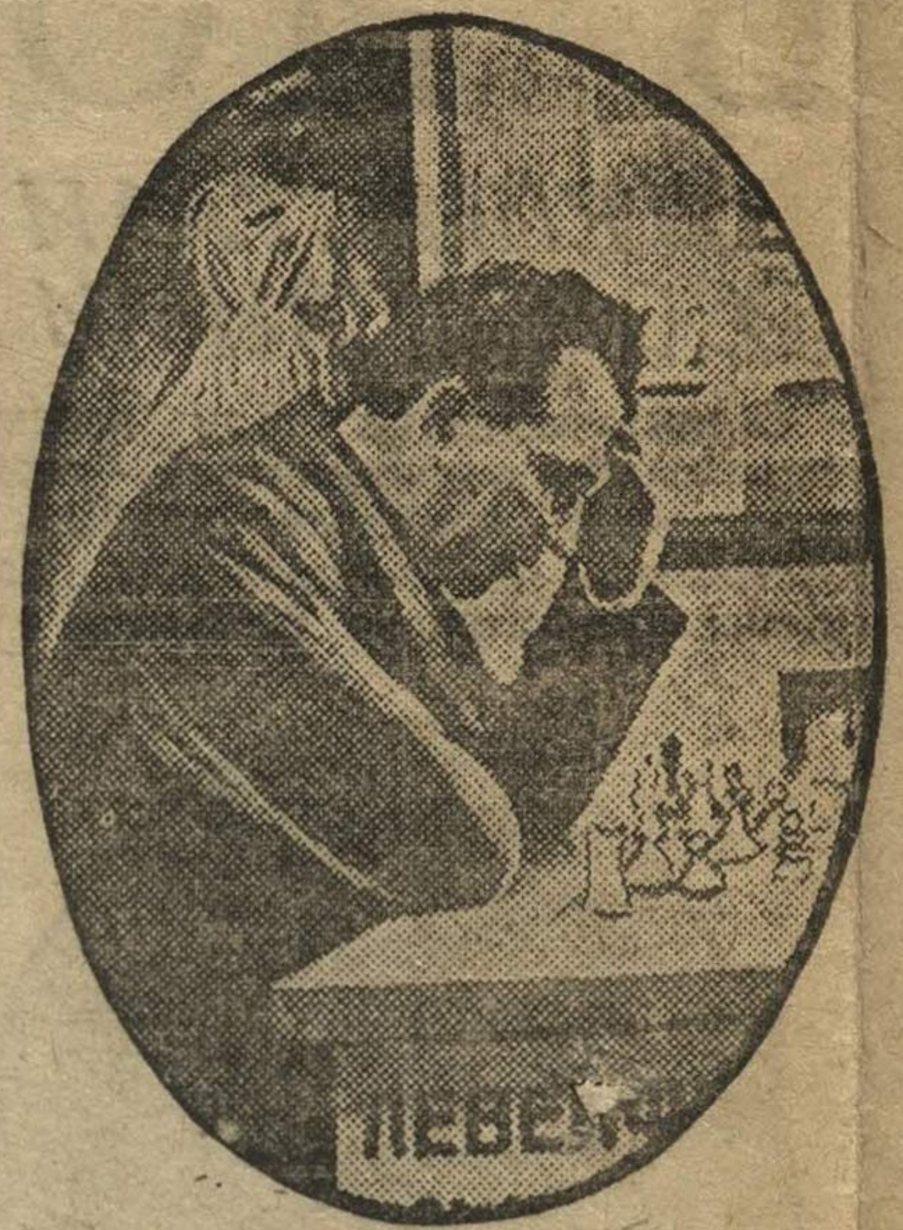
Участник международного шахматного турнира тов. Левенфиш