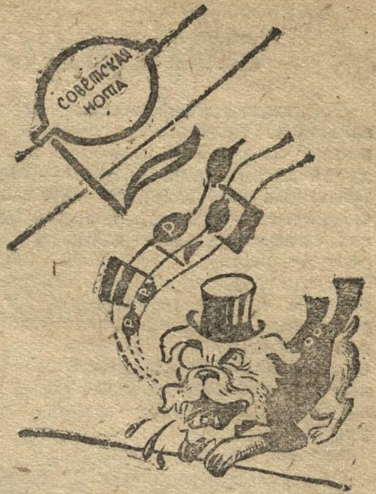
Одна советская нота, вызвавшая вой германской печати.