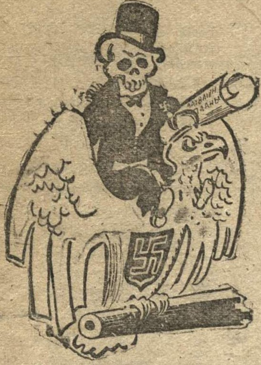
Лицо германской дипломатии.

ПРОЕЗД НА ТРАМВАЯХ БЕСПЛАТНЫЙ. БИЛЕТЫ РАСПРЕДЕЛЯЮТСЯ РАЙКОМАМИ ВЛКСМ. ОТВ. СЕКРЕТАРЬ ГОРКОМА ВЛКСМ СТРЕЛКОВ.