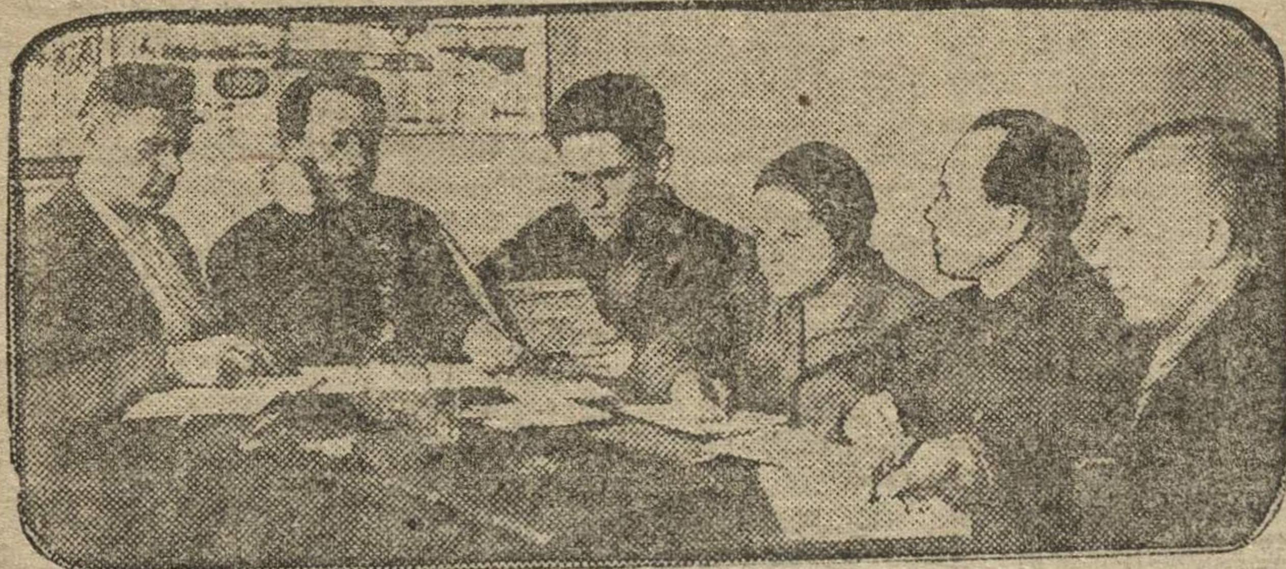
При библиотеке им. Ленина были проведены краевые курсы избачей. НА СНИМКЕ: избачи за разработкой примерного годового плана работы избы-читальни.