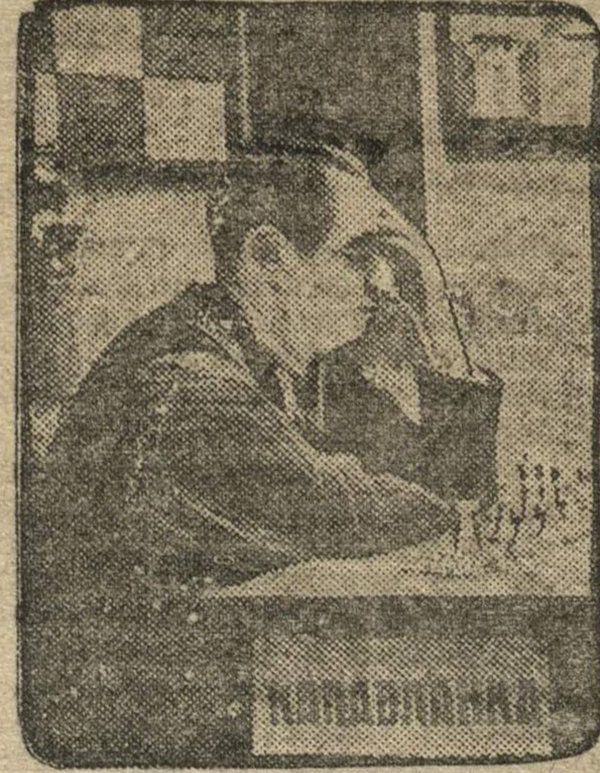
Экс-чемпион мира КАПАБЛАНКА.

Между тем в фильме не мало хороших эпизодов. Таковы бесспорно — возвращение на корабль, продвижение германских броневиков, песня, встреча балтийцев, разговор самостийников и