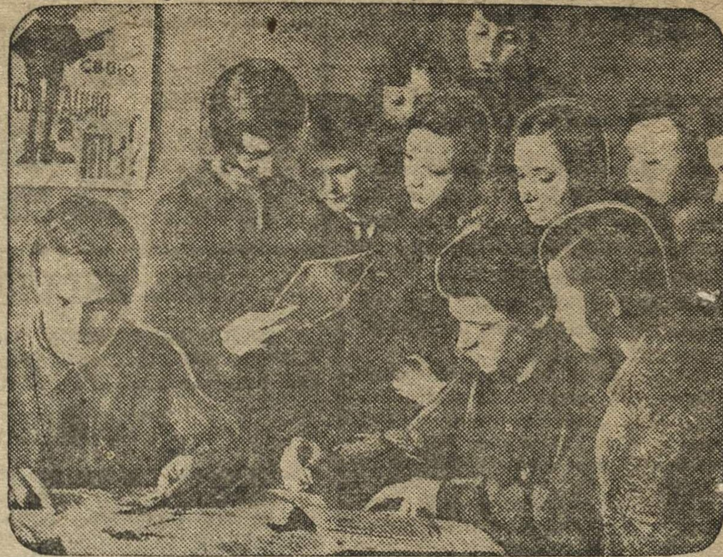
Лучшие комсомольцы школы им. Ленина организовали бригаду по проверке выигрышей по займам. НА СНИМКЕ: проверка выигрышей в большую перемену.