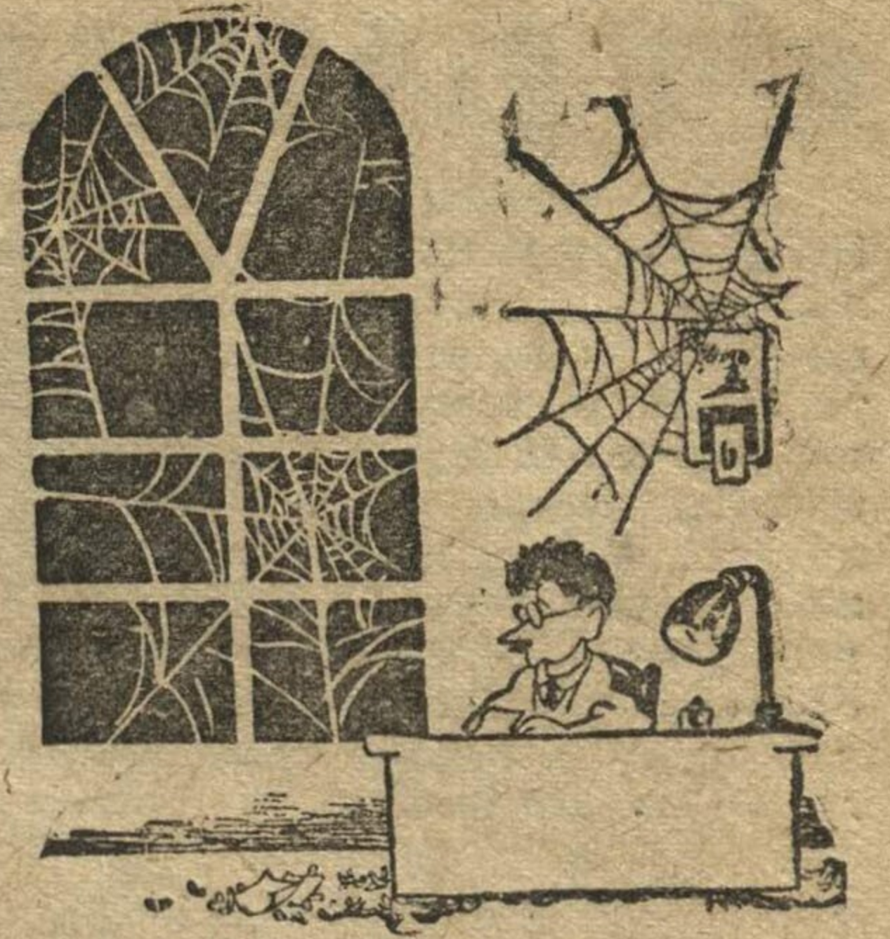
Перспективы из окна поездогорсовета.

Там говорится о курсах избачей, различных эстафетах, лыжных вылазках, художественных читках, кружковой работе, говорится о том, что в городе с 15 января решено открыть каток, да-