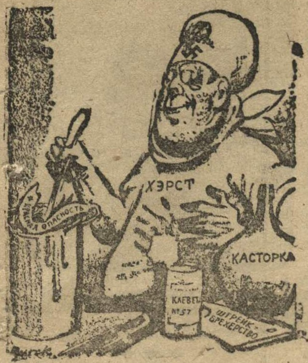
Приготовление фашистской по- лебки. («Дейли Уоркер», Нью-Йорк).