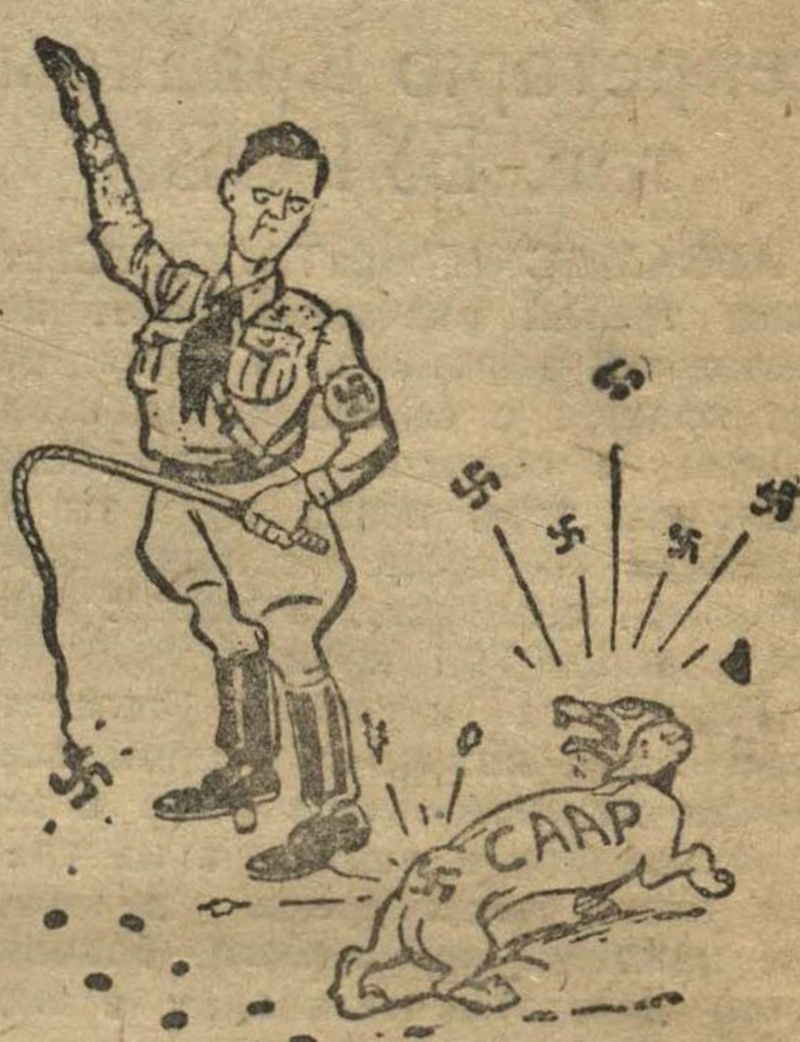
Рис. из «Саут Уэллс эко», (Англия).