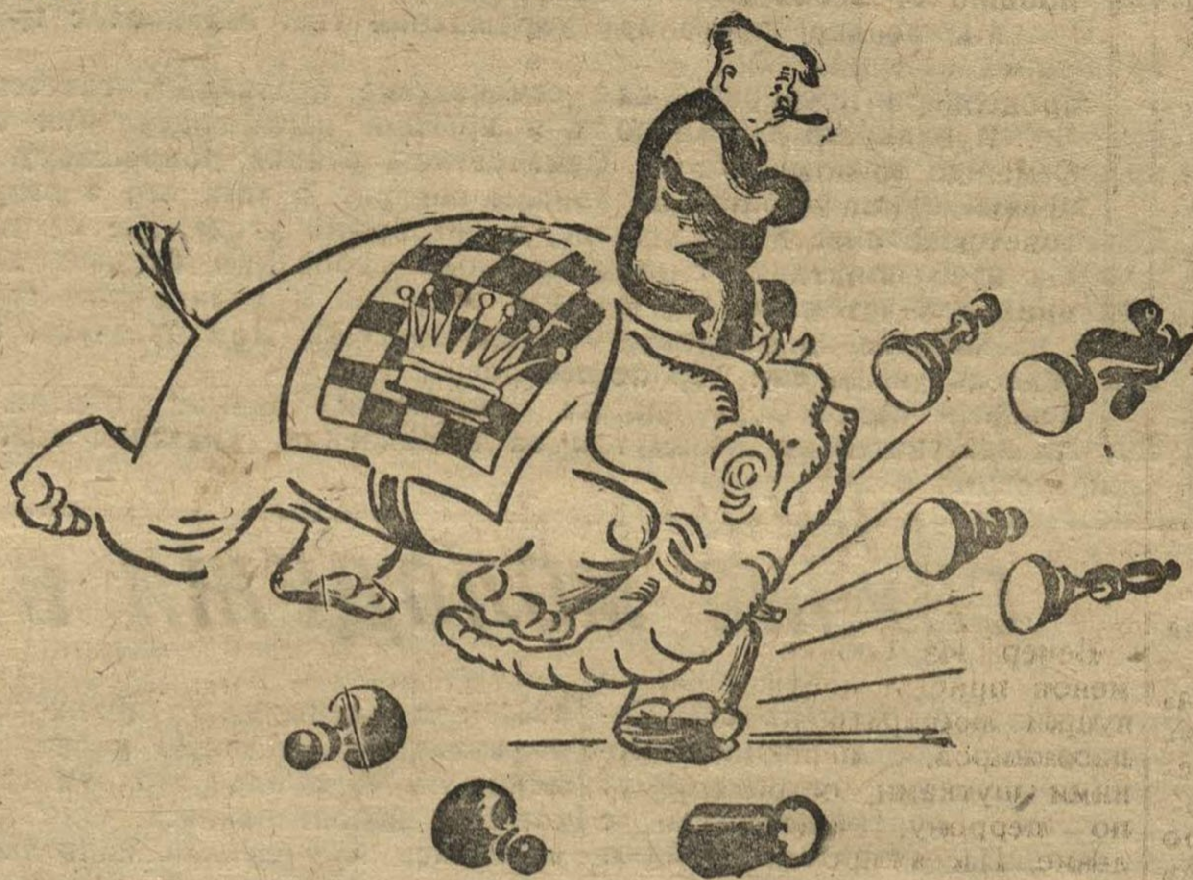
Ласкер продолжает наступление.