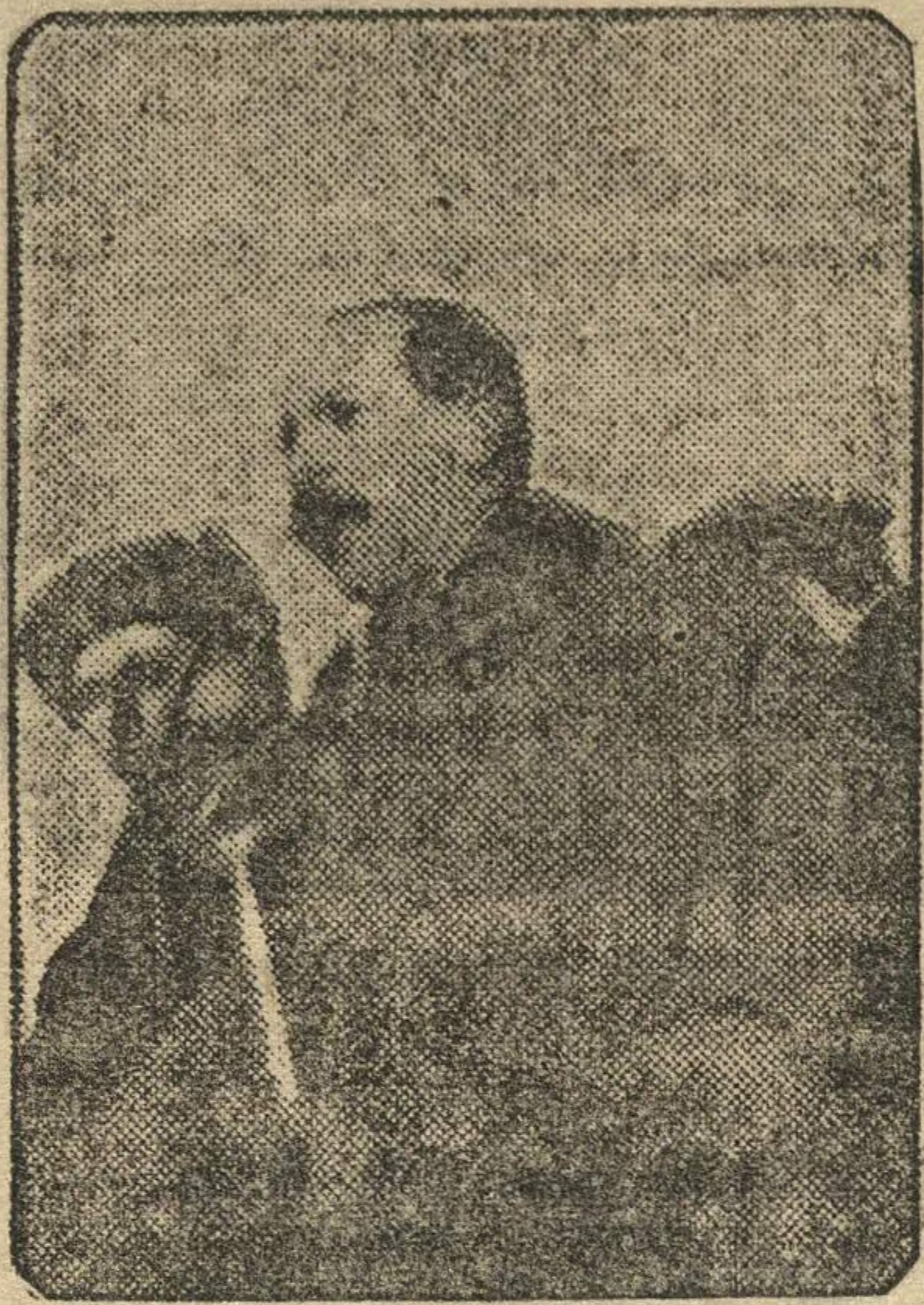
Тов. Каганович открывает митинг, посвященный занесению передовых колхозов на краевую доску почета.

Наш Горьковский край в области сельского хозяйства вышел в передовые ряды, получил высшую награду — орден Ленина. Это обязывает нас и в предстоя-