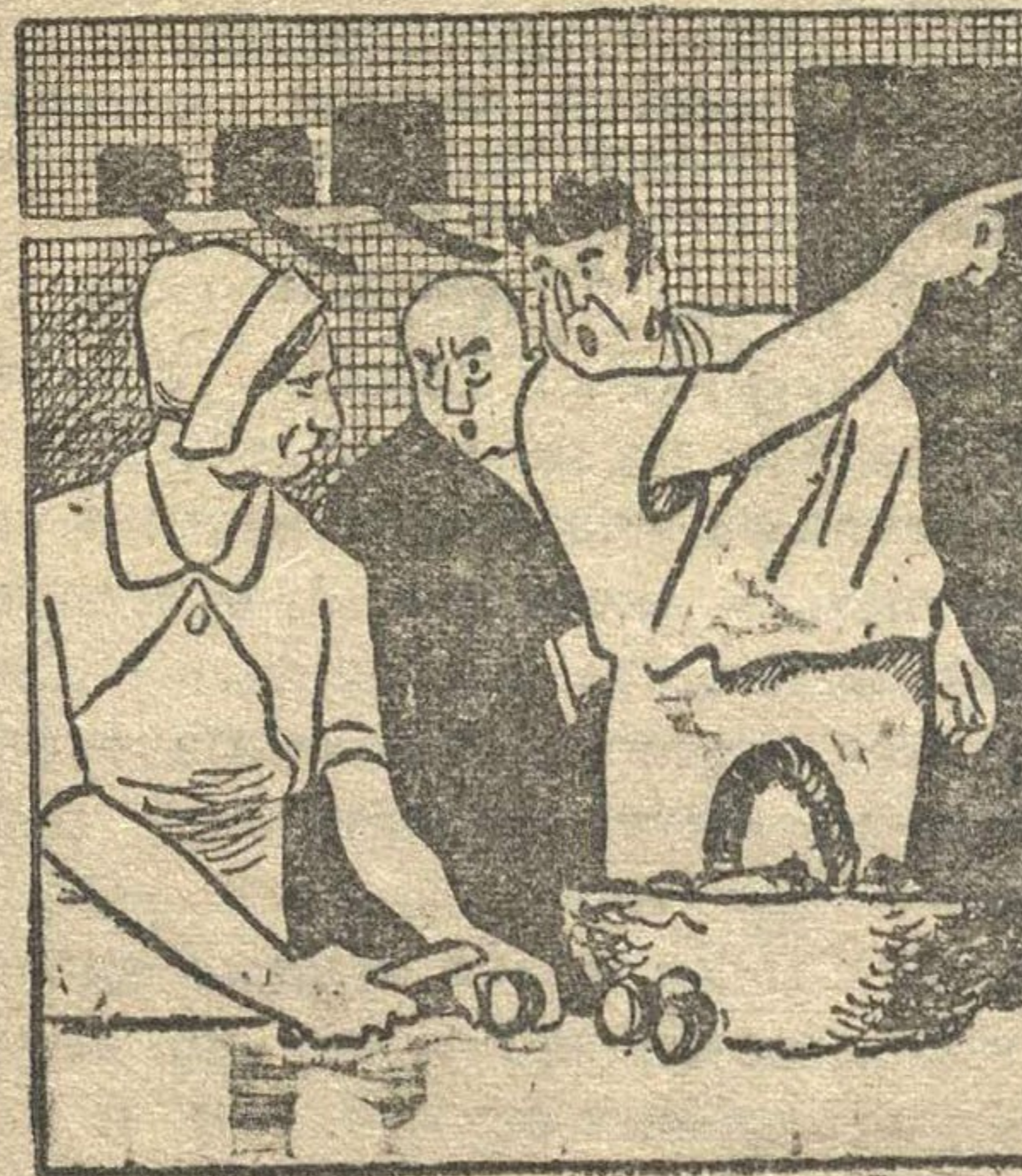
Не прочь освободить иногда женщину от трудов на кухне...