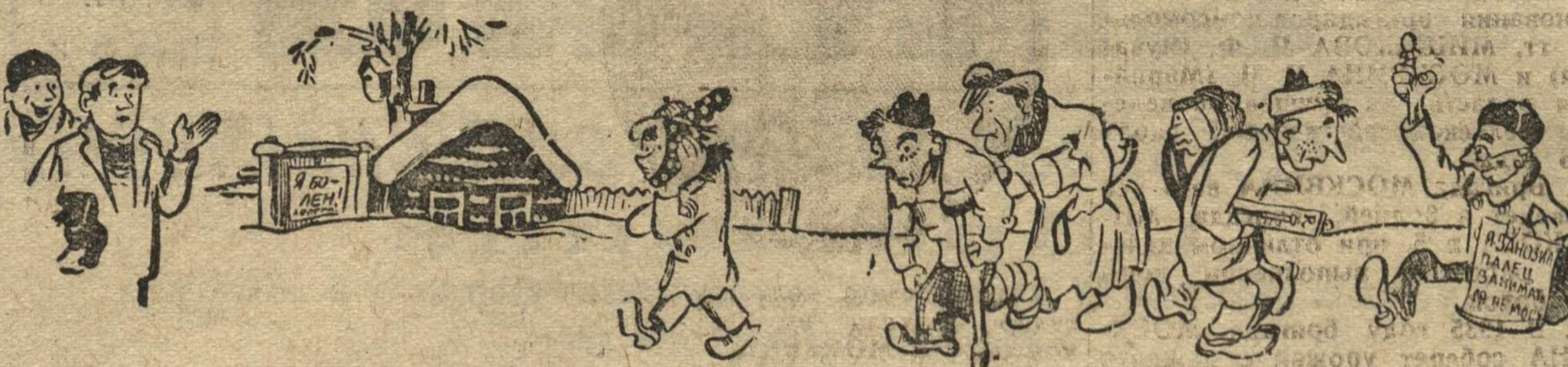
Рис. Н. ГОЛОВИНА.

— «Что это у вас, эпидемия, чтоли, все больные?» — «Нет, день политзанятий!».