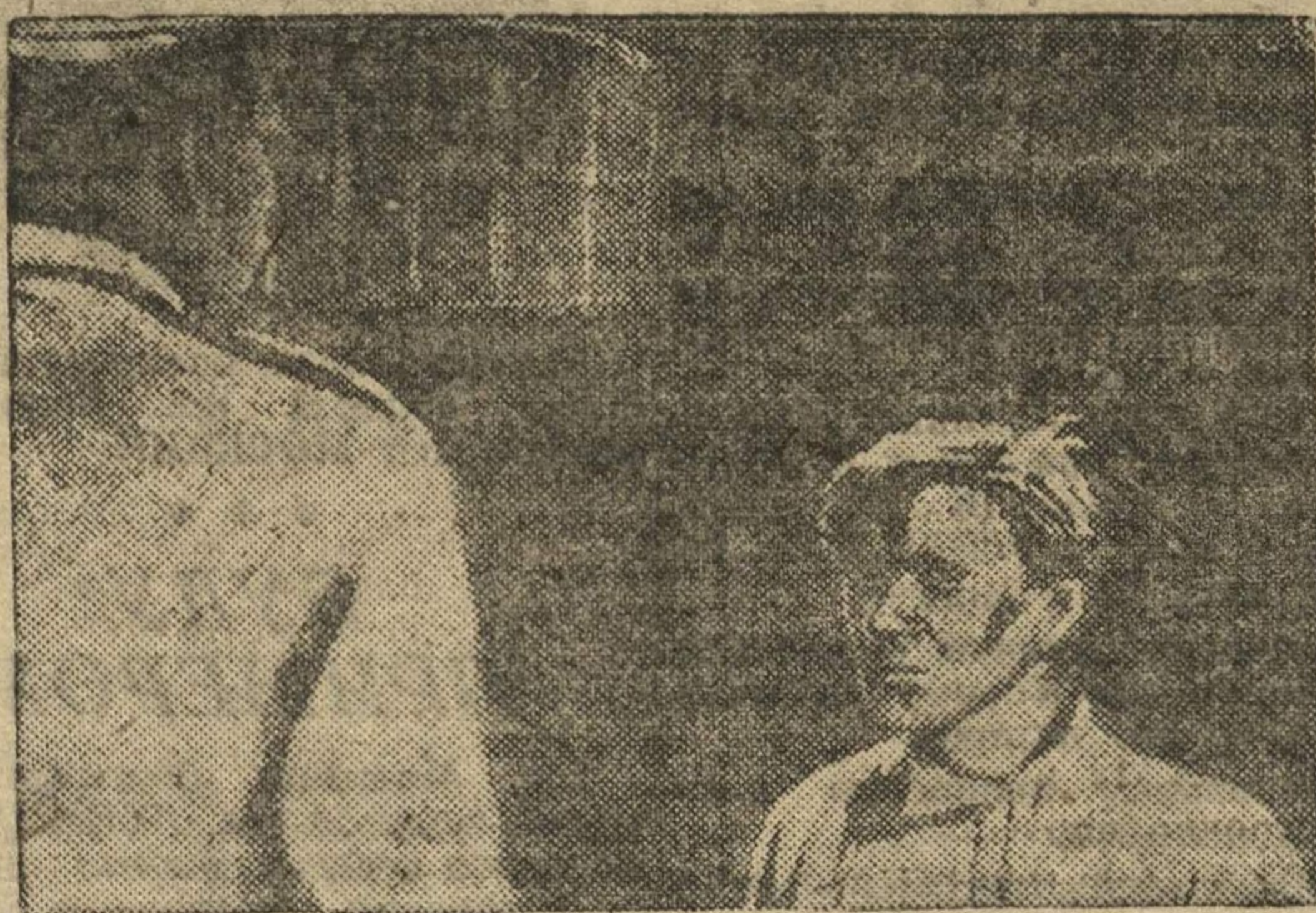
Кадр из фильма «ЮНОСТЬ МАКСИМА». Сцена в тюрьме, наблюдатель и Максим.

Максим, молодой, жизнелюбивый, беззаботный Максим становится профессиональным революционером, кадровым подпольщи-