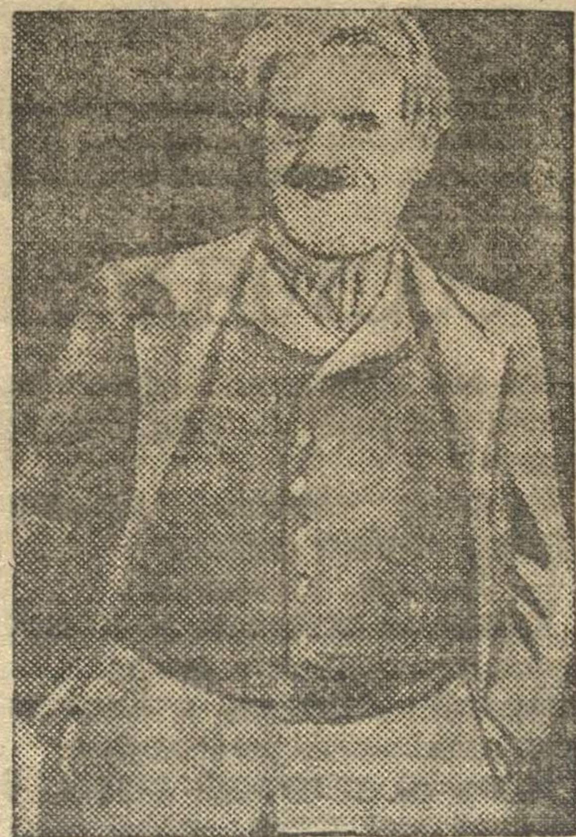
Народный артист республик И. М. ТАРХАНОВ в роли Поливанова.

приемов и исполнения сильно заинтересовывало.