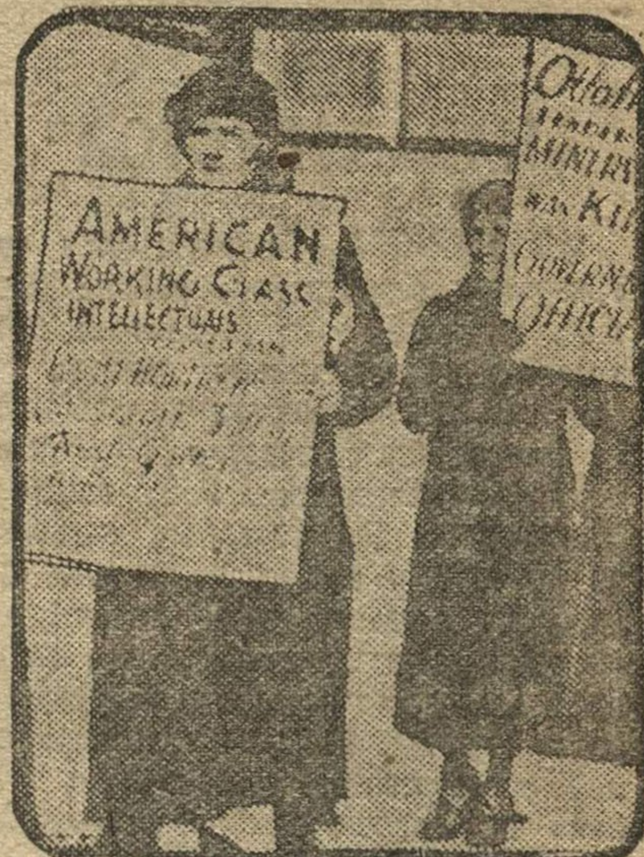
НА СНИМКЕ: рабочие пикеты перед зданием венгерского консульства в Нью-Йорке несут плакаты с протестами против белого террора в Венгрии. «СВОБОДУ РАКОШИ» — написано на плакатах.