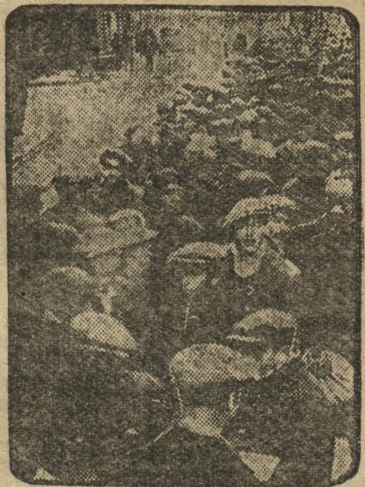
Суровая зима текущего года делает положение безработных на Западе вдвойне тяжким. На снимке: после холодной, снежной ночи в Париже длинная очередь безработных у входа в «благотворительную» столовую за чашкой супа.

«Надо, чтобы Союз Коммунистической Молодежи ВОСПИТЫВАЛ всех с молодых лет, с 12 лет, В СОЗНАТЕЛЬНОМ И ДИСЦИПЛИНИРОВАННОМ ТРУДЕ».