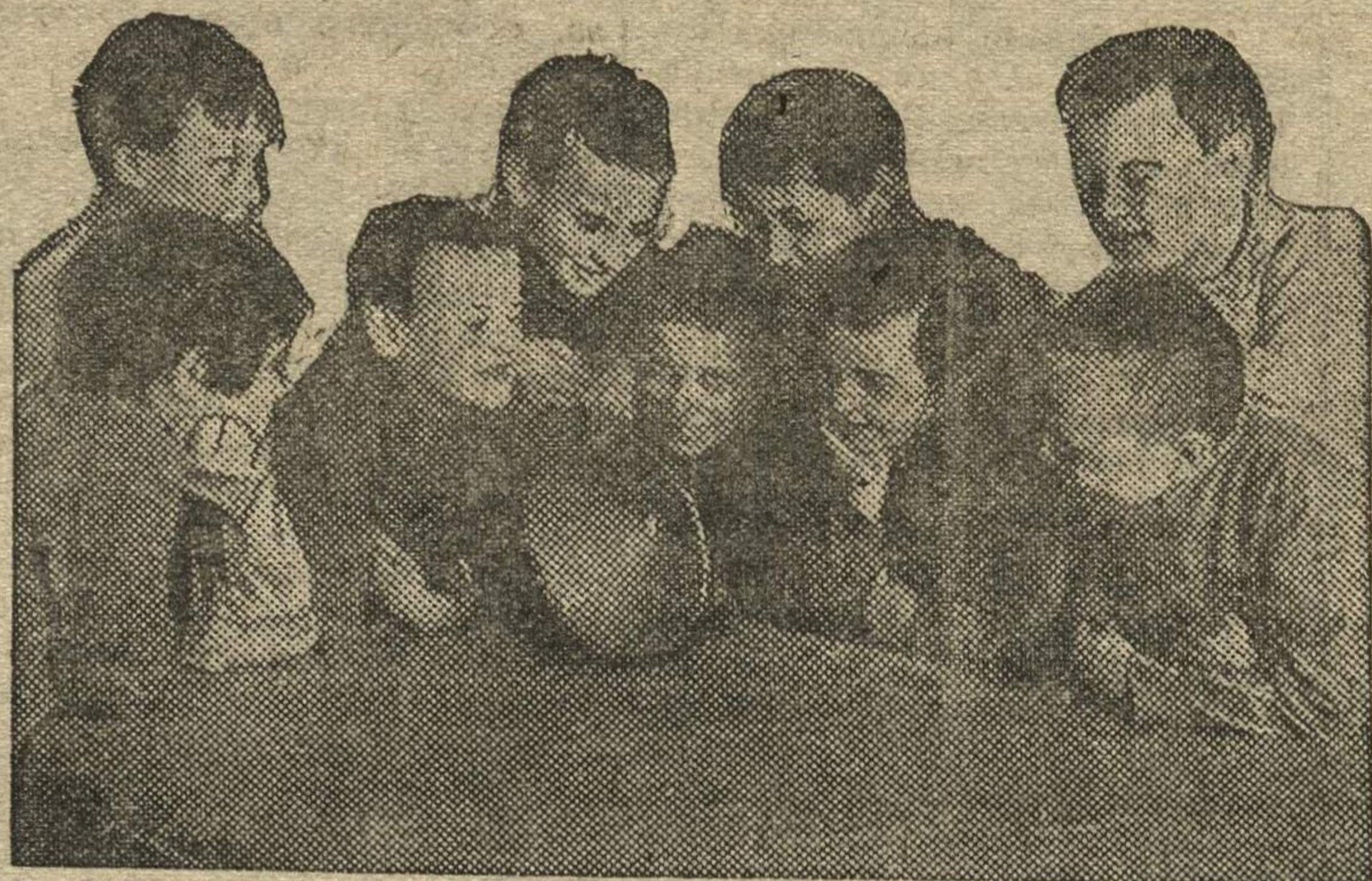
Перемену ученики второго класса полной средней школы им. КИМ (Сталинский район) часто проводят за коллективным слушанием радио

Группы и звездочки скомплектованы неправильно, в группах, вместо 25 чел., объединяются по 45—50, в звездочках вместо 5 по 12 и больше детей. Это не дает возможности изучить каждого ребенка, его запросы и бытовые условия. Октябратские группы за пионерскими отрядами закреплены формально. Все вожатые очень слабы и учеба их не организована.