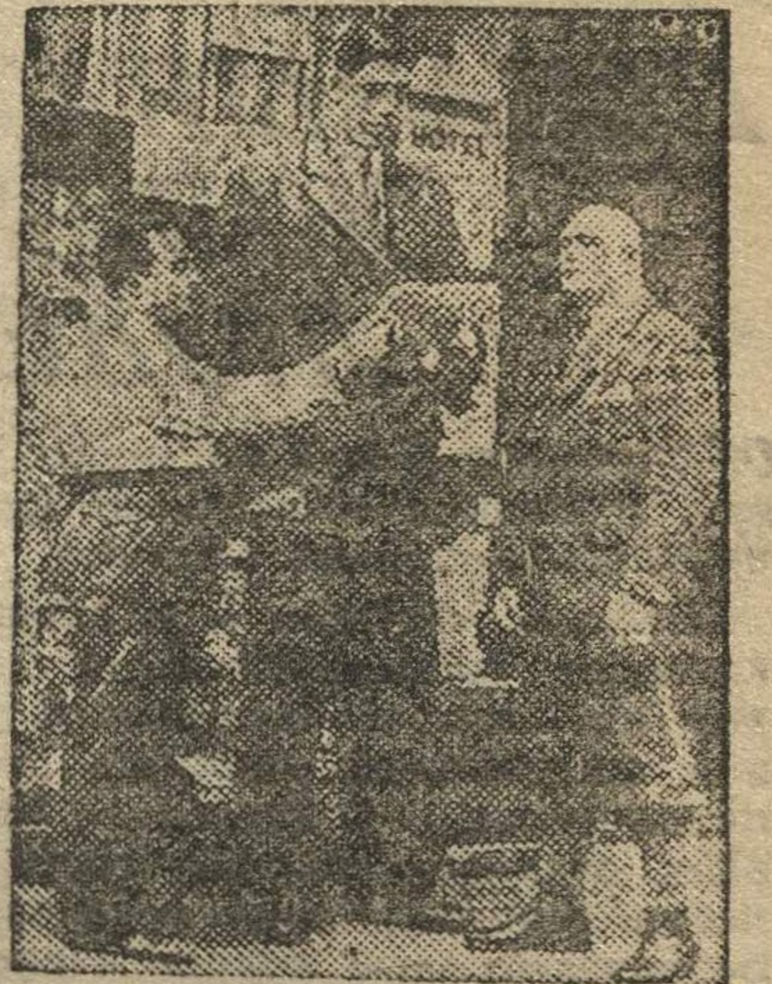
НА СНИМКЕ: финский боксер БЕН МИЛИРИНЕН , один из наиболее высоких по росту спортсменов Европы. (Рост 2 метра 87 см., вес 165 кг.).