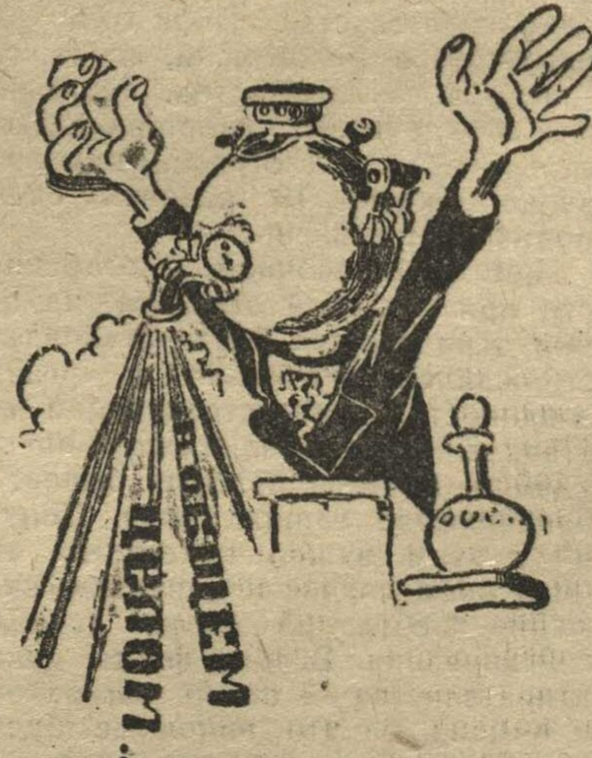
... все благополучно.

стовое собрание в Мантурове, посвященное проработке решений X пленума ЦК, было без доклада и хорошо подготовлено — с гордостью заявляют райкомовцы.