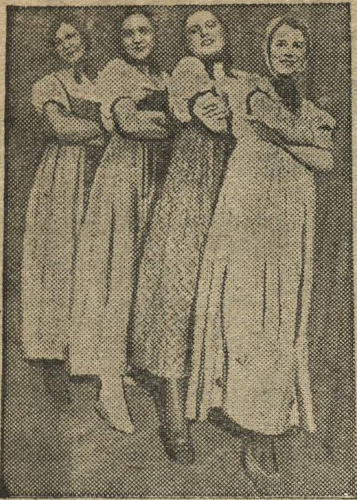
Выступление театра Малых форм при клубе им. Ворошилова.