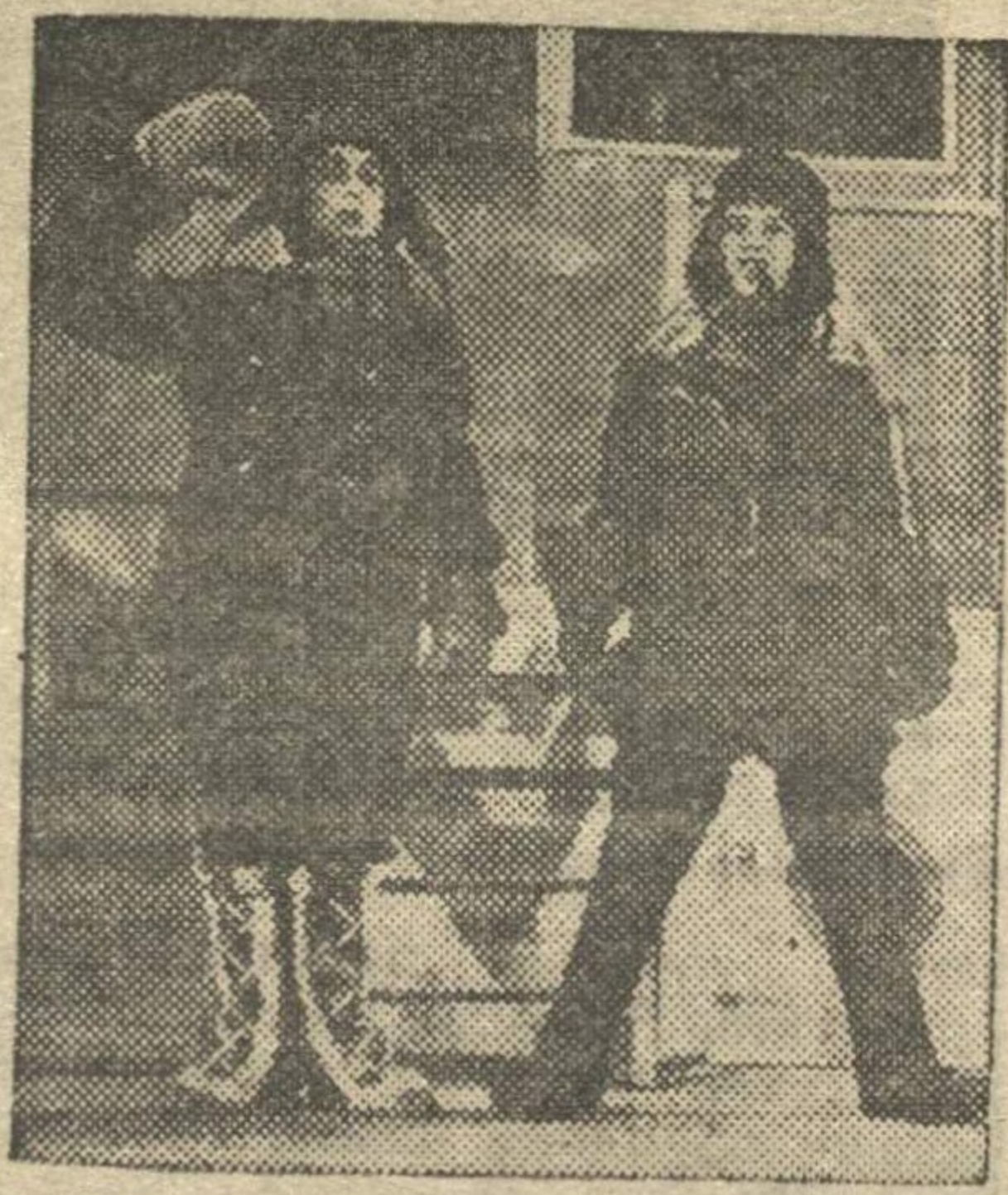
Сцена из пьесы «Правление Септимия Севера».

нического цеха автозавода. Они плохо участвуют в жизни школы и в особенности в жизни комсомольской организации.