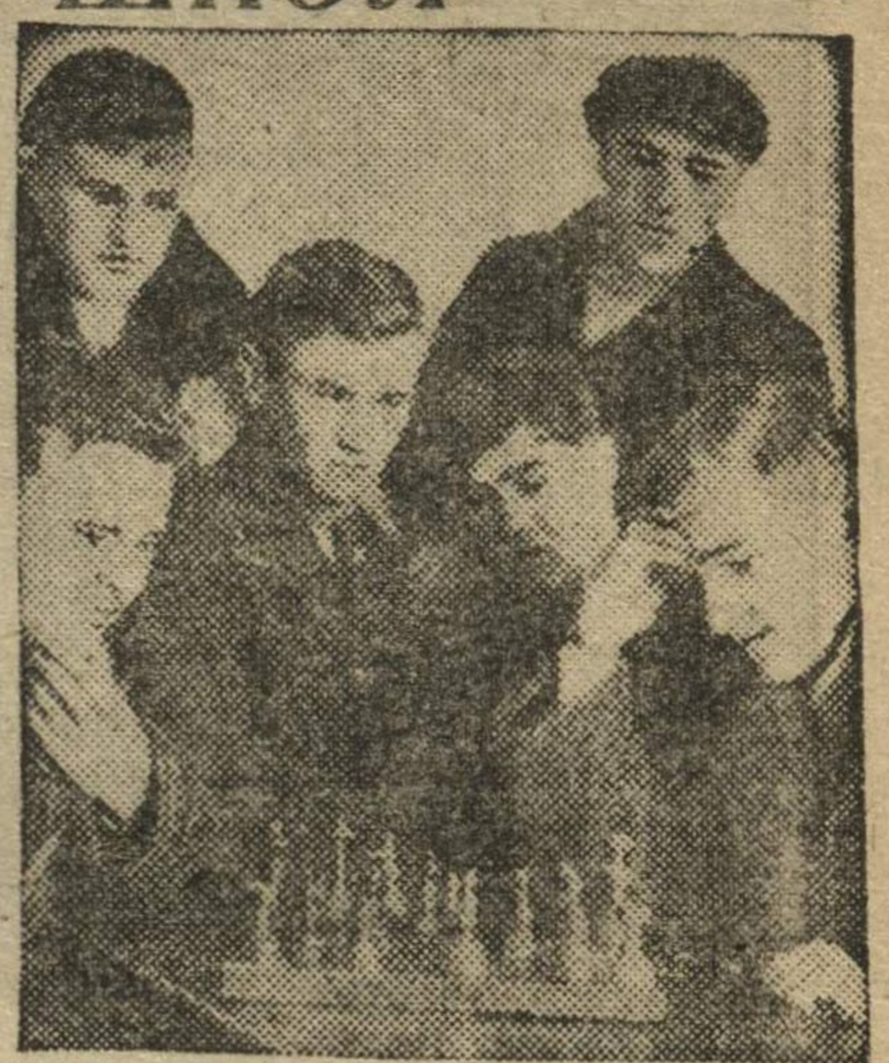
Шахматный турнир в коммунальном техникуме.

просто устает от книг. «Тут все-таки веселее! Я очень люблю школу и ребят. Вот со многими поведу, вместе повеселюсь. И потом... и потом я могу посмотреть, как играют в шахматы, посидеть в комнате отдыха».