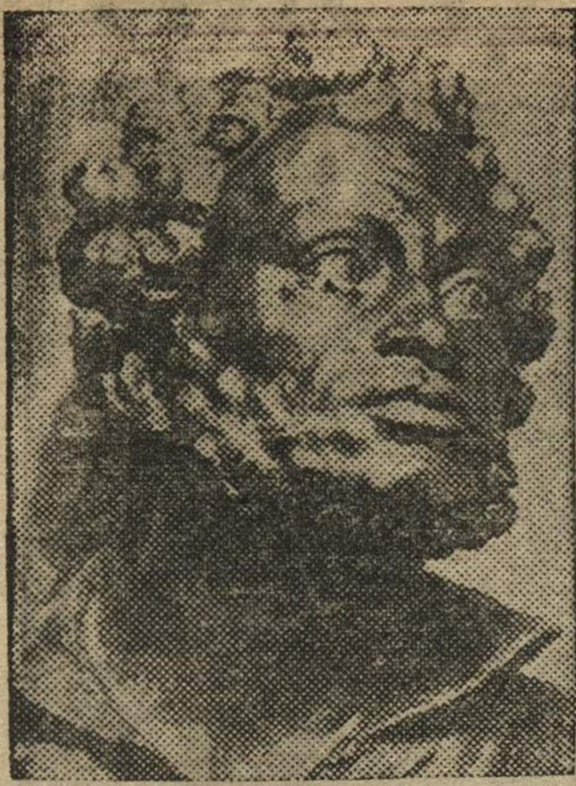
ПУШКИН А. С. — скульптура ДОМОГАЦКОГО.