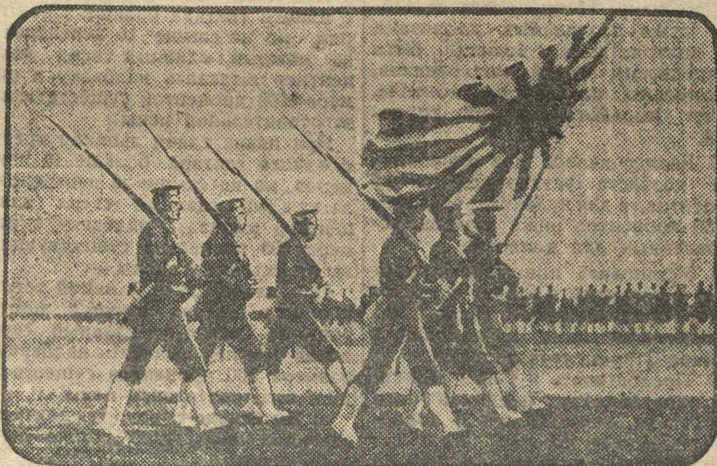
На снимке: парад войсковых частей в г. Ноксука.