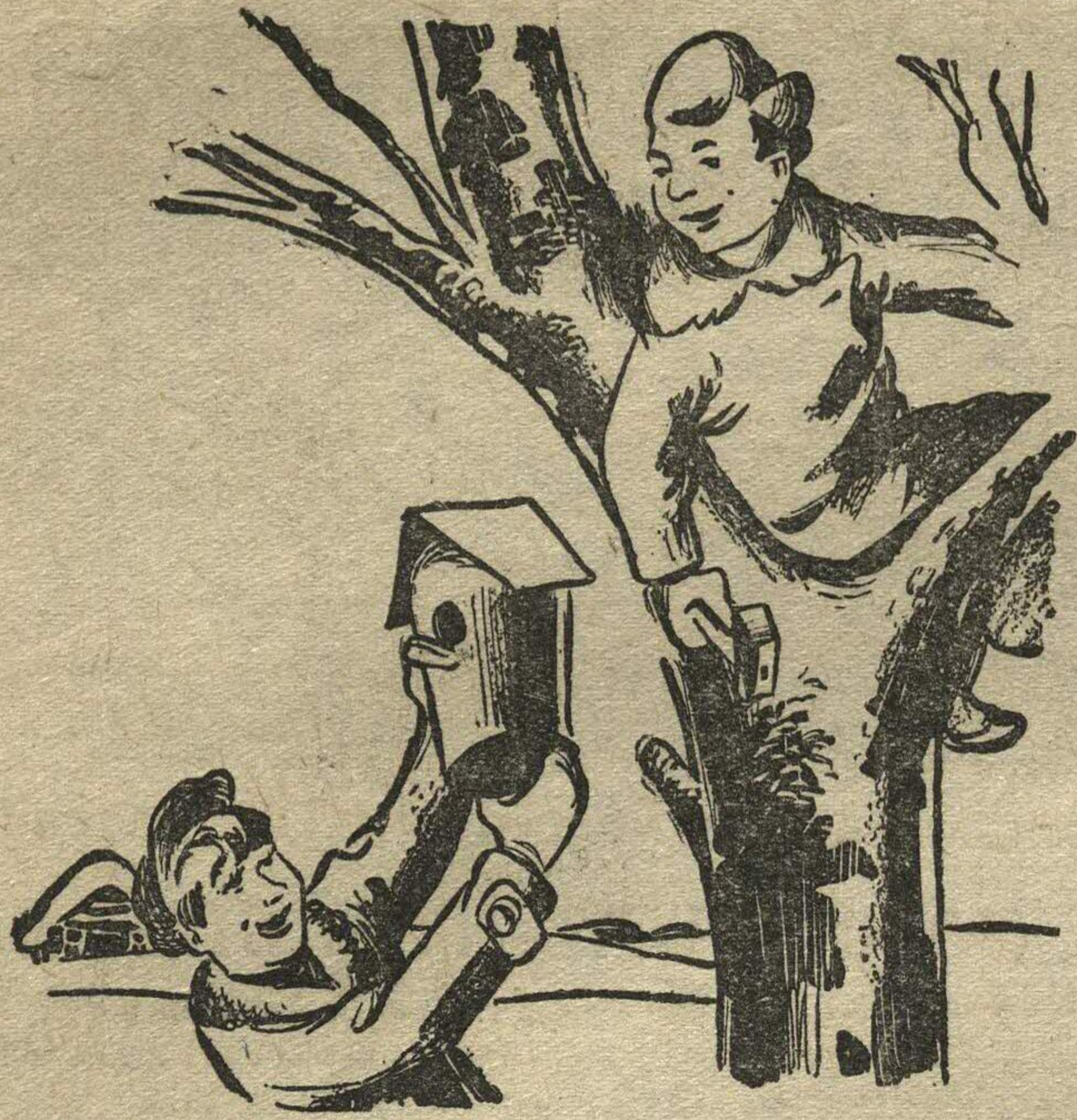
Пионеры готовят встречу к прилету пернатых друзей.