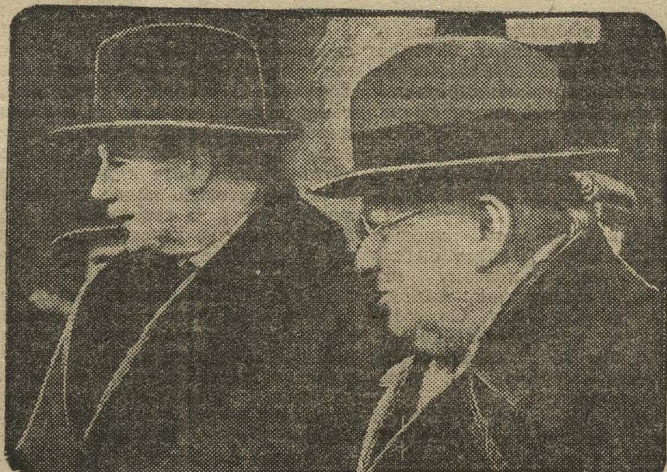
Встреча на Белорусско-Балтийском вокзале г. А. ИДЕНА народным комиссаром по иностранным делам тов. М. М. ЛИТВИНОВЫМ.