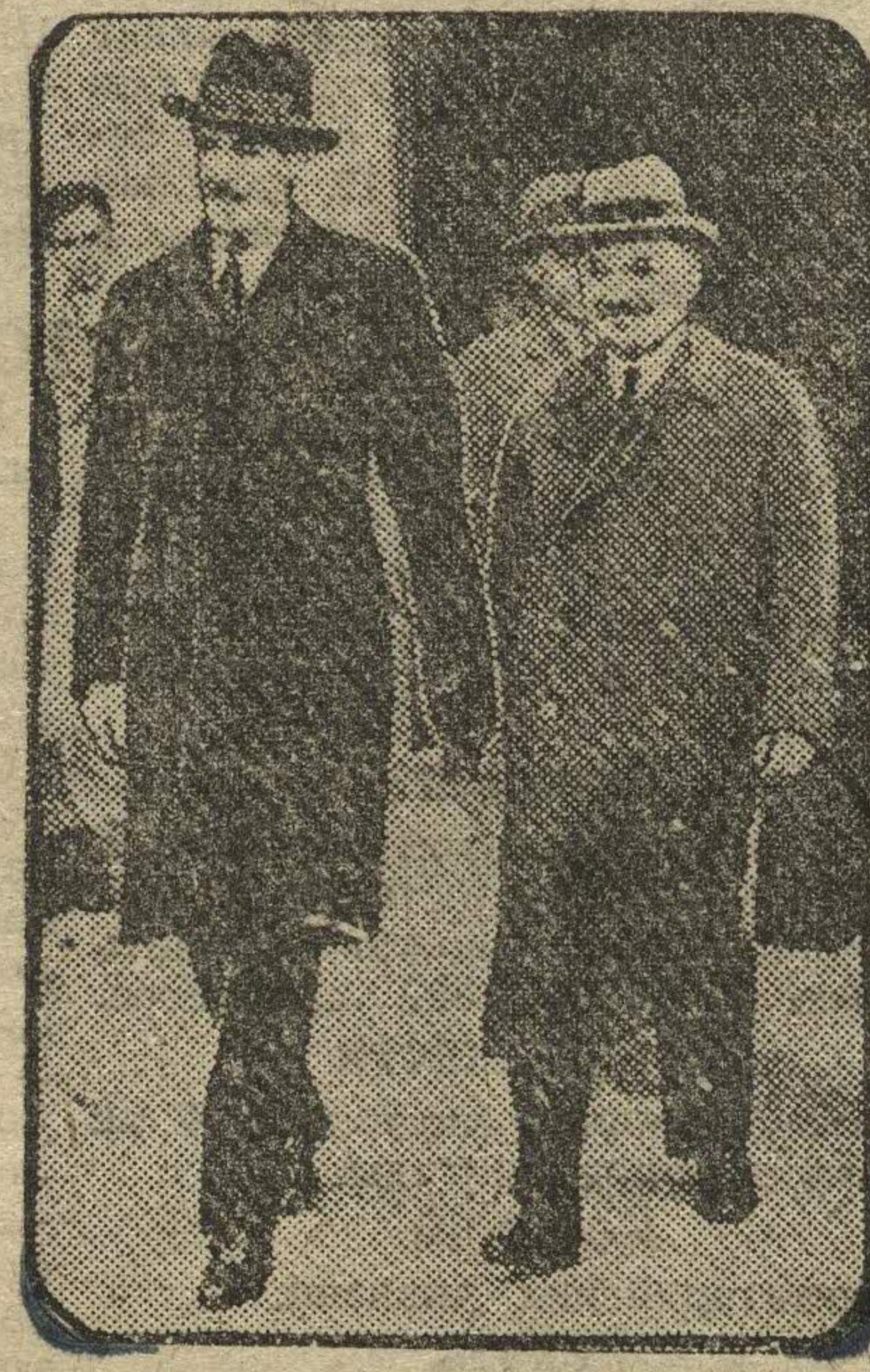
Полпред СССР в Лондоне Майский (справа) и Иден на Кройдонском аэродроме в Лондоне.

Как г. Иден, так и беседовавшие с ним гг. Сталин, Молотов и Литвинов были того мнения, что в нынешнем международном положении более, чем когда-либо, необходимо продолжать усилия в направлении к созданию системы коллективной безопасности в Европе, как это предусмотрено англо-французским коммюнике от 3 февраля, и в соответствии с принципами Лиги наций.