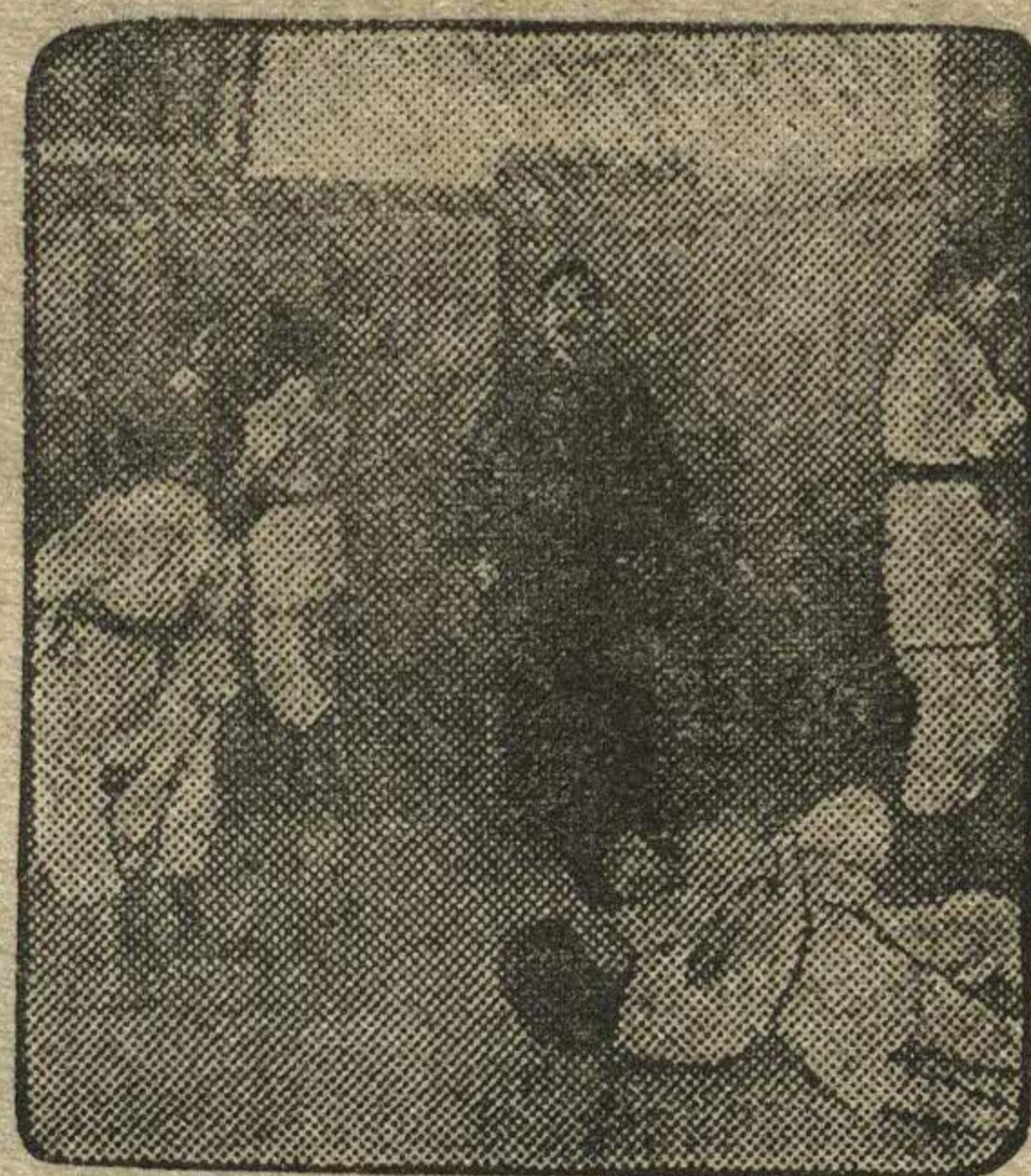
НА СНИМКЕ: школьницы в Токійской школе изучают приемы джиу-джитсу — метода борьбы и самозащиты.