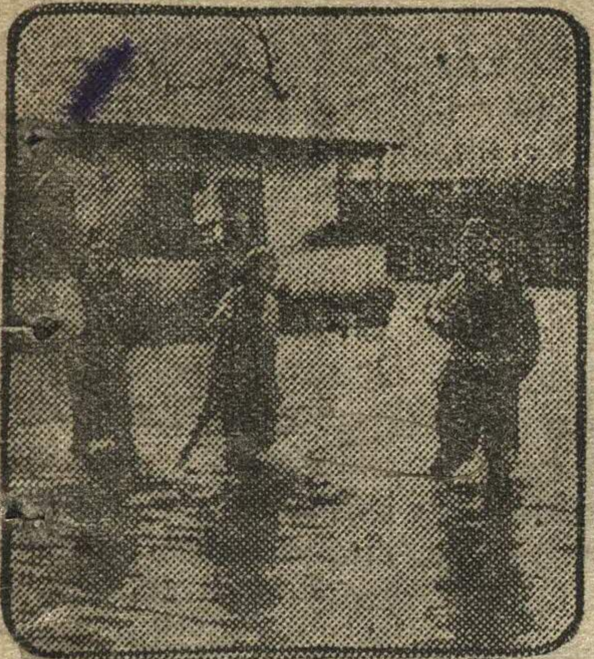
НА СНИМКЕ: затопленная весенним половодьем румынская деревня