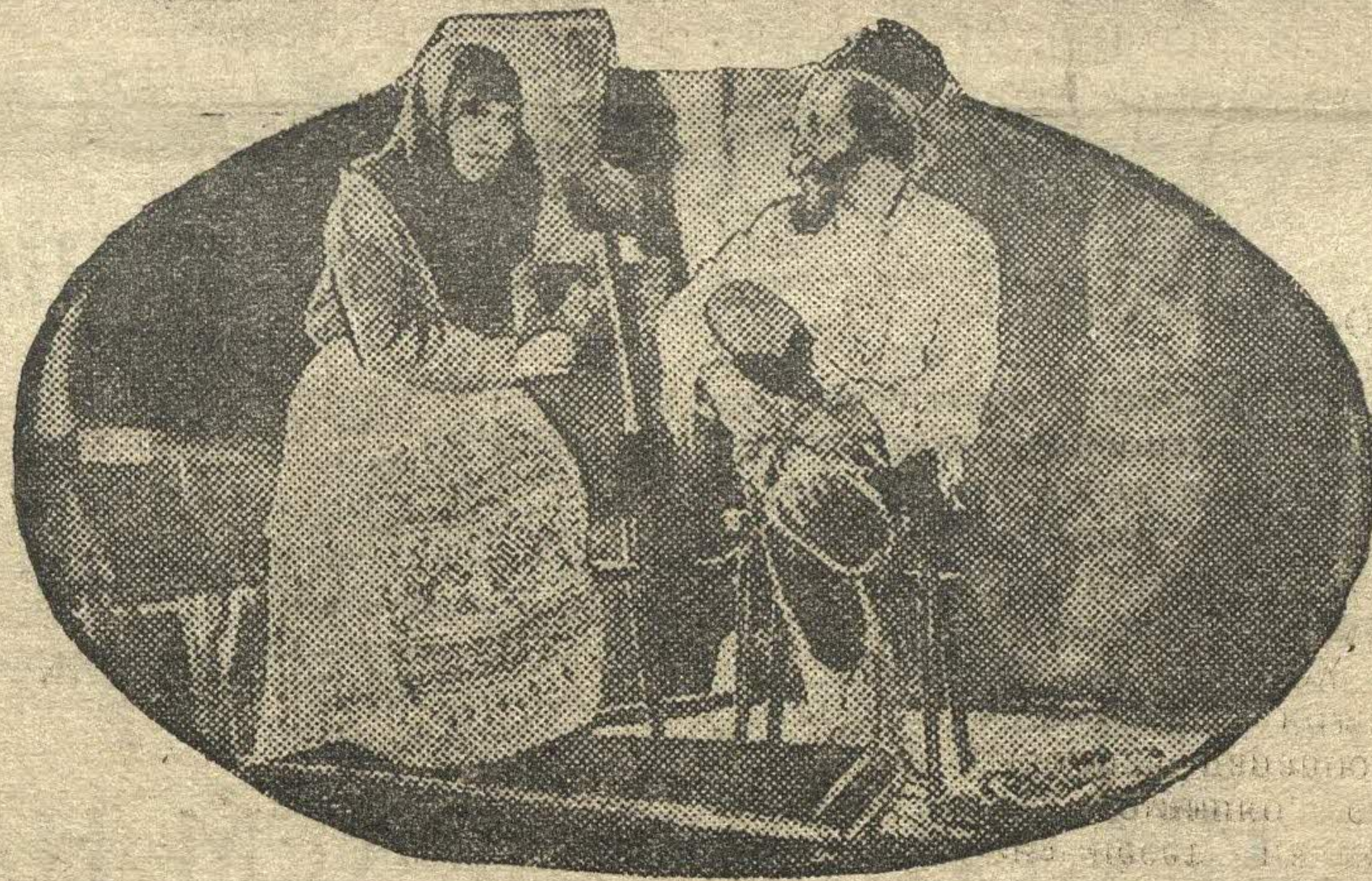
Среди школ гор. Горького был проведен межрайонный слет драматической и музыкальной самодеятельности. На снимке: момент из постановки сказки о «Рыбаке и золотой рыбке» школой № 11.

Что произошло после этого, многие из кружковцев уже не помнят. Очевидцы рассказывают, что Скундина начала свое выступление простыми словами: