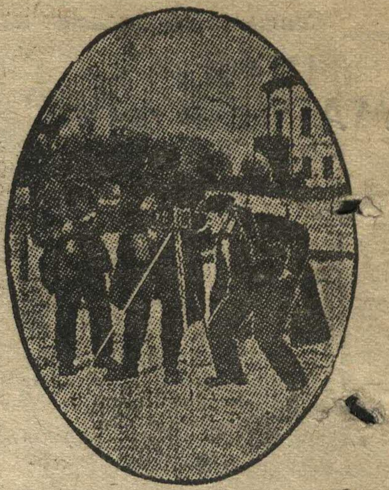
Фотокружок зоологического кабинета Горьковского Госуниверситета поставил задачей подготовить кружковцев к самостоятельной фотоработе и производственной практике. На снимке: кружковцы за работой.