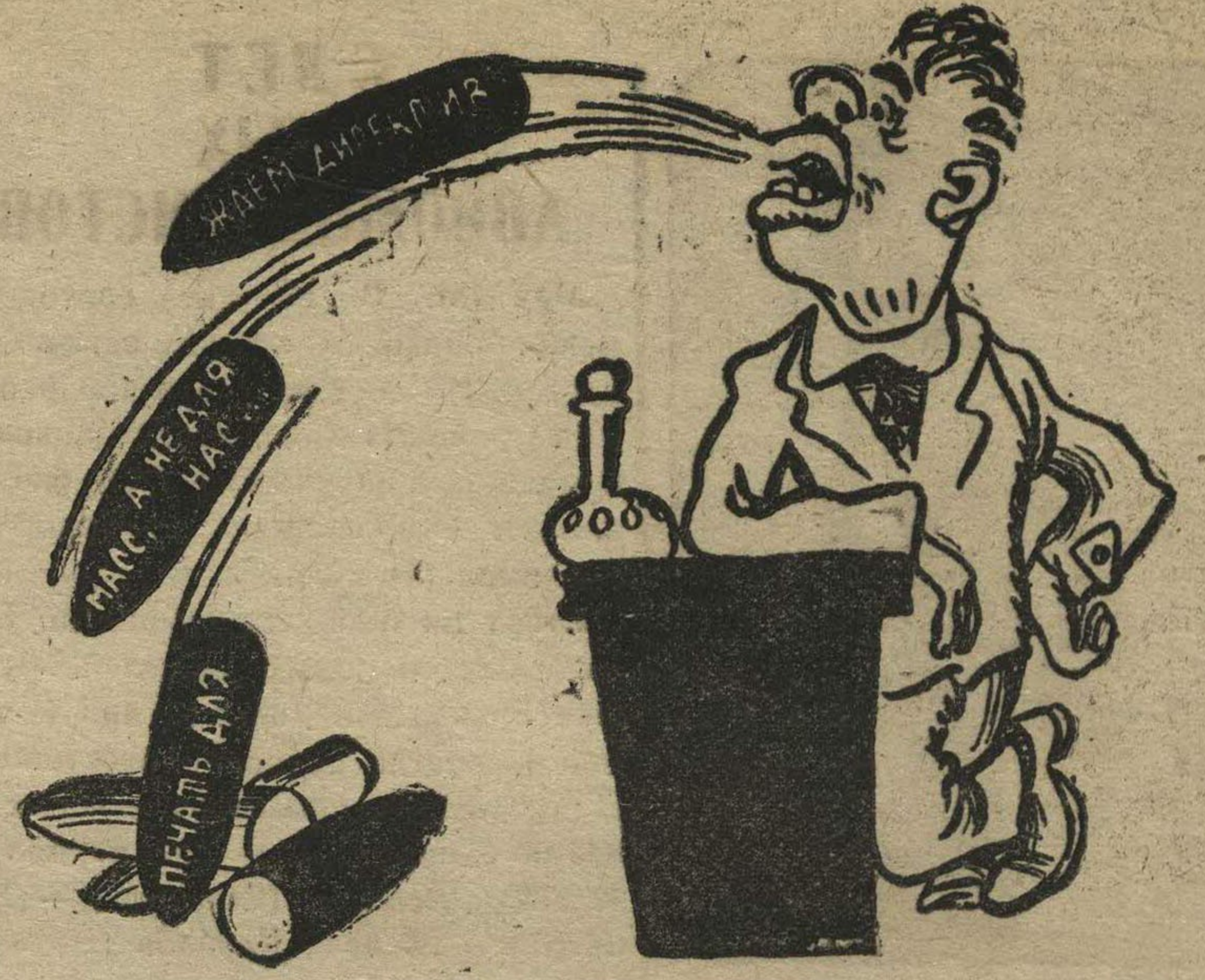
Гостяев отливает «ПУЛИ».

К своему шефу — комсомолу Горьковского края, — мы не имеем особых претензий, но надо указать на то, что связь районных и низовых комсомольских организаций с прикрепленными к ним частями и ударниками этих частей, достаточно еще не организована. Для улучшения шефства комсо-