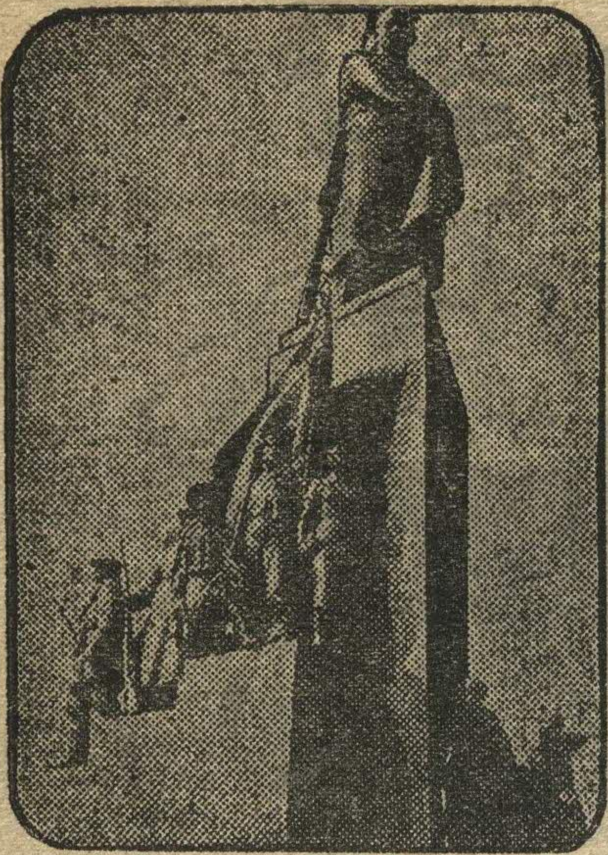
Недавно открытый памятник в Харькове ТАРАСУ ШЕВЧЕНКО.