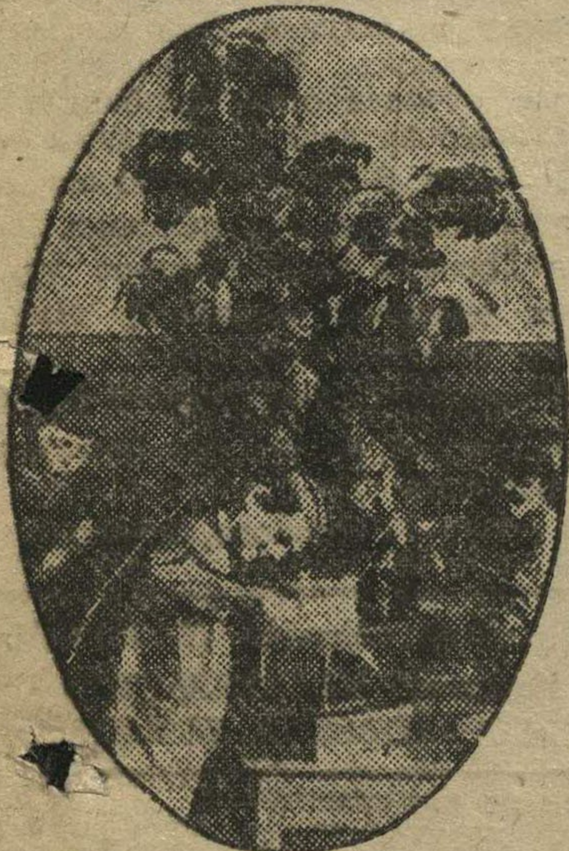
Дежурные ребята по уголку природы за поливкой цветов.