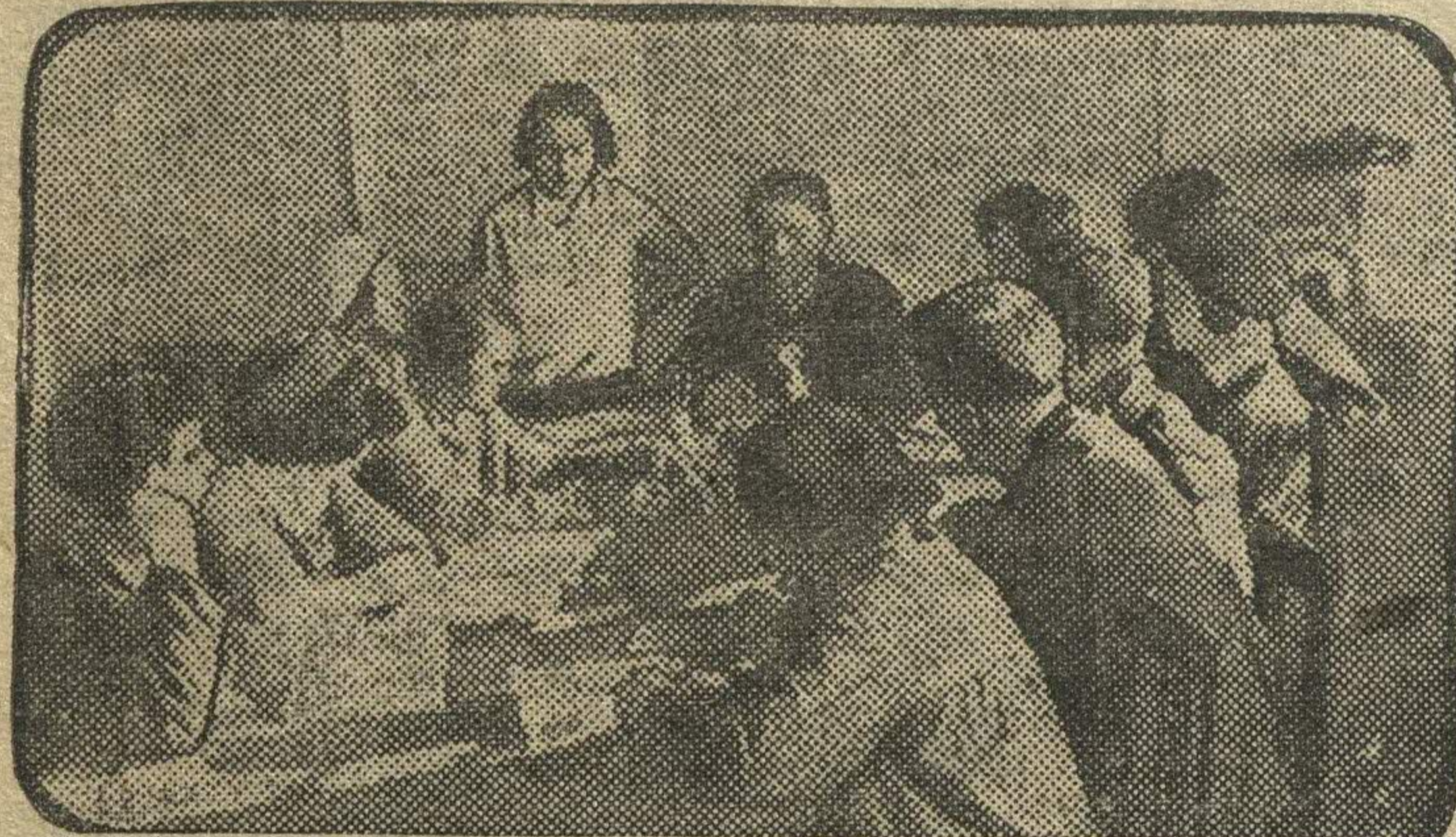
Занятия комсомольской политушколы, по истории партии, механического цеха ГРЗ им. Ленина.