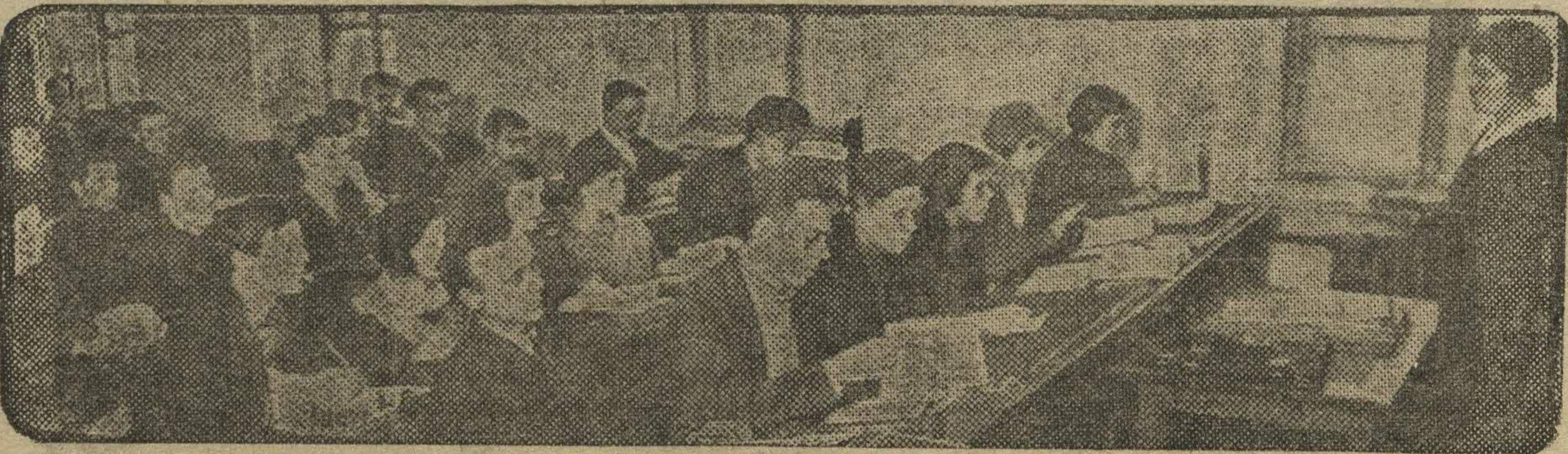
Курсы комсомольских пропагандистов начальных политшкол, работают при Сталинском райкоме ВЛКСМ (Москва). На снимке: занятия группы № 3 курсов пропагандистов.