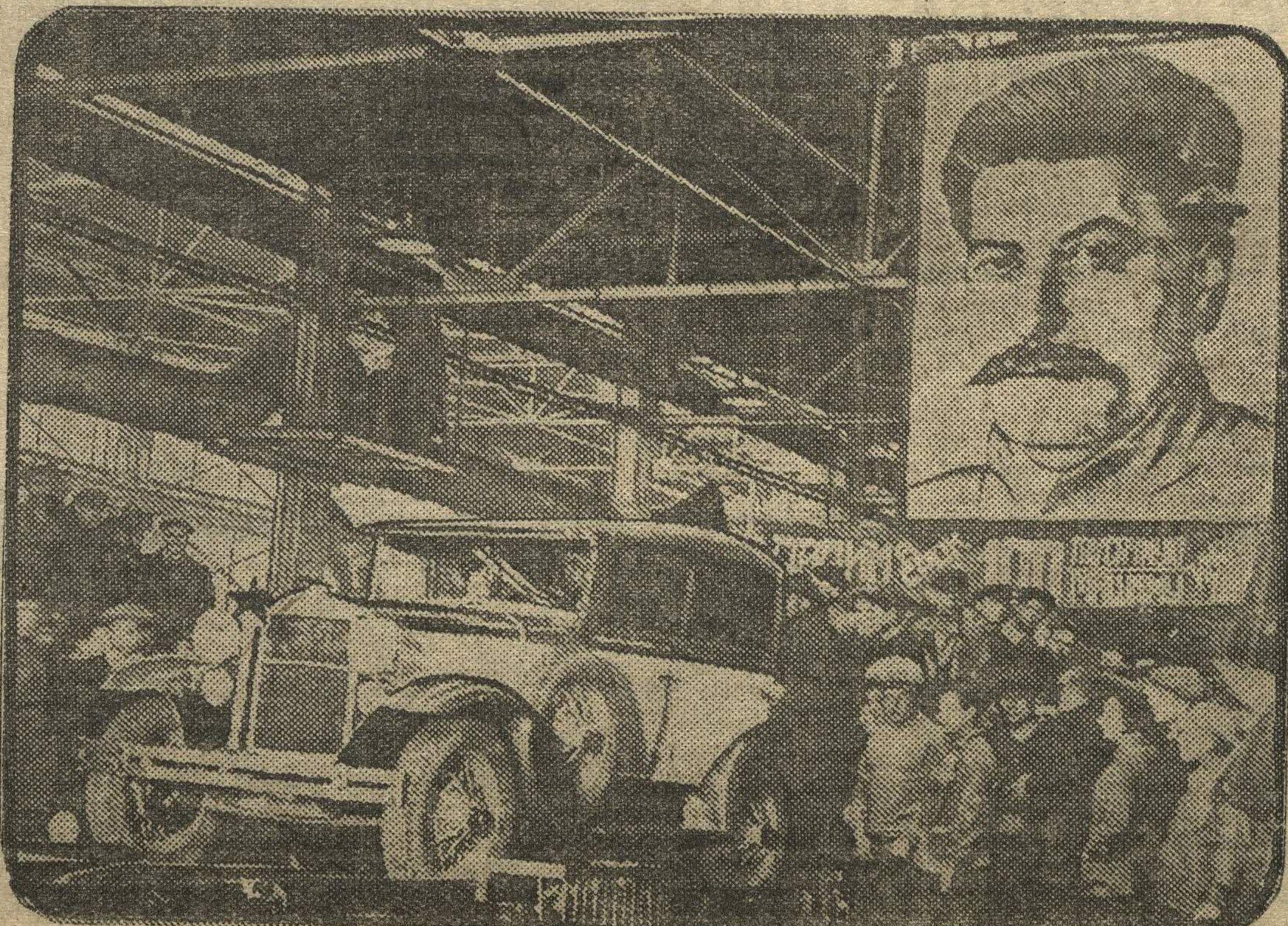
Стотысячная газетка сходит с главного конвейера автозавода им. Молотова.