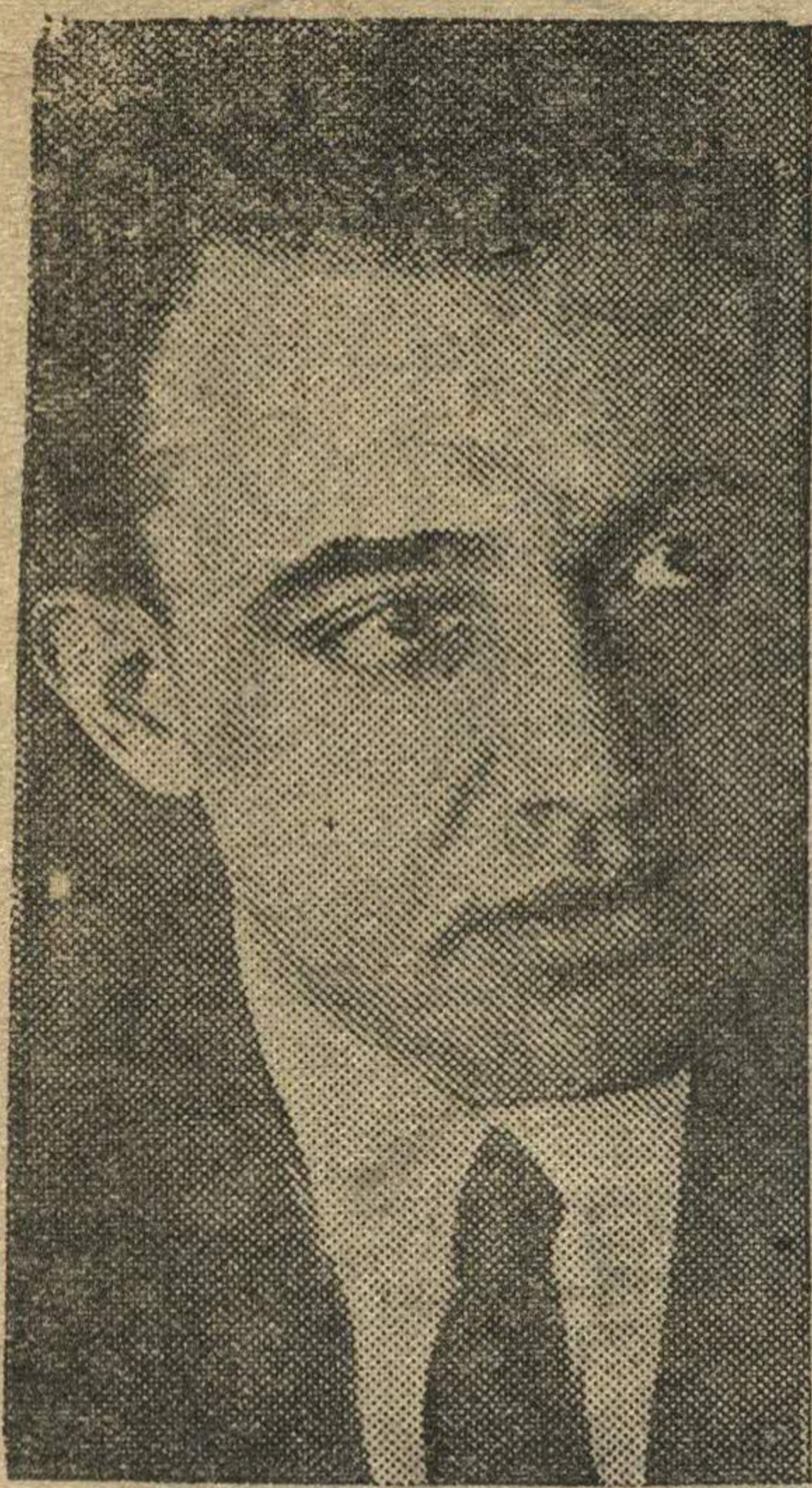
Автор пьесы «Платон Кречет», писатель А. Е. Корнейчук.