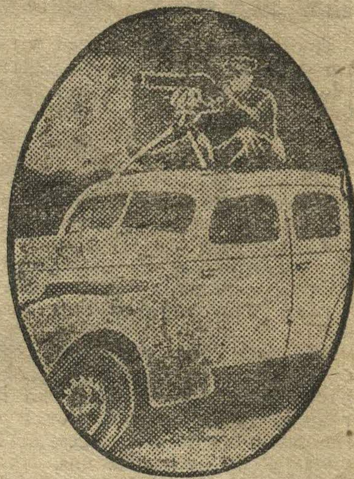
На снимке: верх автомобиля, легко превращаемый в пулеметную площадку, новейшее изобретение автомобильной индустрии США.