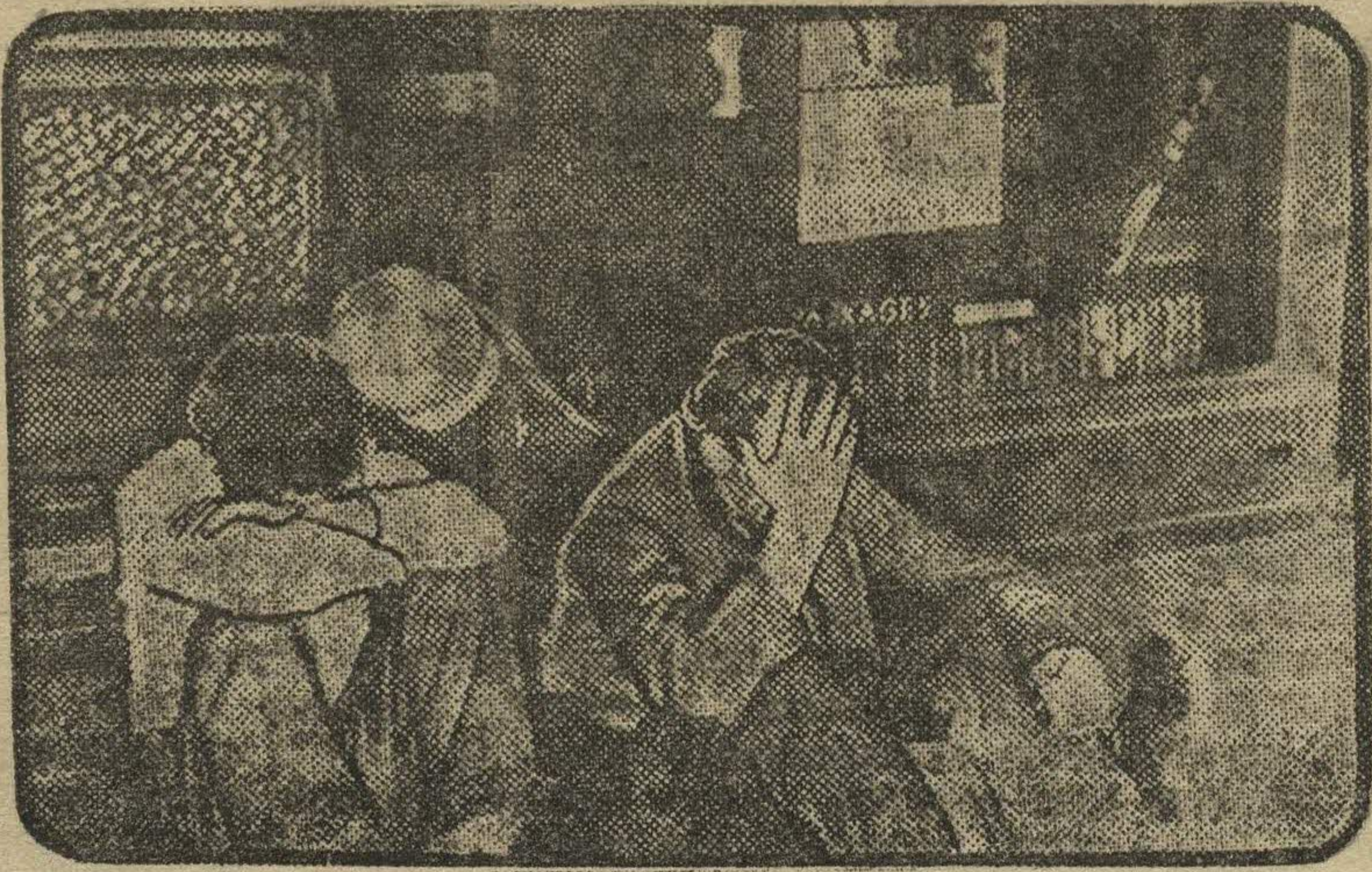
Безработные, лишённые крова, на улице Нью-Йорка у входа на телеграф.

Морган-Парк — маленькое предместье южной части Чикаго. Население Морган-Парка разделяется на две группы: в одной части предместья живут богатые, — большинство из них владельцы крупных фабрик в Чикаго, юристы, доктора и т. д. В другой — живут около 200 негритянских семей. Большинство из них — безработные. Для детей негров здесь име-