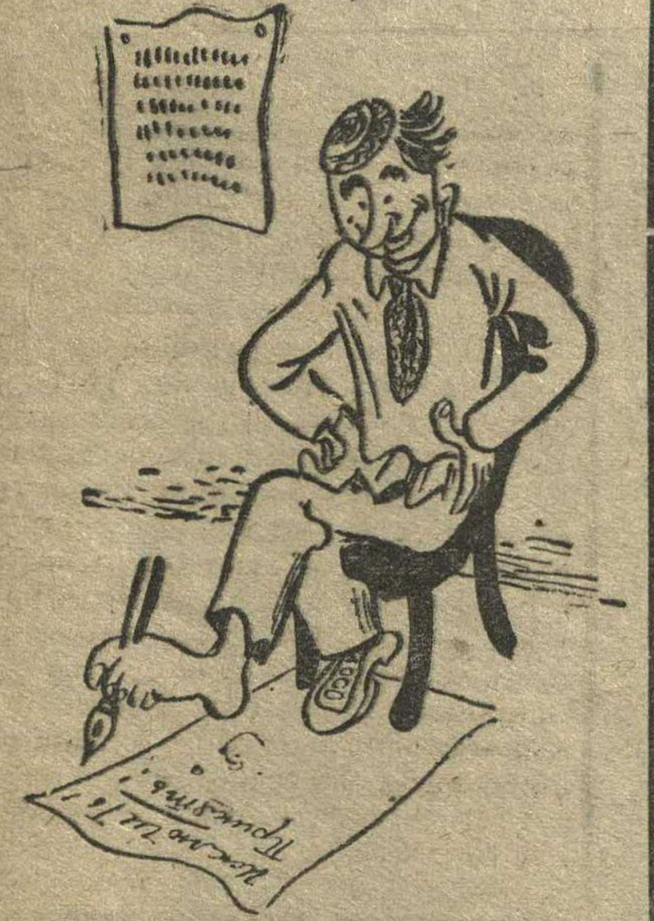
Чего моя левая нога хочет?