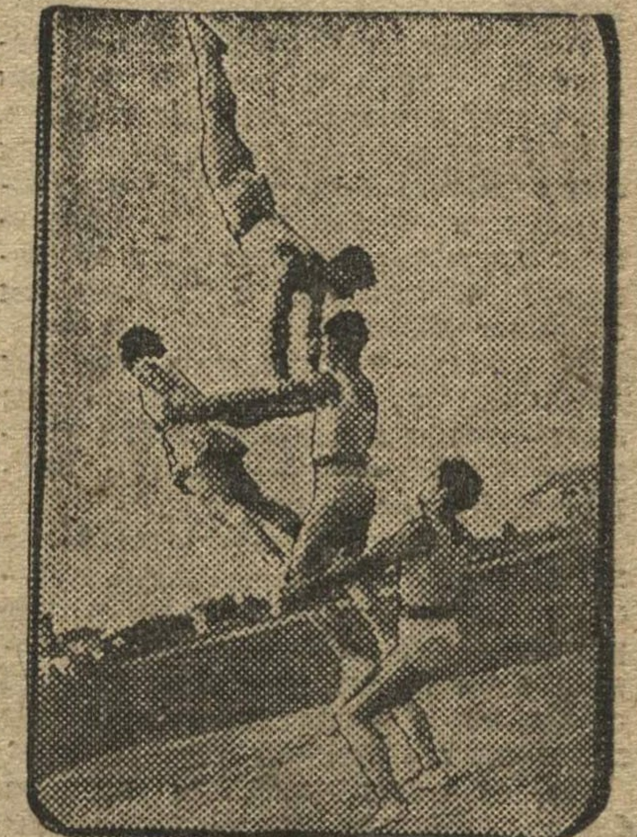
Хорошо на пляже заняться партерной гимнастикой.

Солнце светит, Дует ветер, Море ходит ходуном, Мы идем и узнаем Обо всем, Что есть на свете. Александр КОВАЛЕВСКИЙ.