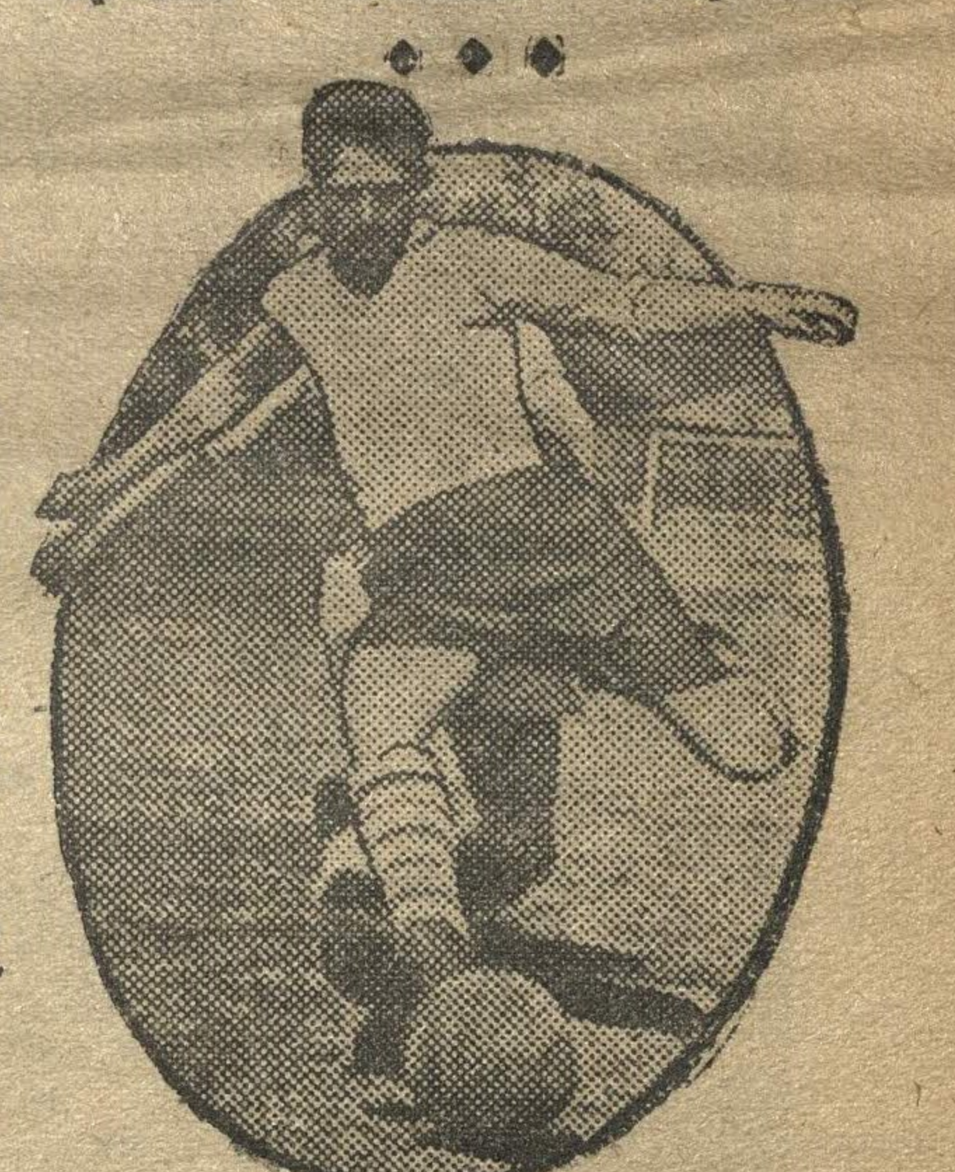
Сила, ловкость и быстрота необходимы при игре в футбол. Кто у кого отберет мяч и забьет в ворота противника?

◆ 18-24 июня состоится общегородской парад физкультурников. В нем примут участие не только физкультурники города, но и близлежащих районов — Балахны, Павлова, Дзержинска, Богородска и др., а также физкультурники Марийской области, ЧАССР. Всего в параде ожидается участие 30 тысяч человек.