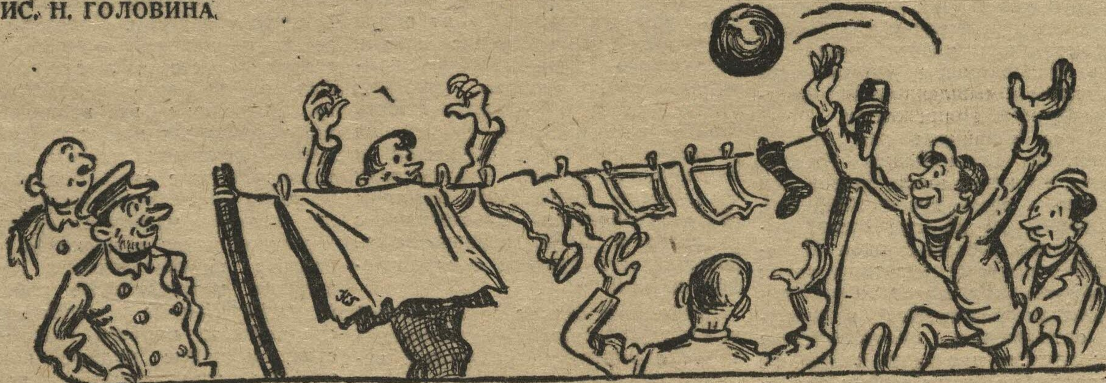
Единственная возможность поиграть в баскетбол.