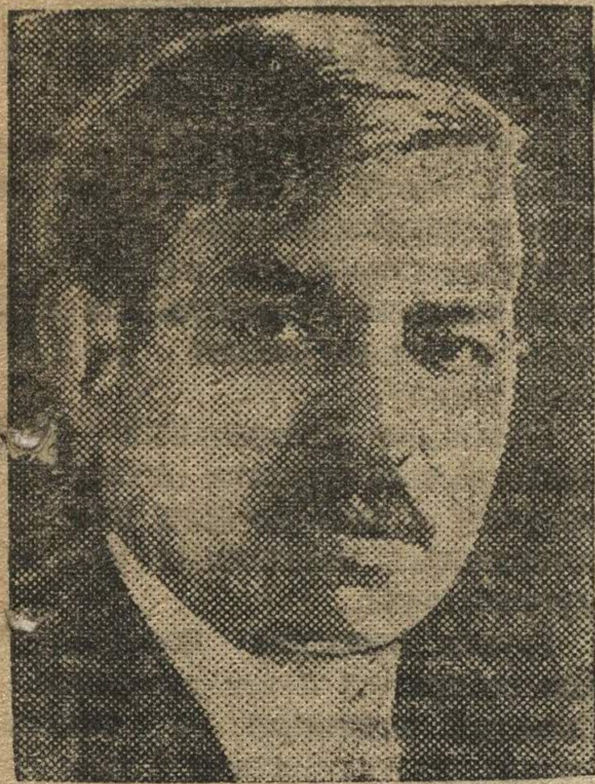
Французский министр иностранных дел Пьер Лаваль.