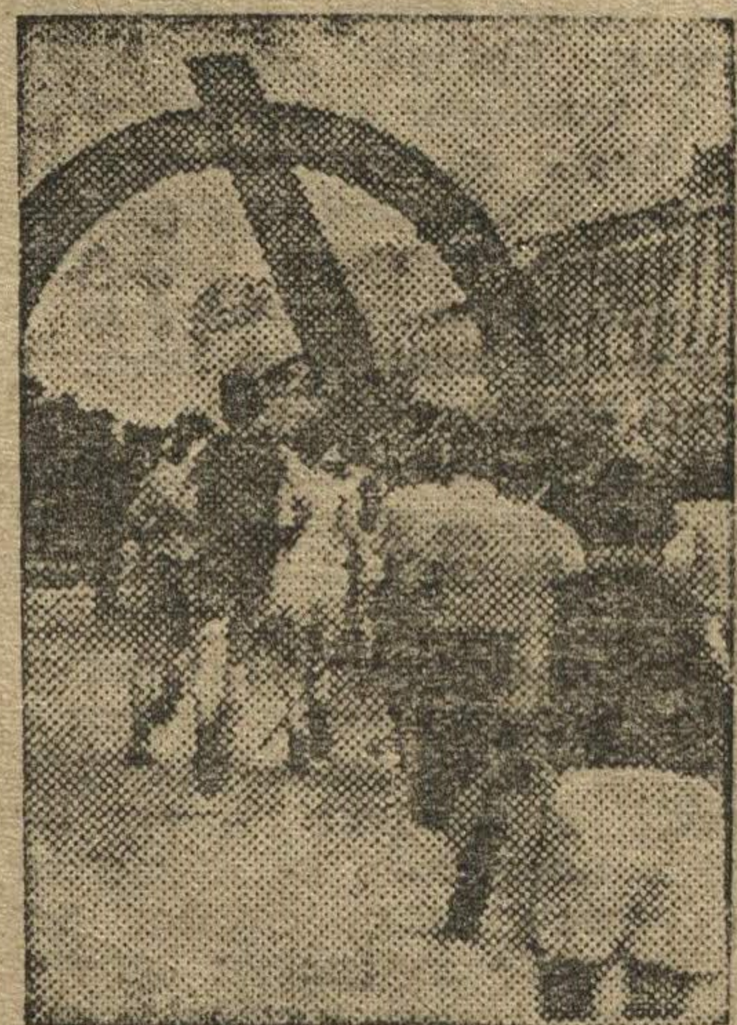
Финиш одного из забегов, состоявшегося вчера кросса имени Шверника.

На автозаводе имени Молотова кросс имени Шверника состоится 18 мая.