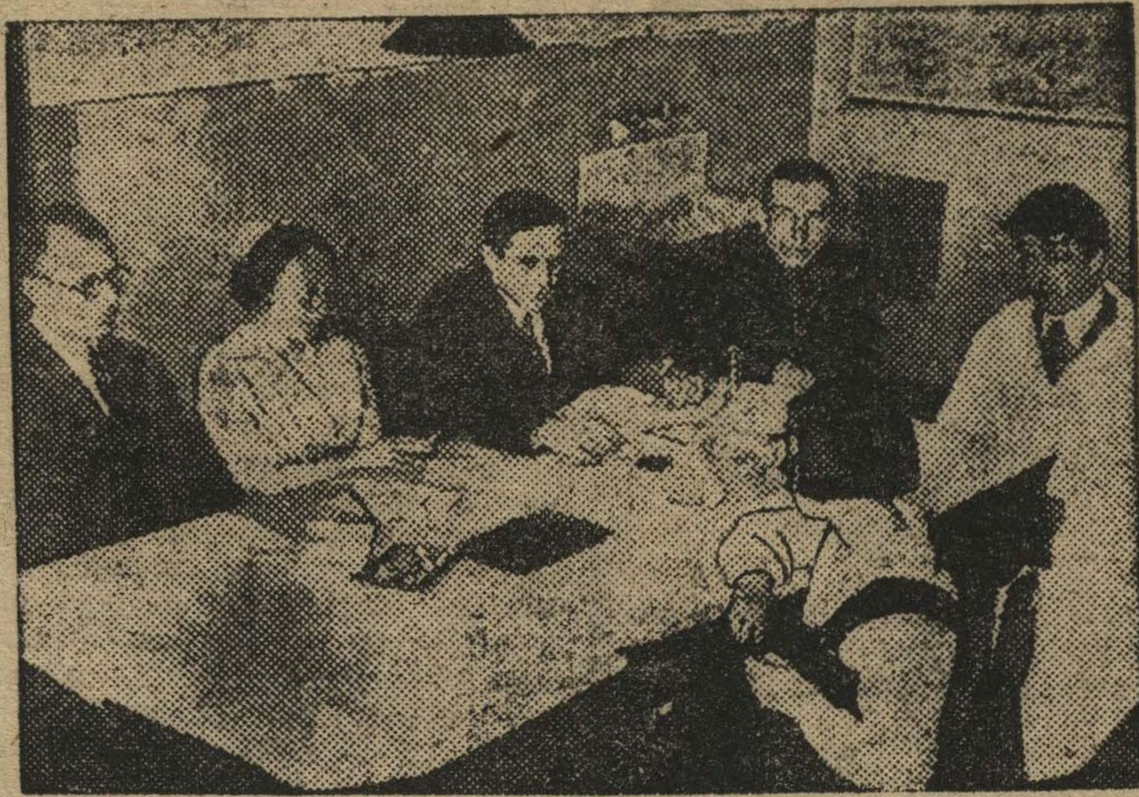
В институте идут гостехэкзамены. На снимке: студента 5 курса сдает гостехэкзамен.

(Беседа с экзаменатором проф. Супоницкой).