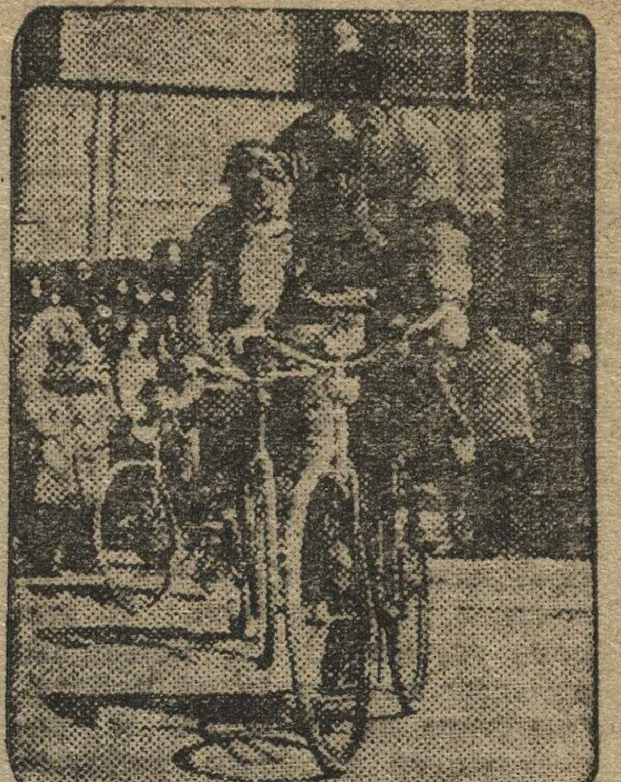
В Вене были проведены воздушные маневры. На снимке: военные велосипедисты в противотанковом районе «газовой атаки».

Тем же поездом в Москву прибыло около 30 специальных корреспондентов французских телеграфных агентств и крупнейших столичных и провинциальных газет, а также ряд виднейших французских деятелей.