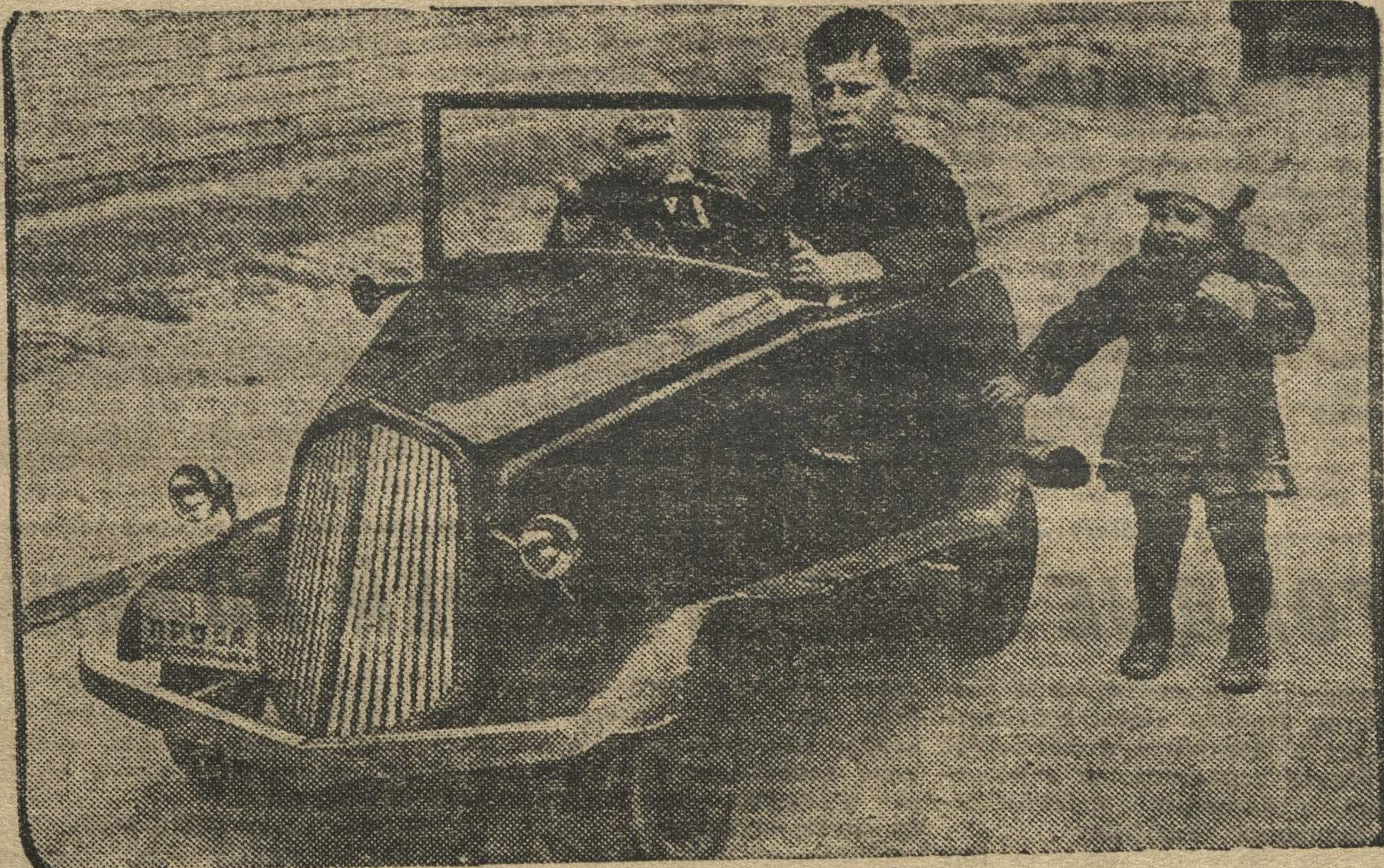
Детский автомобиль с одноцилиндровым веломотором, собранный опытным путем в экспериментальном отделении мастерских. В ближайшее время такие детские автомобили будут выпускаться серийно.

Отв. редактор Д. ЛУКИН. Издатель: ИЗДАТЕЛЬСТВО «ГОРЬКОВСКАЯ КОММУНА».