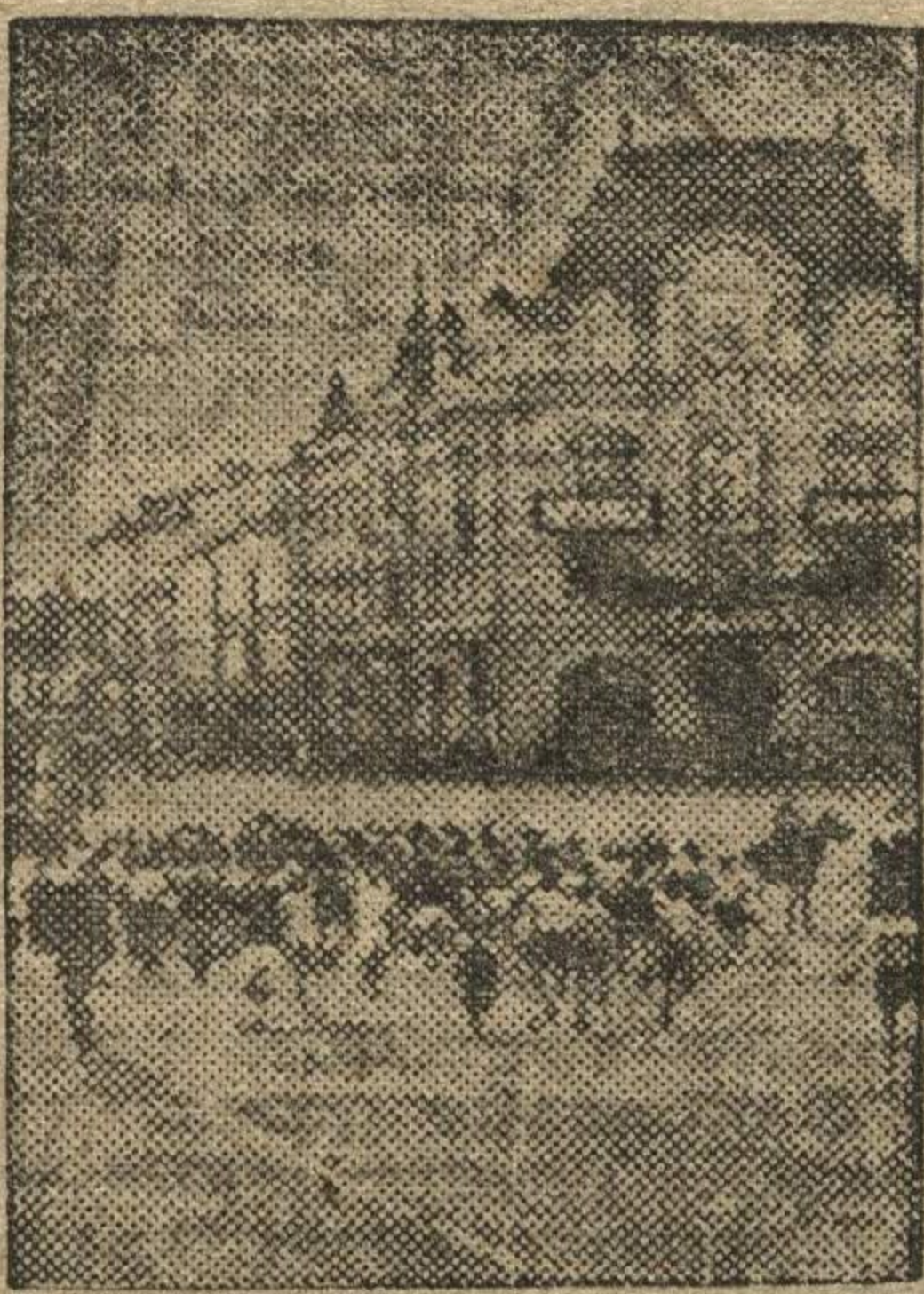
Участники кросса им. Шверника бегут по Свердловской улице.