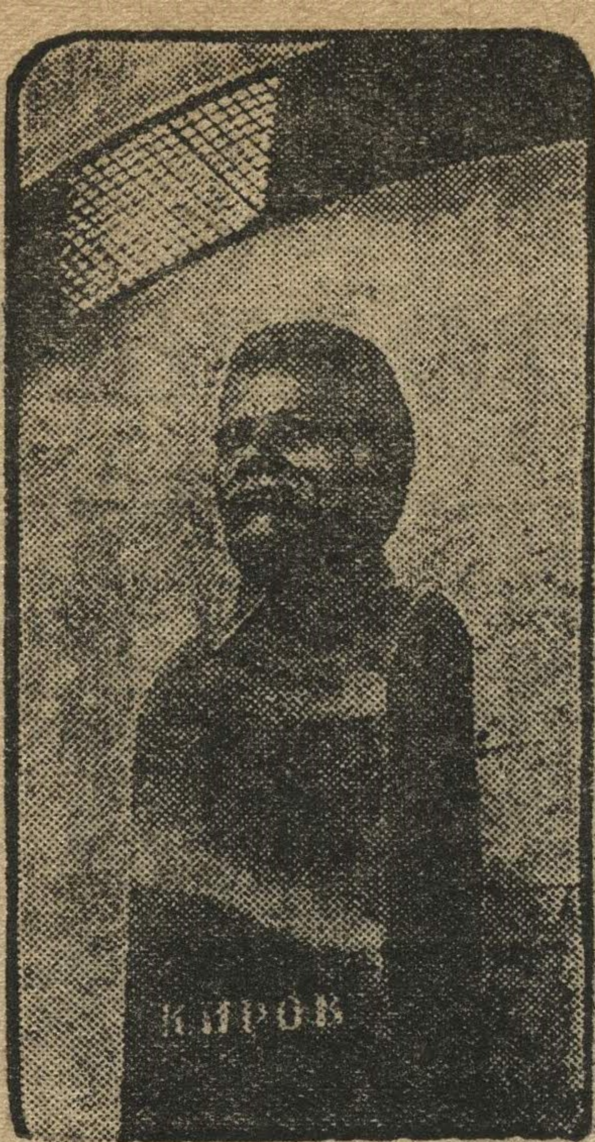
Бюст С. М. КИРОВА, — работа заслуженного деятеля искусства М. П. Манизера, установленный на станции «Кировская» московского метрополитена.