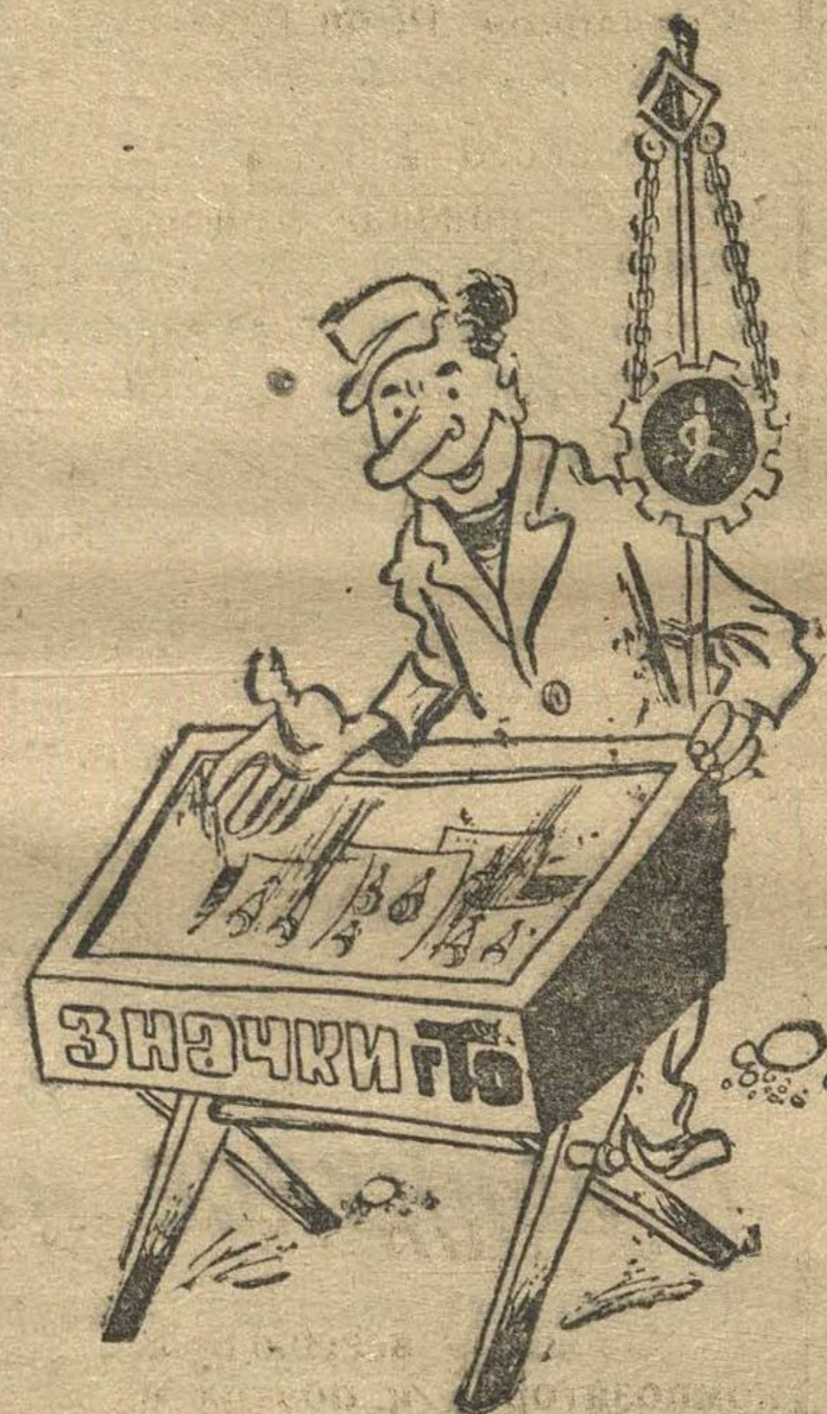
Способ распространения значков, изобретенный т. Джексоном.