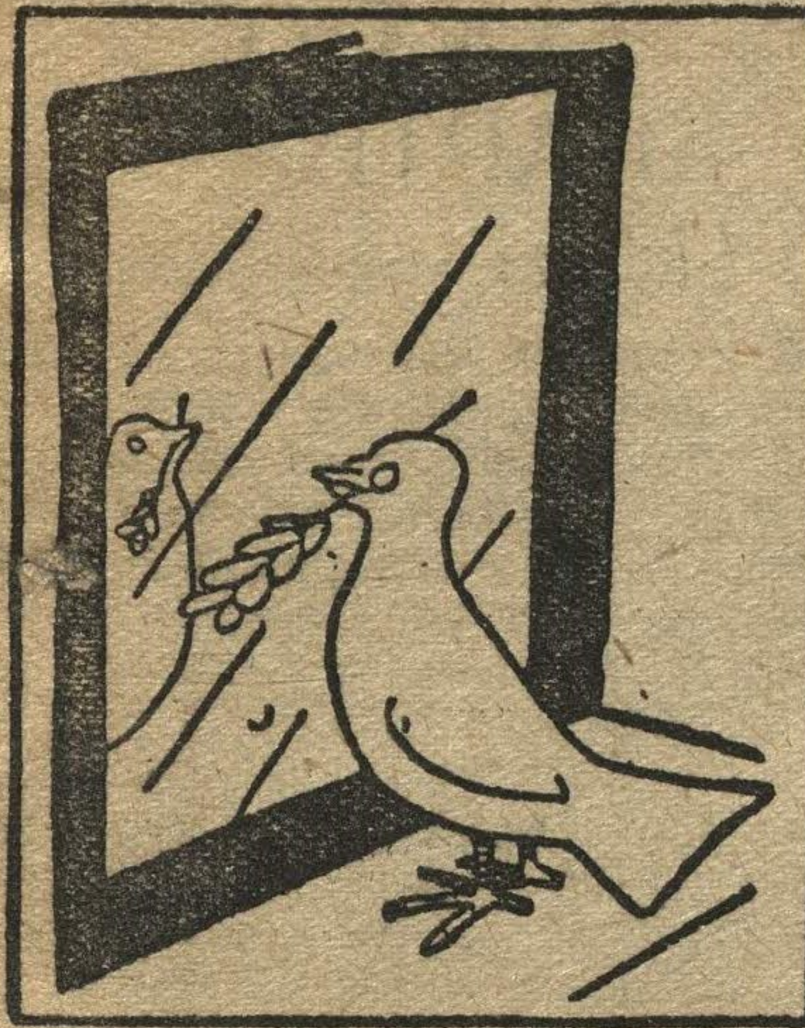
Эта оливковая ветка уже совсем ушла из моды, пора завести себе противогаз.