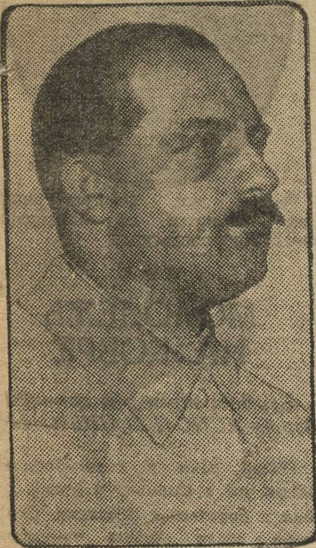
Л. М. КАГАНОВИЧ. (Портрет заслуженного деятеля искусств И. И. Бродского).

Идея товарища Сталина о создании в пролетарской столице подземной железной дороги воплощена в бетоне тоннеля, в мраморе станций. Метро существует и действует. Вся страна приветствует это замечательное событие, как выдающуюся победу социализма.