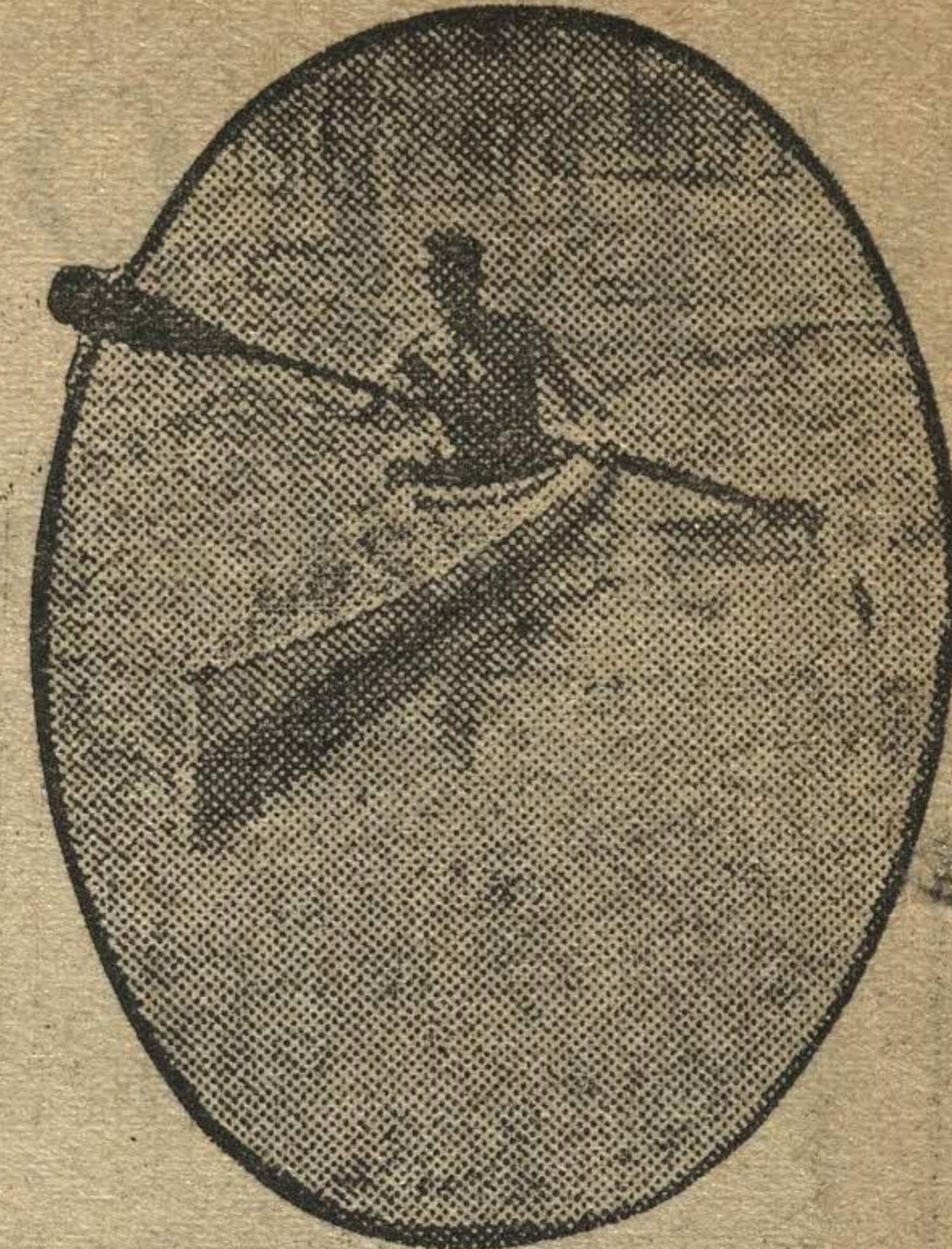
Теплые дни, физкультурники уже катаются на байдарках.

Коллективно провели выходной день школьники завода им. Свердлова. В 12 часов в заводском доме культуры состоялся чрезвычайно интересный вечер самодеятельности.