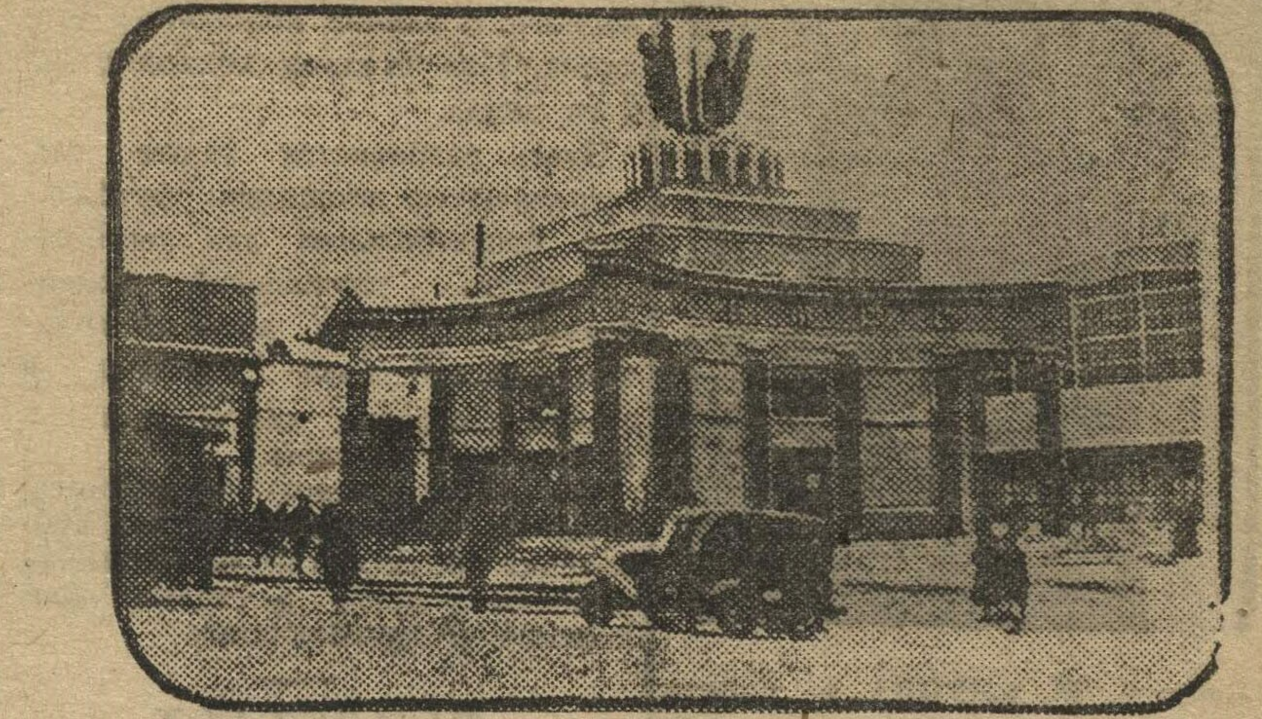
Станция метро «АРБАТСКАЯ ПЛОЩАДЬ».

Московские капиталисты не имели возможности на свои средства построить метро. В то же время, они боялись, чтобы этот жирный кусок не попал к иностранным концессионерам.