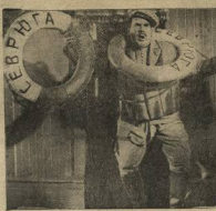
Николай Гусев в роли артиста Илья Ивановича в фильме «Волга-Волга».