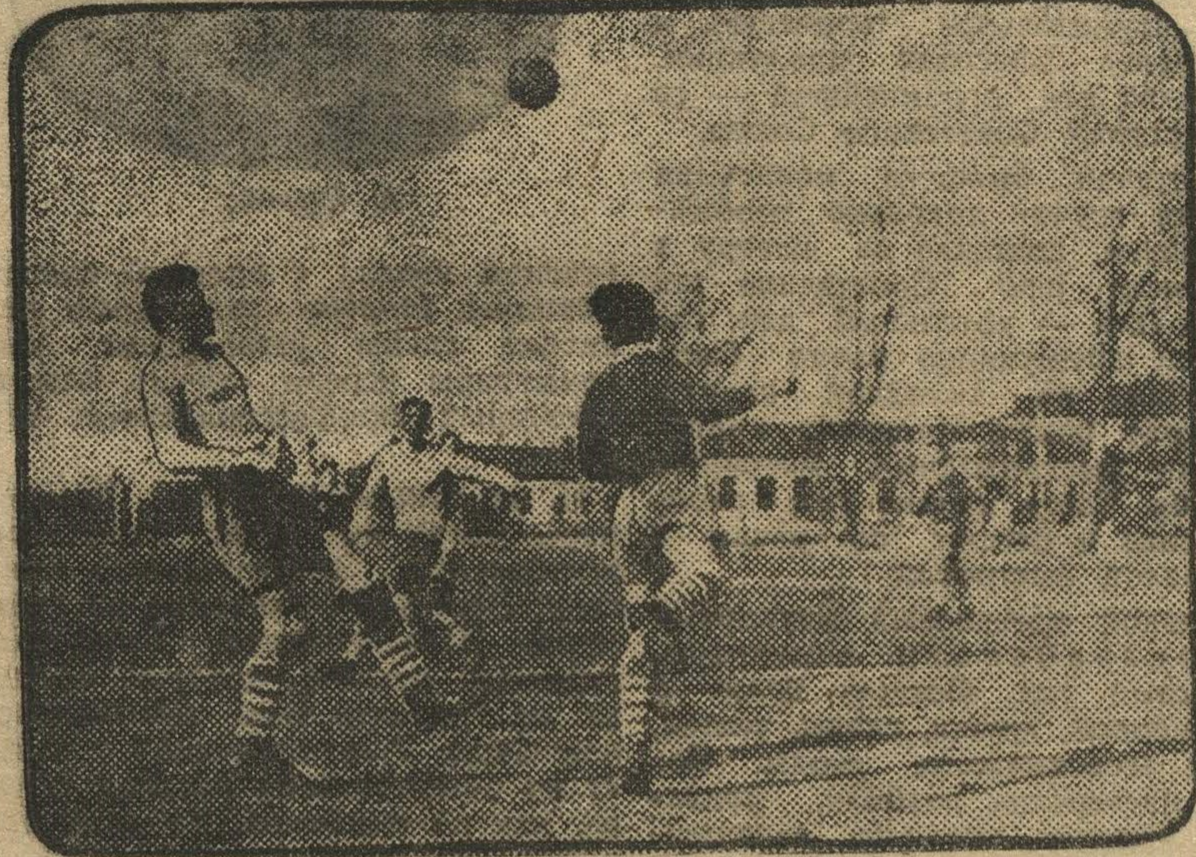
На футбольном поле.