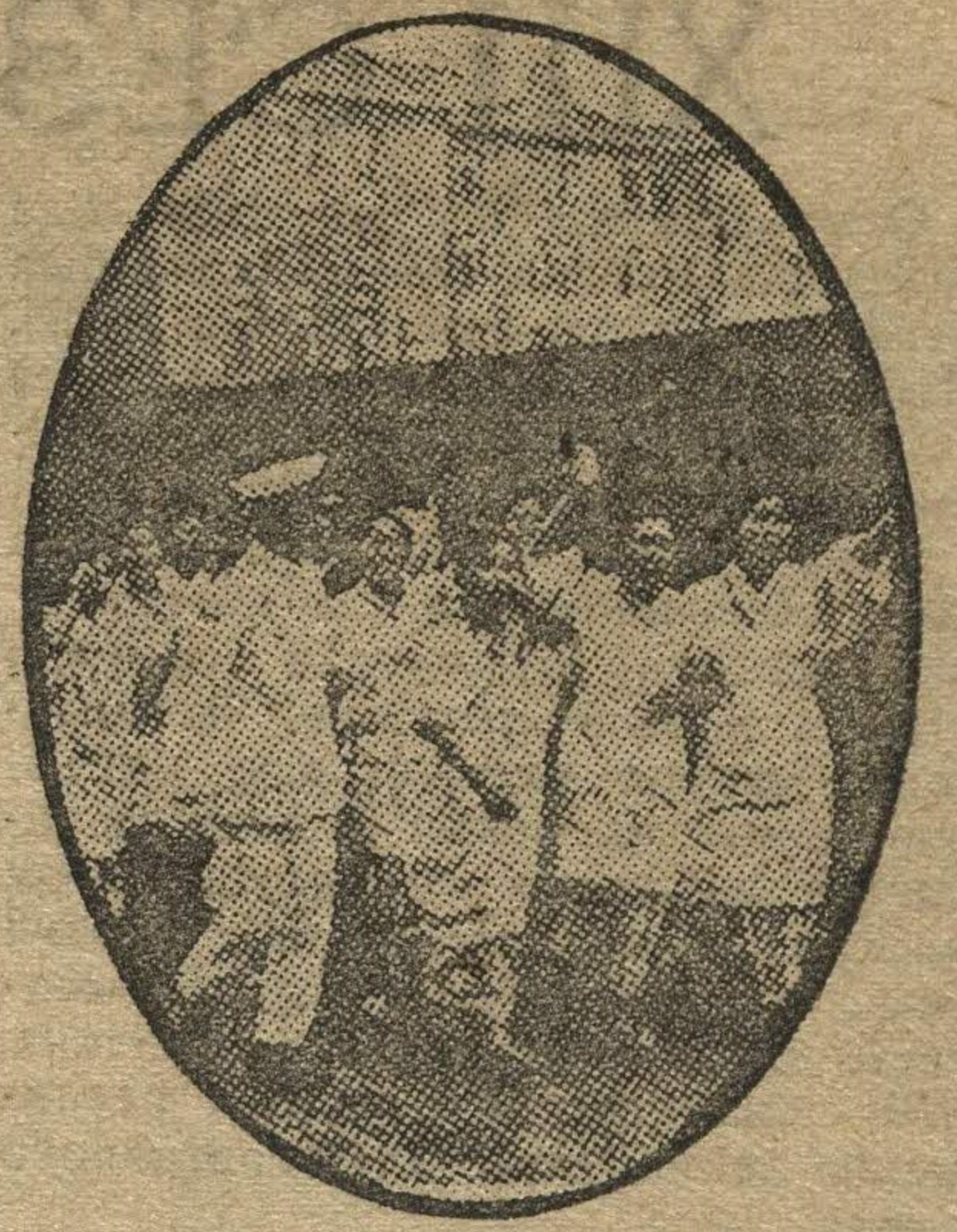
Демонстрация бастующих рабочих в Токио, требующих повышения зарплаты.

Во-вторых, — умело довести государственный план развития животноводства до сельсовета, колхоза, колхозника и единоличника. Надо предупредить и предотвратить попытки сделать это бюрократически, механической рассылкой плана по почте, как это «додумались» сделать в Тоншаеве. Доведение плана до колхоза, колхозника и единоличника должно стать большой массово-политической работой.