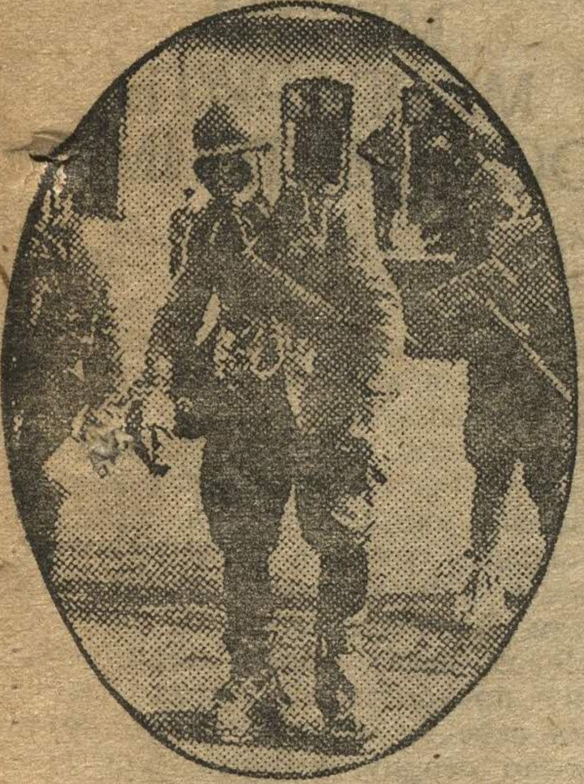
Противоздушные маневры состоялись недавно в Бухаресте. На снимке: дегазационный отряд на улице Бухареста.