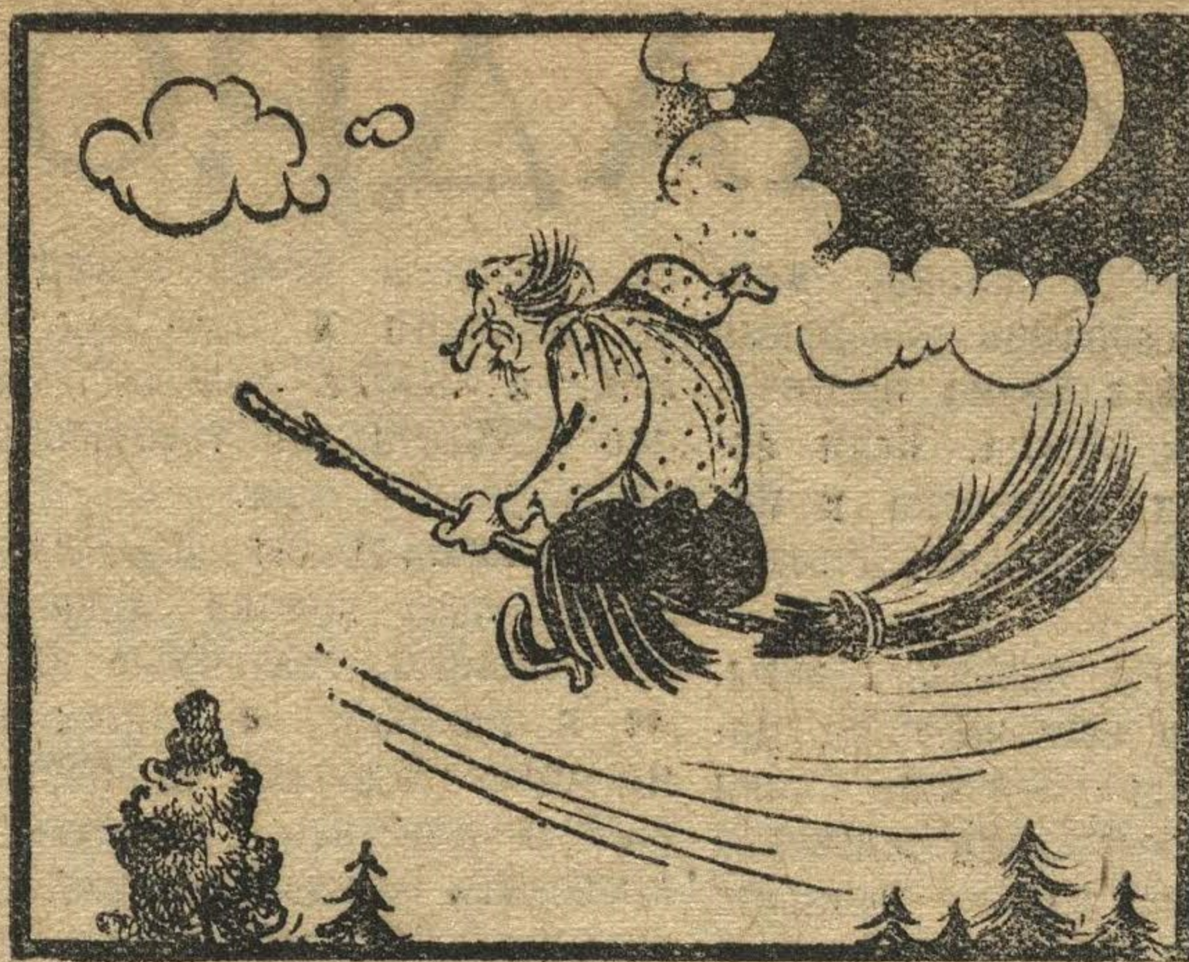
В старые годы «говорят» Баба-Яга выезжала на метле