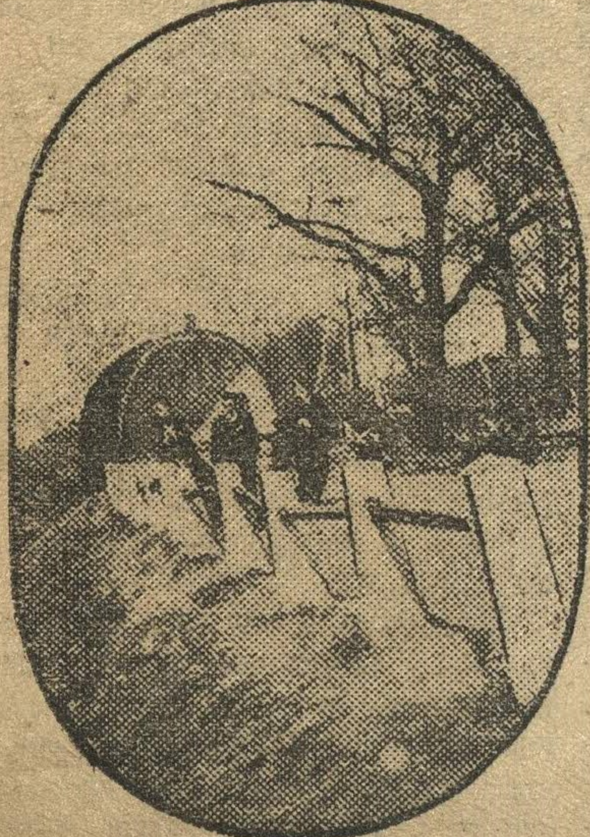
В Мининском садике.

Отв. редактор Д. ЛУКИН. Издатель: ИЗДАТЕЛЬСТВО «ГОРЬКОВСКАЯ КОММУНА».