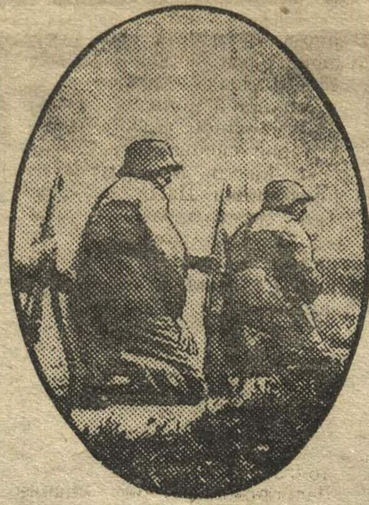
13 мая в Брукнейдорфе (Австрия) происходили маневры штурмовой полиции для проверки ее боеспособности. На снимке: патруль полиции на маневрах.