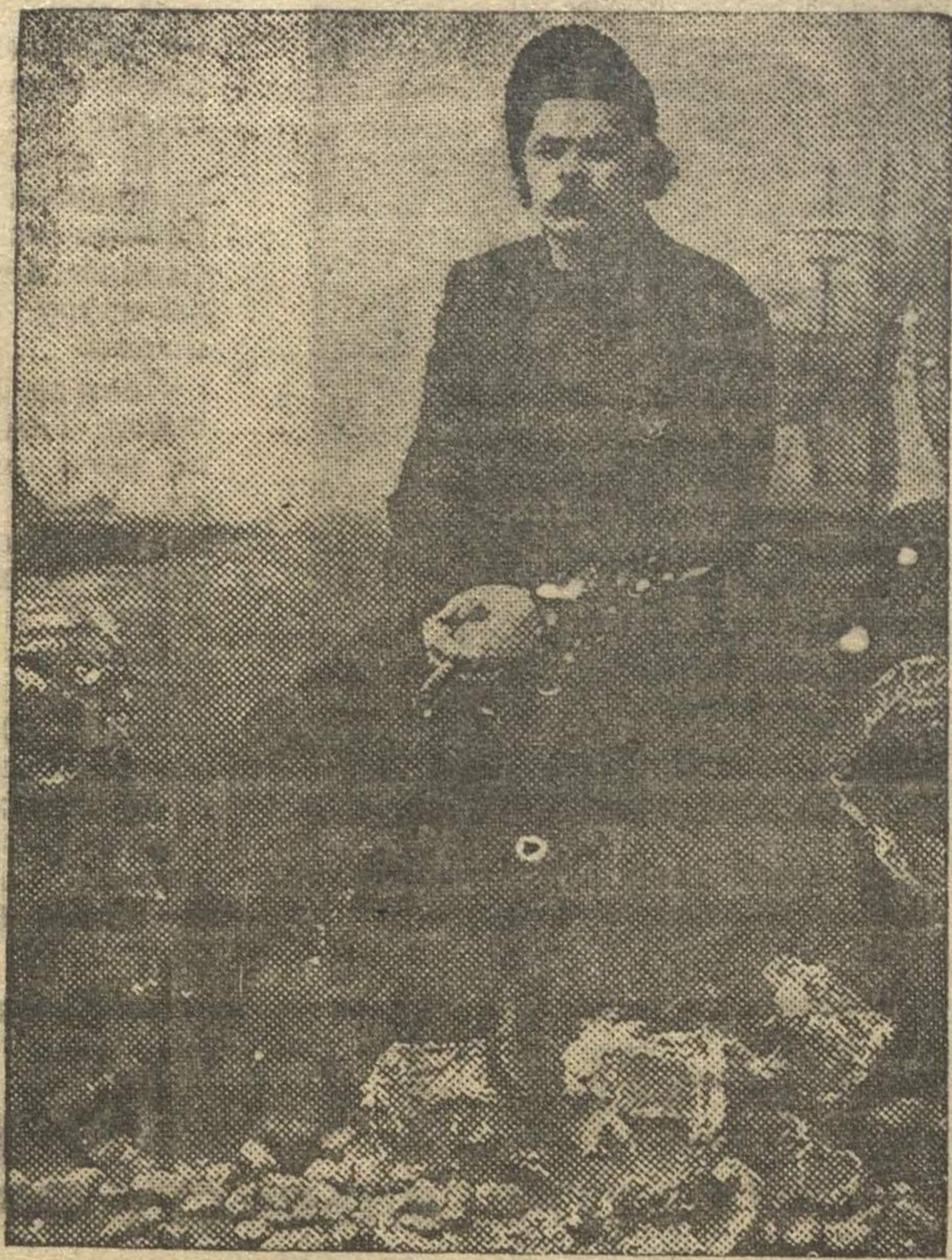
Максим Горький в период организации Народного дома в старом Нижнем (1902 г.).