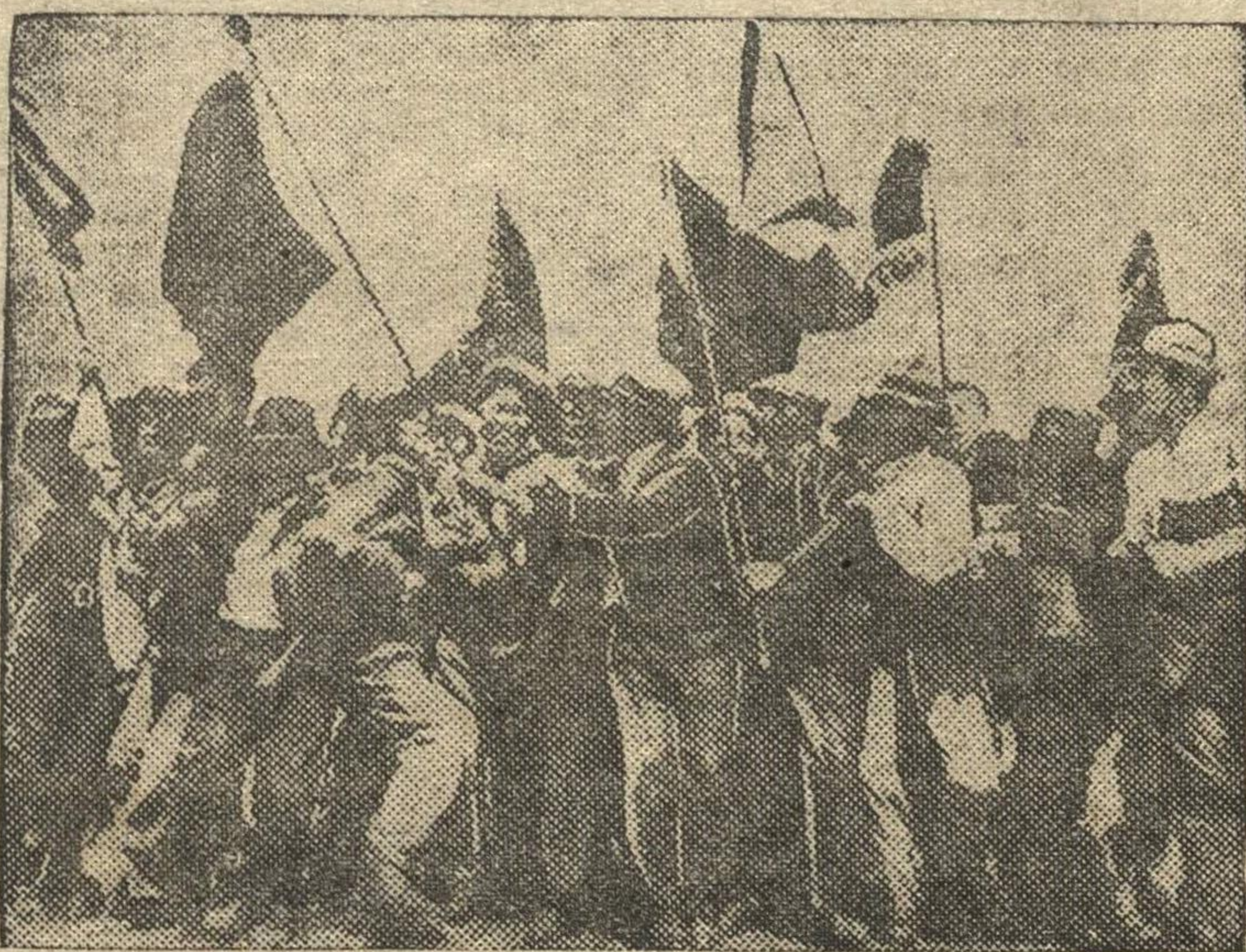
Первомайская рабочая демонстрация в Токийском Шита-парке.

Хорошо работает комсомольская конюшня при колхозе им. Сталина, Мари-Турекского района. Здесь конюхами работают, соревнуясь между собой, три лучших комсомольца. Все кони хорошо упитаны.