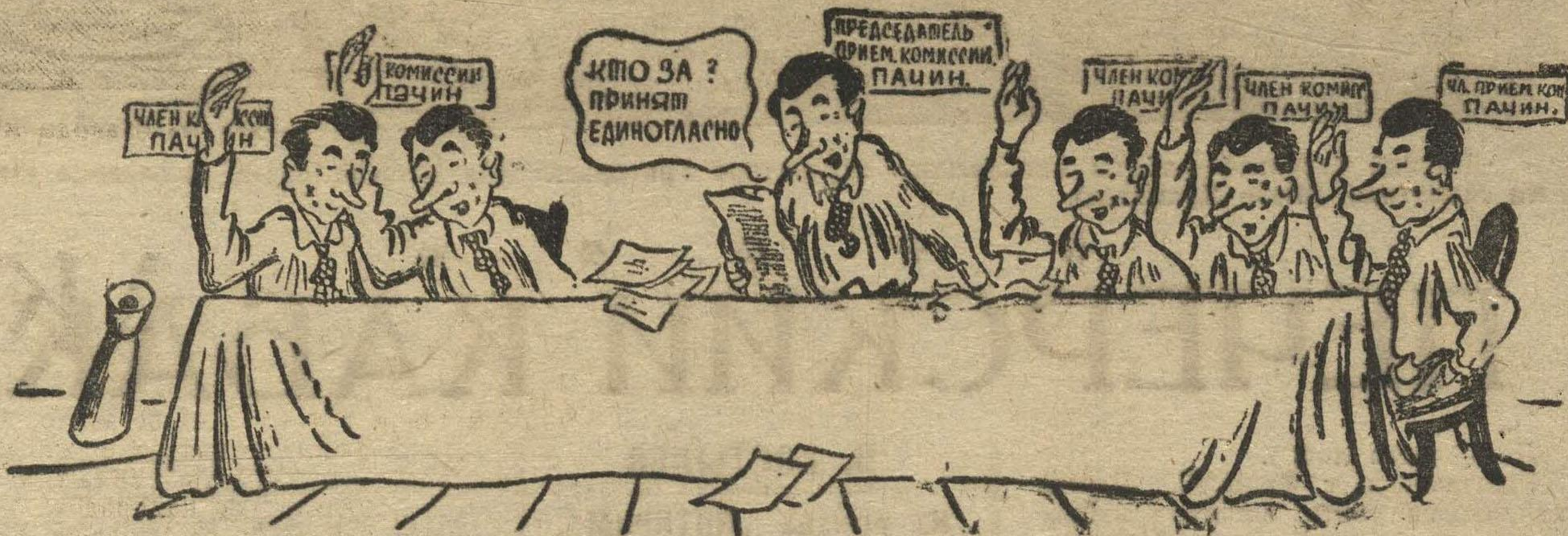
Рис. Н. ГОЛОВИНА.