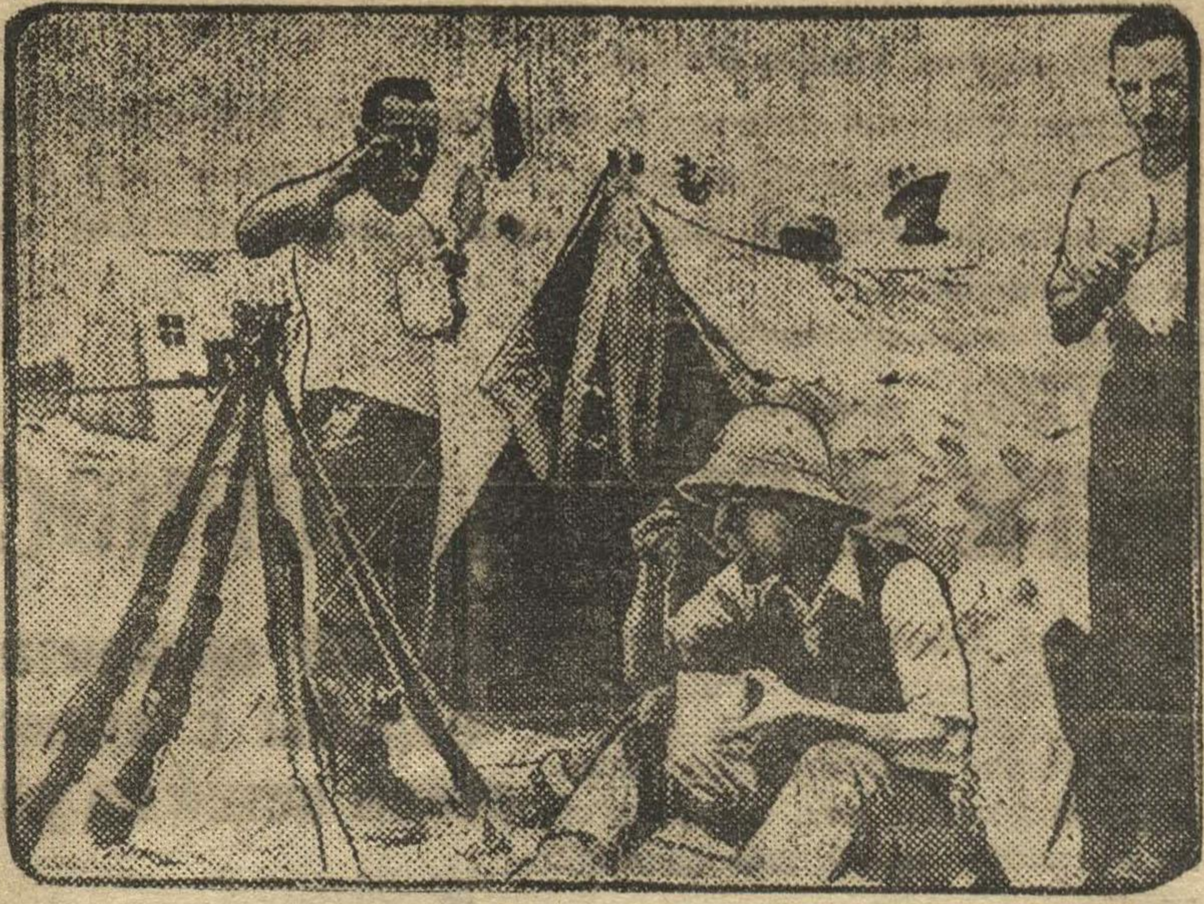
На снимке: палатки итальянских колониальных войск в Сомали (Восточная Африка), разрисованные под окружающий ландшафт.