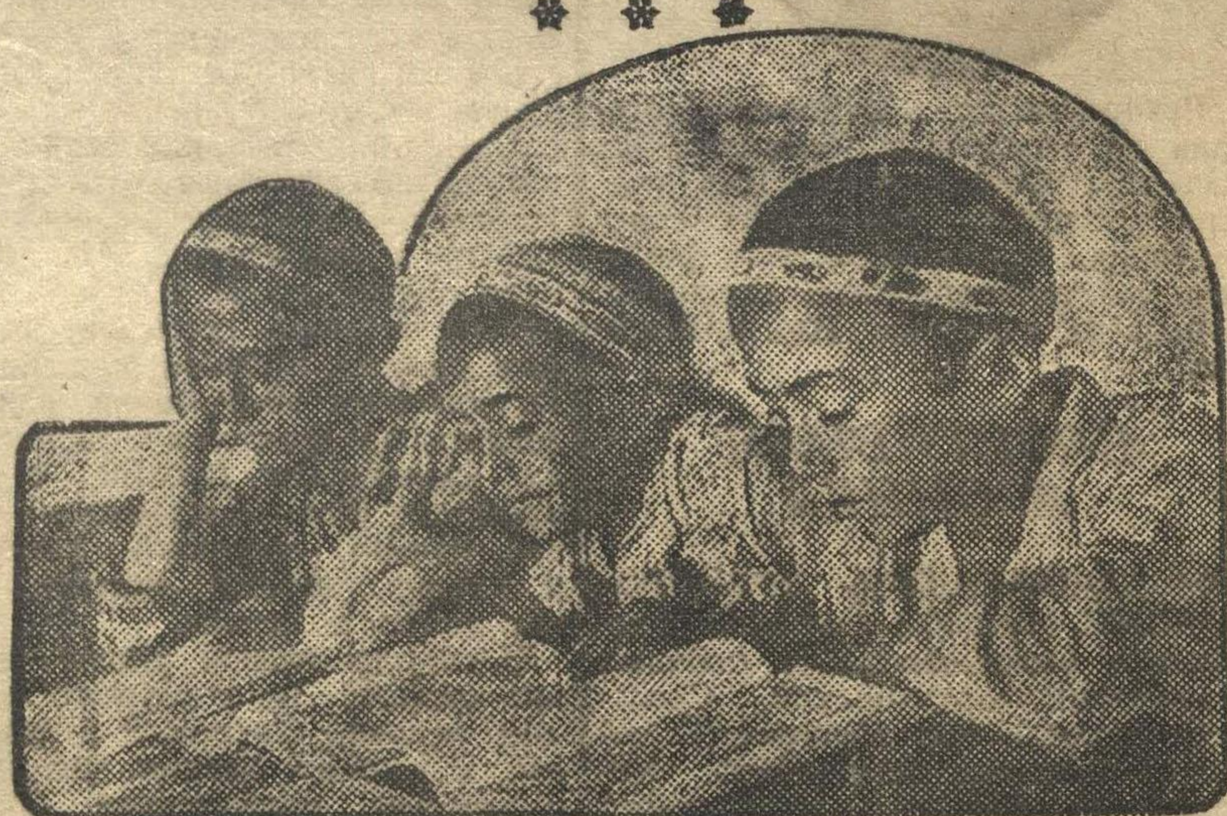
Школьники школы колхозной молодежи в Бухаре (Узбекистан) готовятся к зачетам по географии.

А. ГЕРАСИМОВ. Село Тюрлема, Козловского р-на, ЧАССР.