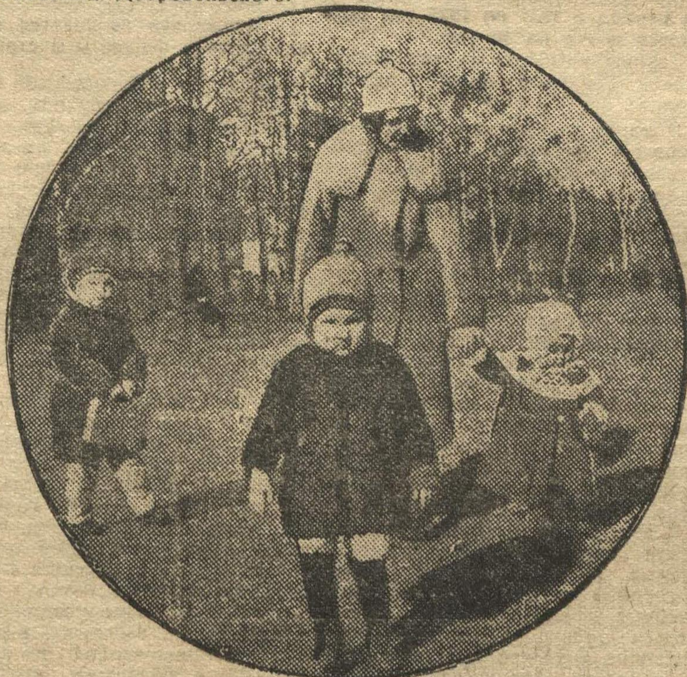
В Вязинском садике

Комиссиям партийного и советского контроля поручено систематически проверять выполнение настоящего постановления.