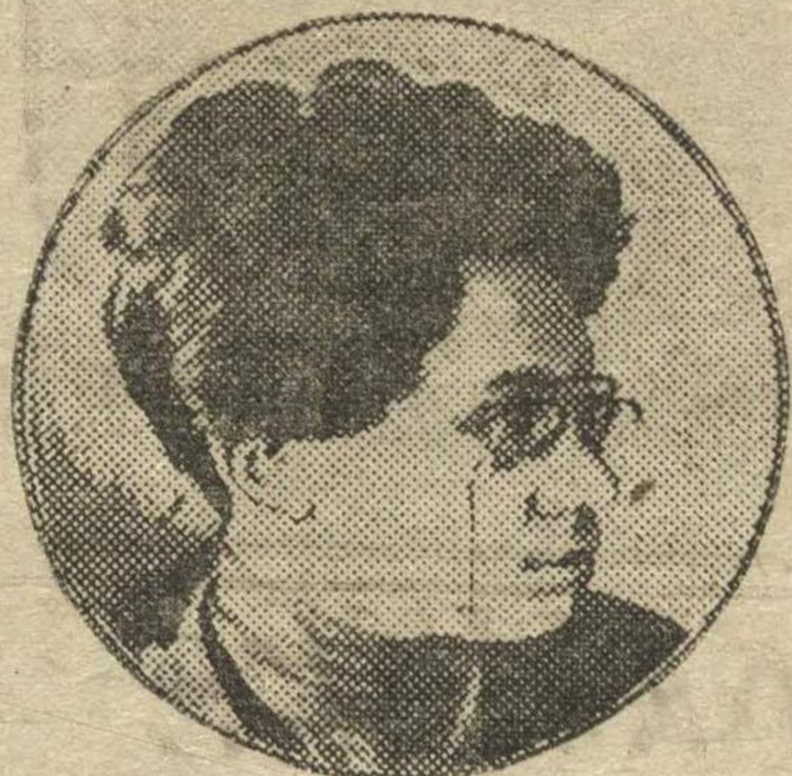
Яков Свердлов в юношеские годы.

В конце мая Свердлова освободили, как отбывшего наказание. Яков установил через «Красный крест» прочные связи с заключенными по делу нижегородской демонстрации 1902 года. Возвращения и листовки выпускались в связи с