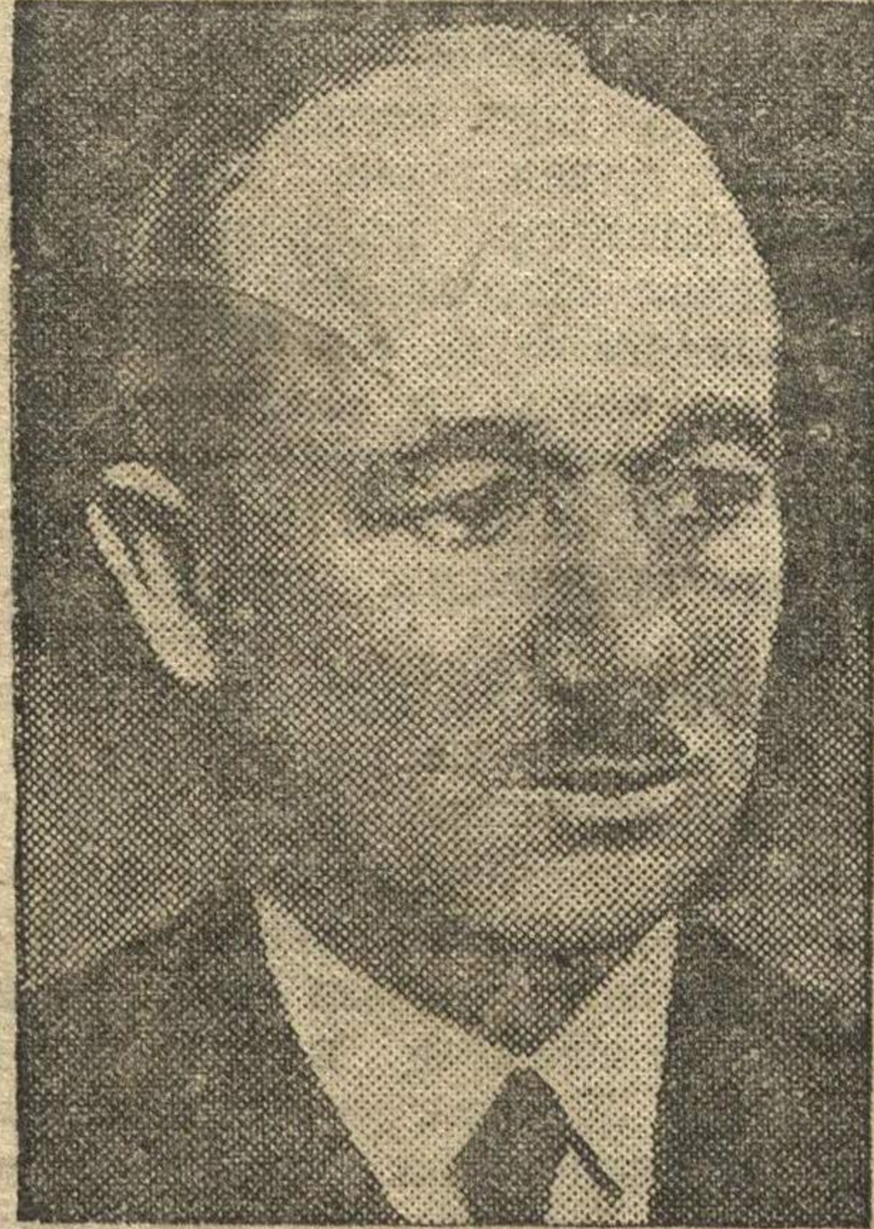
Д-р ЭДУАРД БЕНЕШ.