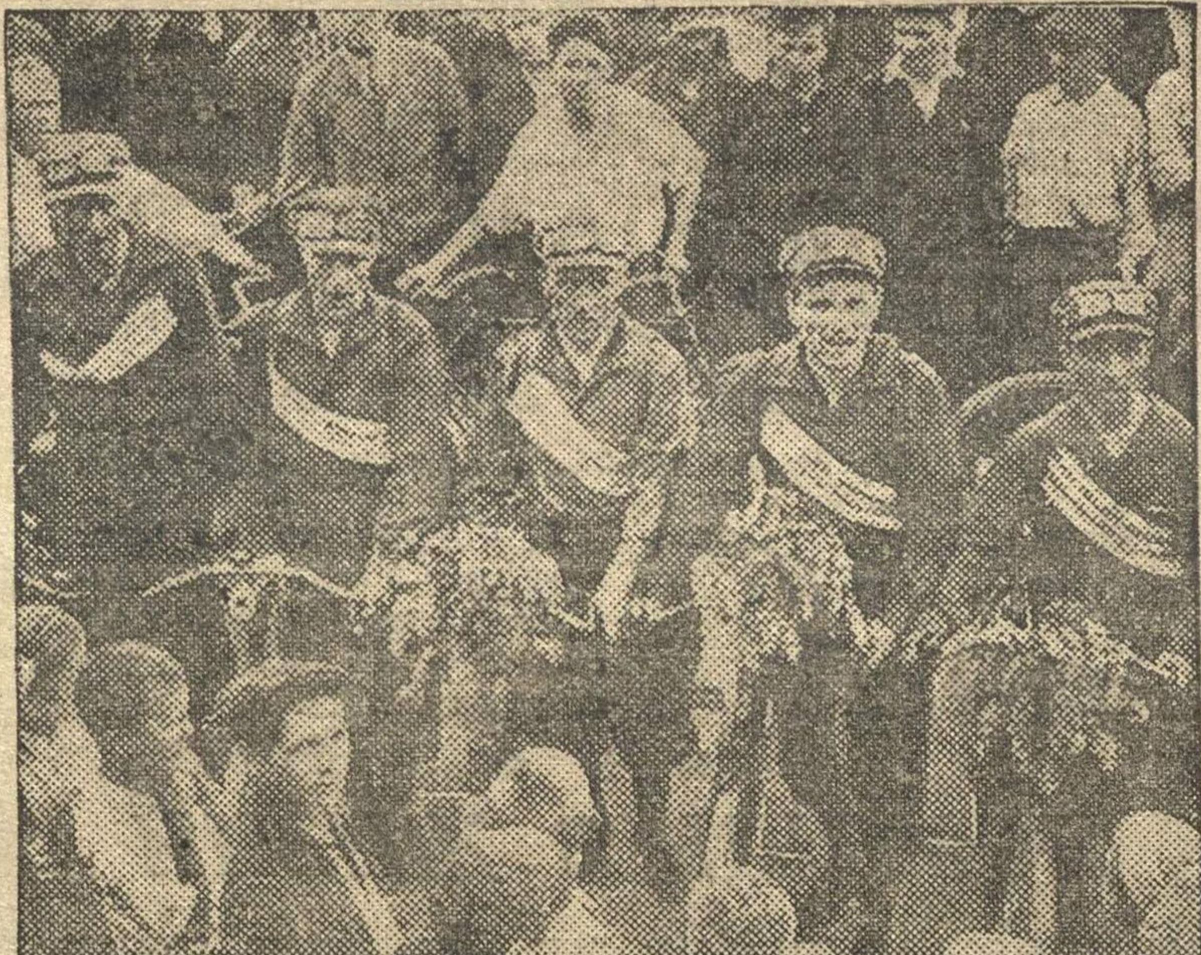
Участники всесоюзного вело-дорожного пробега в городе Горьком.

В выставке примут участие около 20 художников города и района.