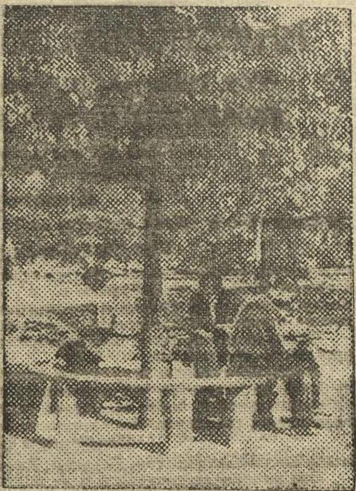
В выходной день в сквере на Советской площади.

Зам. секретаря Сталинского РК ВЛКСМ г. Горького.