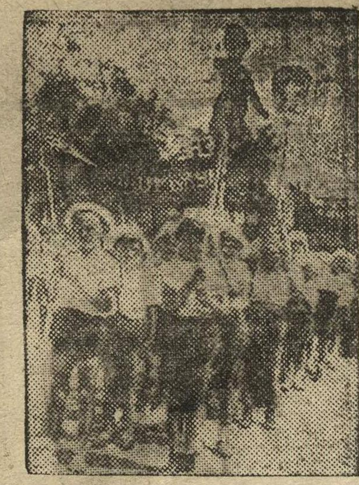
12 июня в Звездинском садике проведен детский праздник. НА СНИМКЕ: колонна детсада имени Фрунзе.