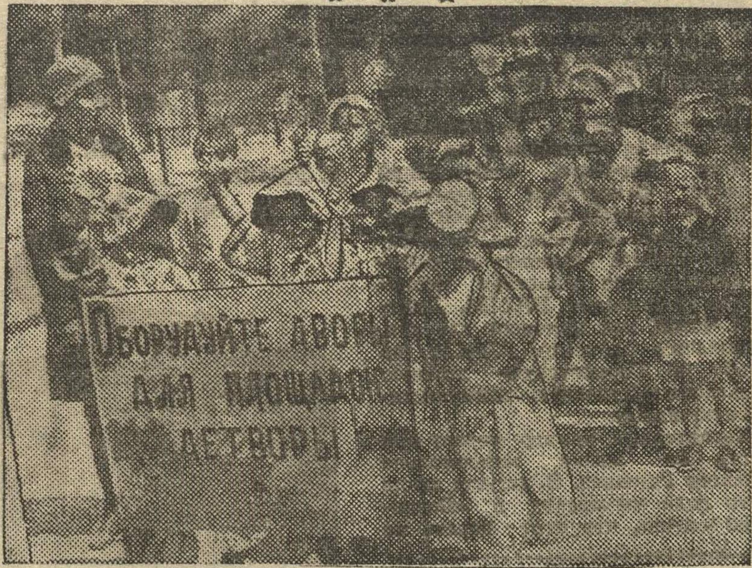
Детсад им. Фрунзе на детском празднике 12 июня в Звездинском садике Свердловского района.