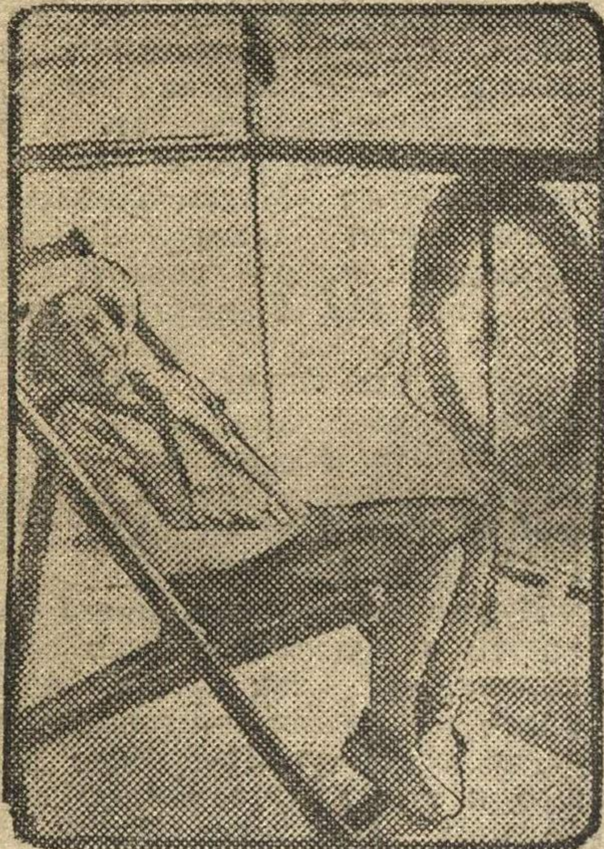
Хорошо отдохнуть в качалке... (Фото Н. Головина).