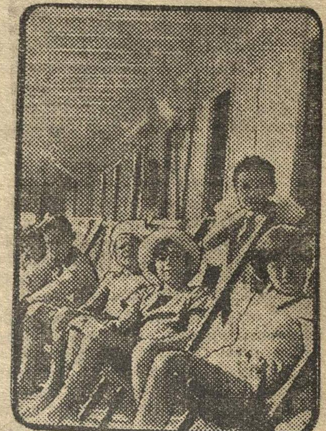
Ребята смотрят на живописные берега Волги.