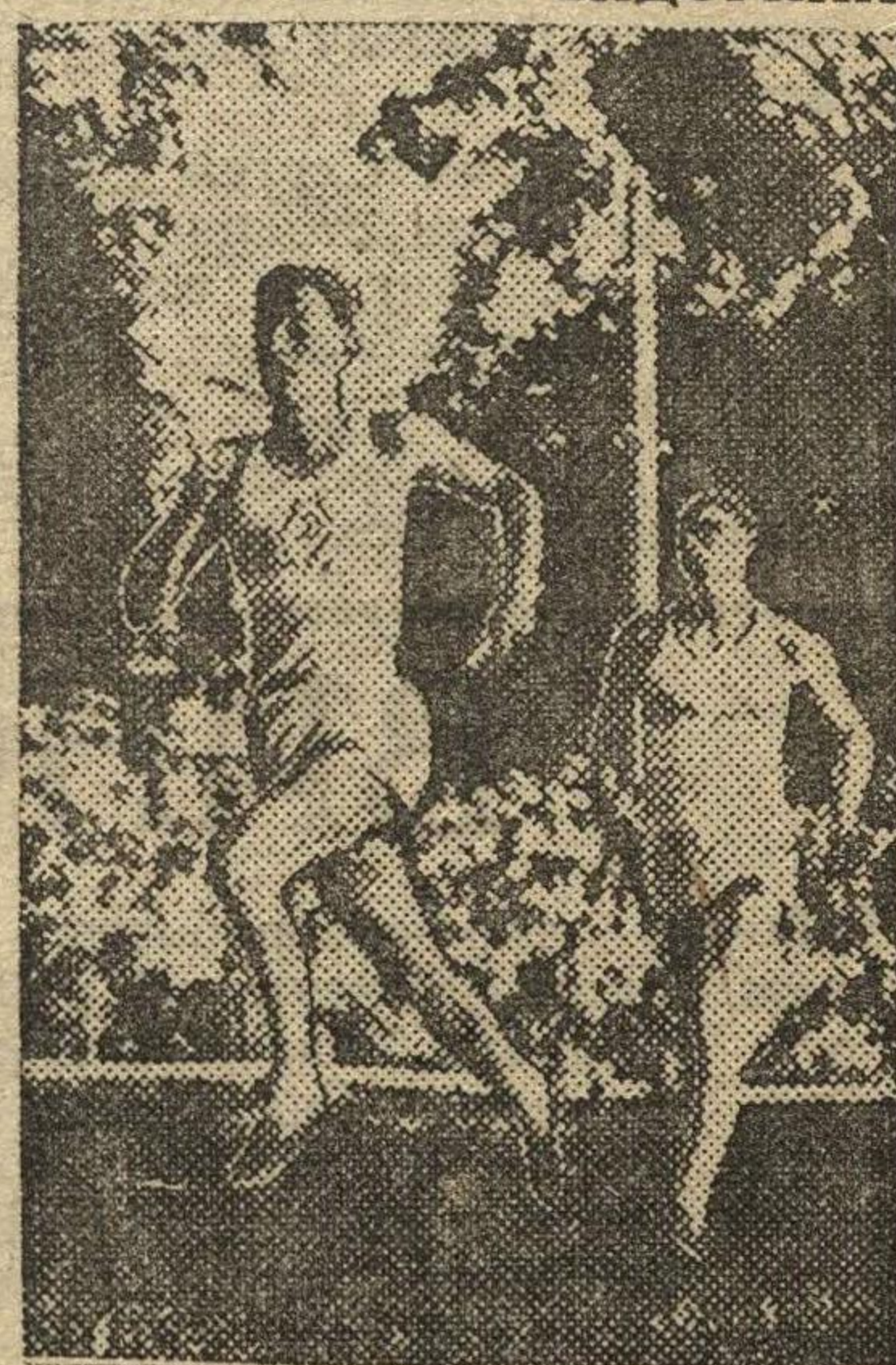
18 июня на стадионе «Динамо» была проведена эстафета 4x1500. На снимке: момент бега на одном из этапов.

Отв. редактор Д. ЛУКИН. Издатель: ИЗДАТЕЛЬСТВО «ГОРЬКОВСКАЯ КОММУНА».