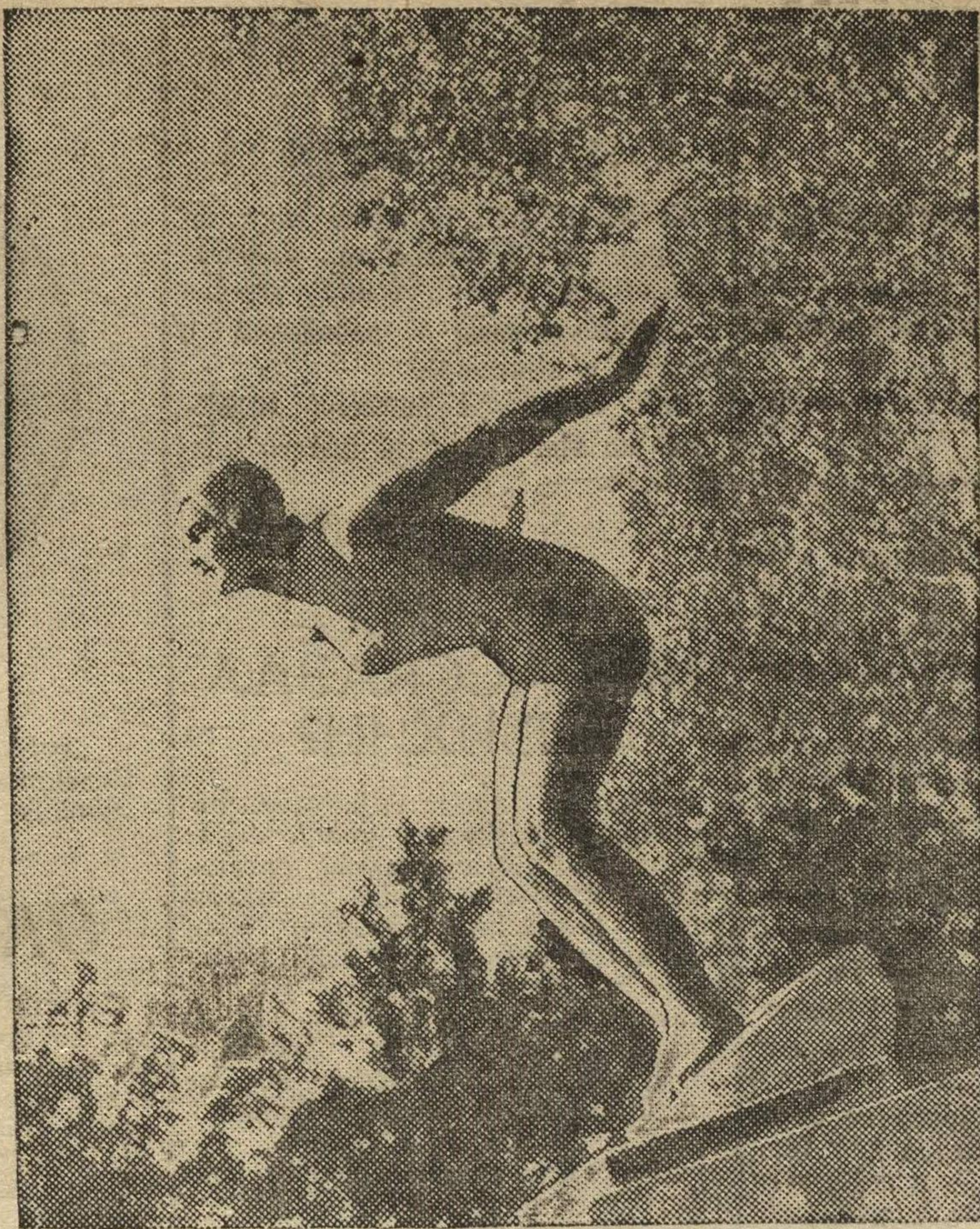
В саду имени 1 мая (г. Горький) у бассейна установлена скульптура спортсменки-пловца.