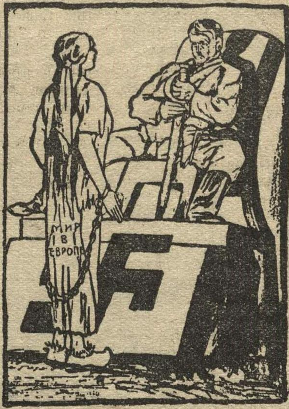
Мир: — «Я в ваших руках» («Дейли геральд», Лондон).

лишь через некоторое время родным в картонных коробках или в консервных банках. Так сделали фашисты после убийства нескольких рабочих Крулла и после убийств в Гамбурге.