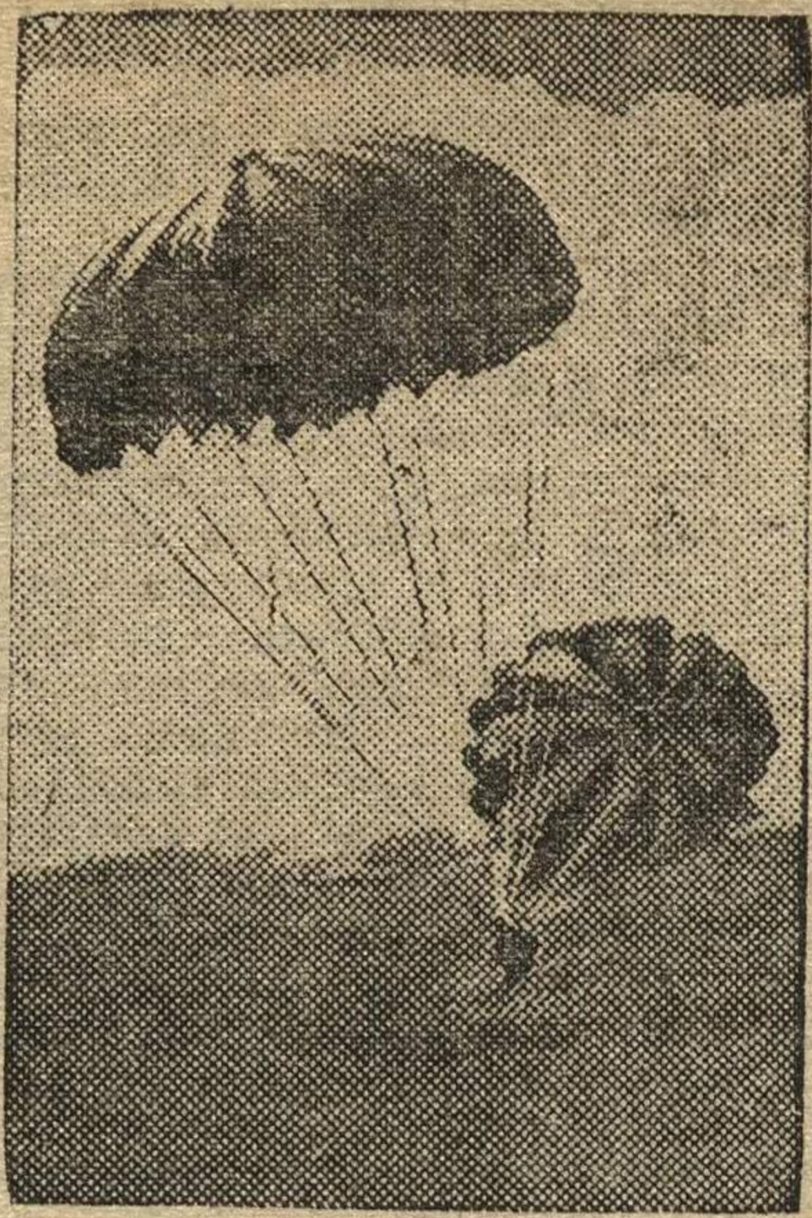
Парашютист готовится к приземлению.