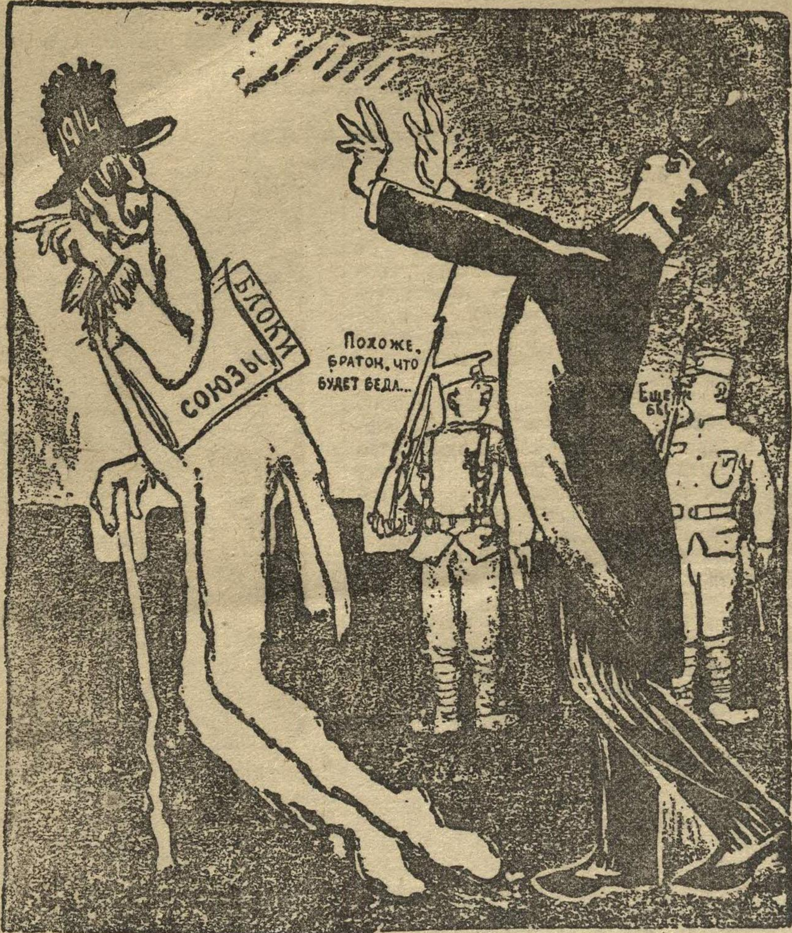
ГАМЛЕТ (и тени отца): — Блаженный дух, или демон проклятой, он все манит... Иди, я — за тобой! «Дейли геральд», Лондон.