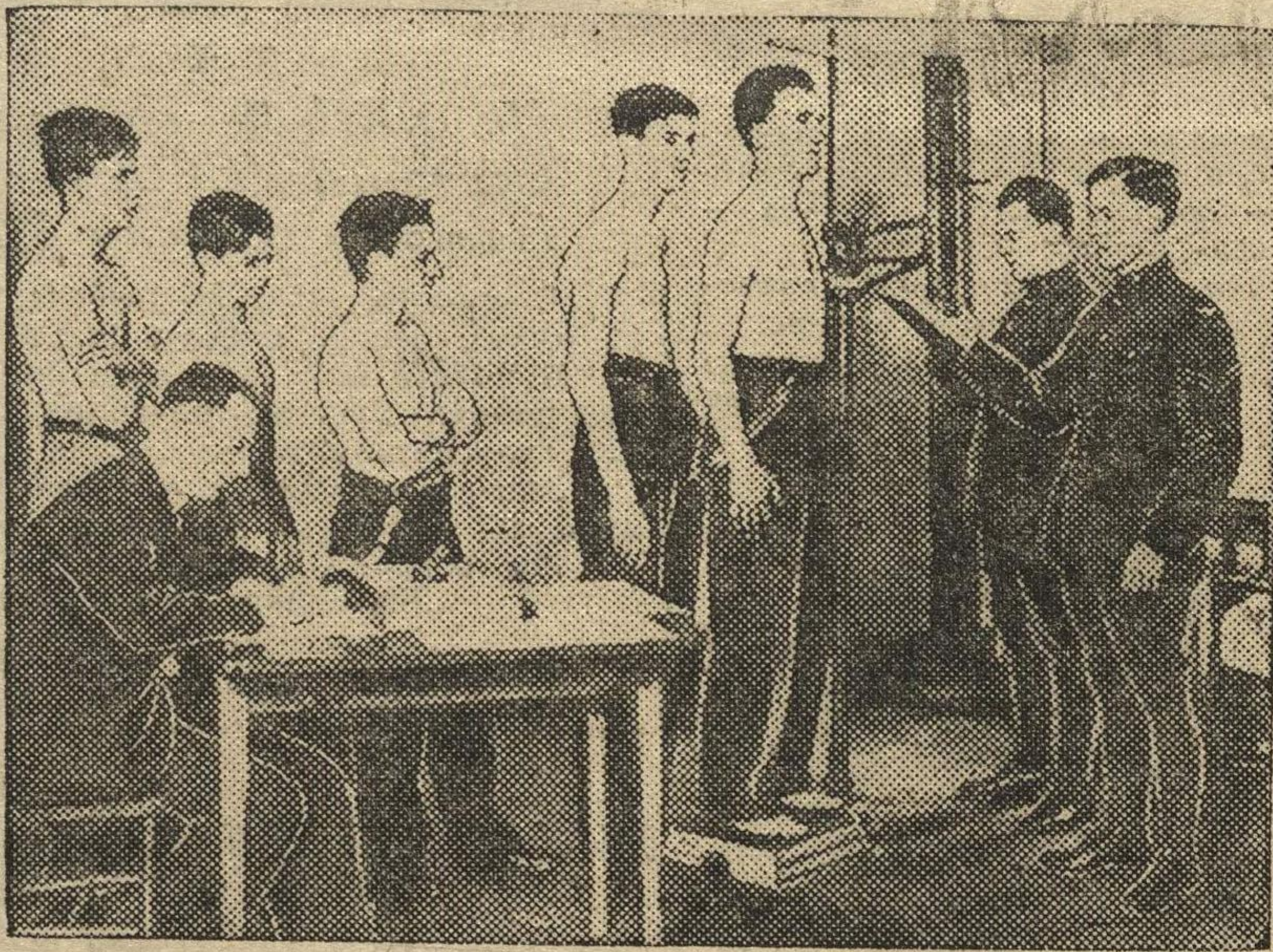
Объявленная английским правительством программа расширения воздушного флота ускоренным темпом проводится в жизнь. На снимке: осмотр новобранцев в Кингсвее.

Французский ответ отвергает германскую точку зрения с помощью аргументов политического, технического и юридического порядка, одновременно указывая, что перет подписанном советско-французского договора о взаимной помощи Франция пришла к соглашению по этому вопросу с гарантиями Локкарнского договора. Текст французского ответа не публикуется.